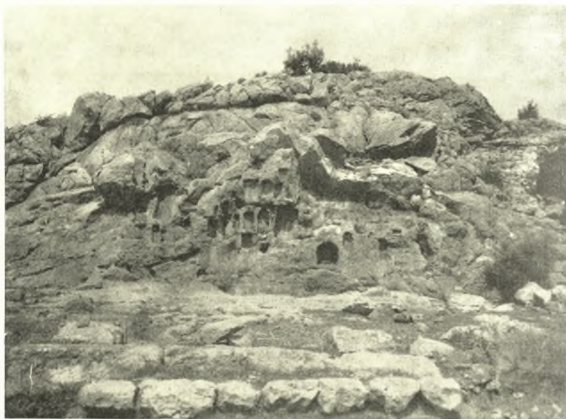
Εἰκ. 1. Ἱερὸν τῆς Ἀφροδίτης. Ὁ βράχος ὁ φέρων τὰς ἀναθηματικὰς κόγχας.

Πρὸ τοῦ βράχου τοῦ φέροντος τὰς κόγχας ἐκαθαρίσθη ἤδη ὁ βράχος, ὅστις κατὰ τὸ μέρος τοῦτο ἀποτελεῖ τὸ δάπεδον τοῦ Ἱεροῦ καὶ εὐρέθησαν διάφορα λαξεύματα, τὰ ὁποῖα ἐχρησίμευον διὰ τὴν στήριξιν ἀναθημάτων. Κατὰ τὴν ἀνασκαφὴν τοῦ Καμπούρογλου ἐσφύζοντο ἀκόμη καὶ ἄλλαι βάσεις