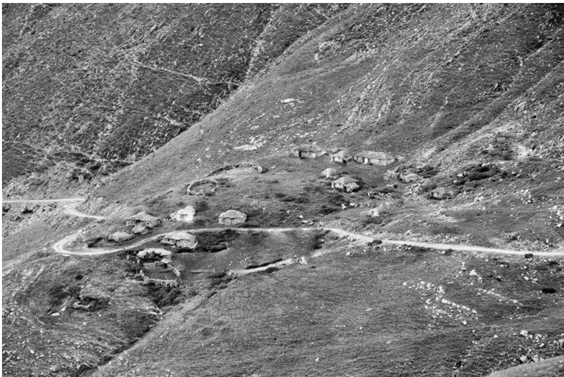
Σχήμα 6.1. Ο οικισμός του βοσκότοπου Πατουλιάς

Σχετικά με τις γεωλογικές, πετρογραφικές και εδαφικές συνθήκες στην περιοχή το βασικό πέτρωμα είναι οι σκληροί ασβεστόλιθοι, οι οποίοι απαντώνται κυρίως στις απότομες κορυφές και πλαγιές, και ελάχιστα στο κάτω μέρος, καθώς και στο δεξιό μέρος του τμήματος εμφανίζεται ο Φλύσχος. Τα εδάφη εμφανίζονται γενικά αβαθή και την παρεδαφιαία βλάστηση αποτελεί η ποώδης βλάστηση από διάφορα βοσκόφυτα. Η περιοχή χαρακτηρίζεται από το Δασαρχείο Μουζακίου ως βοσκότοπος Αλπικής ζώνης με καθόλου αναγέννηση, ο οποίος καλύπτει μόνον ανάγκες βοσκής (Γκούρλας, 2004). Η παρακάτω φωτογραφία (Σχήμα 6.1.) απεικονίζει τα οικήματα των χρηστών του βοσκότοπου καθώς και ένα τμήμα αυτού.