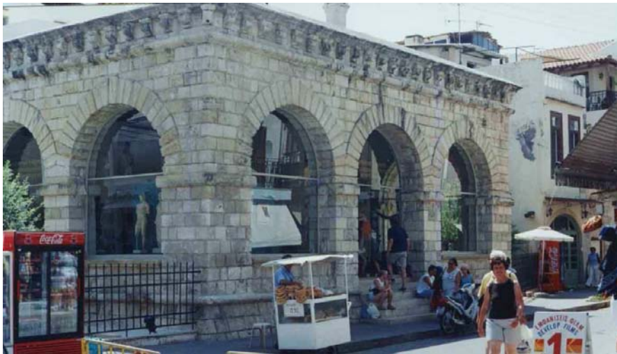
Βορειανατολική όψη Loggia

Η Loggia του Ρεθύμνου οικοδομήθηκε στα μέσα του 16ου αιώνα και παρουσιάζει ομοιότητες με τα αντίστοιχα κτίρια της Βενετίας (Loggetta), της Φλωρεντίας (Loggia del Lanzi), της Κέρκυρας και του Χάνδακα (Loggia Nuovissima). Σήμερα διατηρείται σε άριστη κατάσταση.