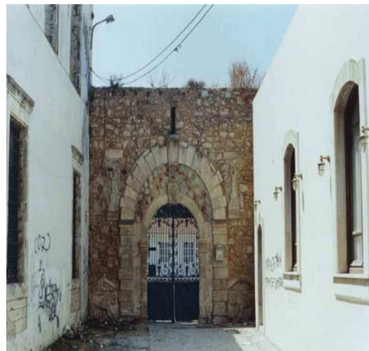
διπλανή είσοδος Τούρκικου σχολείου