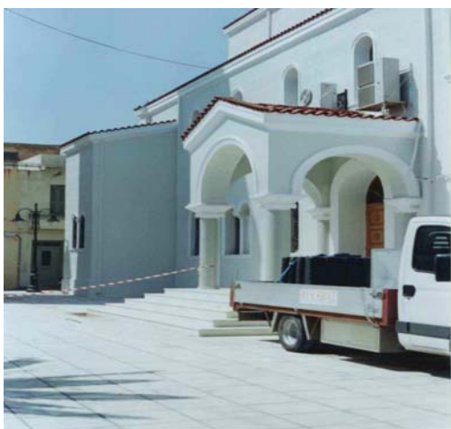
νότια όψη Μητρόπολης