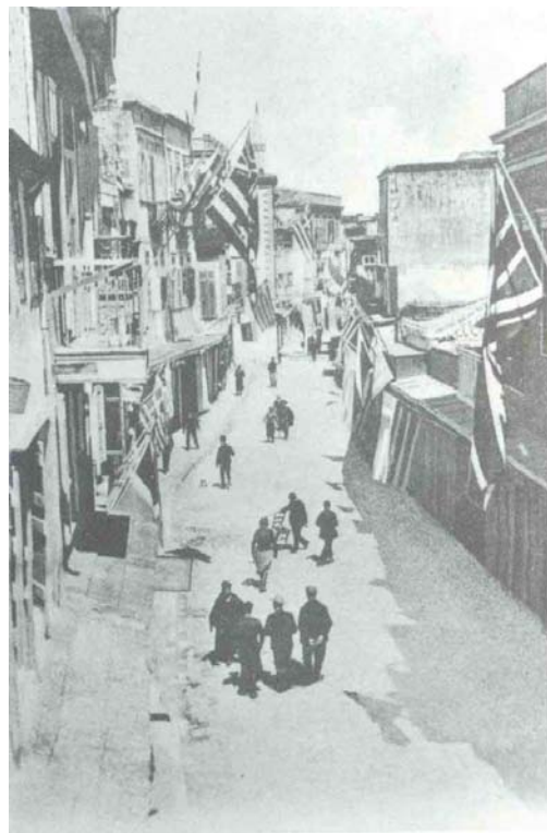
οδός Τσάρου (Αρκαδίου) 1900