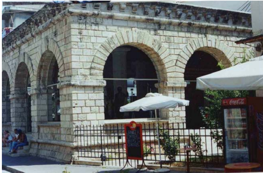
δυτική όψη Loggia

Το ωραίο αυτό τέμενος χτίστηκε για να προσεύχονται οι μουσουλμάνοι στις πέντε ιεροτελεστίες.