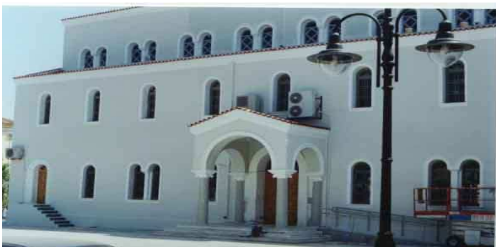
βόρεια όψη Μητρόπολης