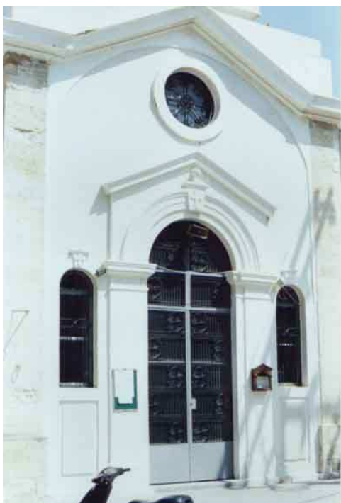
δυτική όψη εκκλησίας