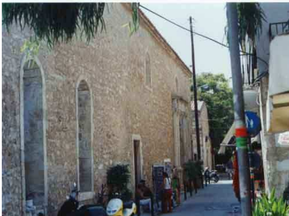
βόρεια όψη Ωδείου

Η εκκλησία Santa Maria και το μοναστήρι Αυγουστινιανών μοναχών, του οποίου αποτελούσε καθολικό, βρίσκονταν στη μεγάλη βενετσιάνικη πλατεία του Ρεθύμνου,. Σήμερα διασώζεται μόνη η εκκλησία με προσθήκες που έγιναν από τους Τούρκους για τη μετατροπή στο τζαμί Νερατζές.Βρίσκεται επί της οδού Βερνάρδου.