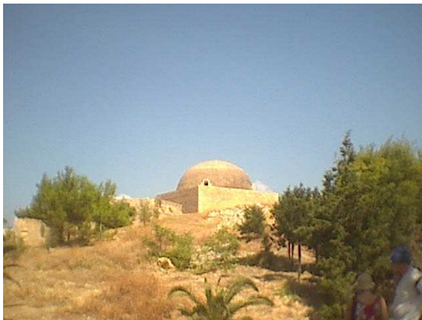
Τζαμί Ιμπραΐμ Χαν

Στα χρόνια της Τουρκοκρατίας ο ναός μετατράπηκε σε τζαμί, αφιερωμένο στον Ιμπραΐμ Χαν που την εποχή που κυριεύτηκε το Ρέθυμνο ήταν Σουλτάνος της Οθωμανικής αυτοκρατορίας.