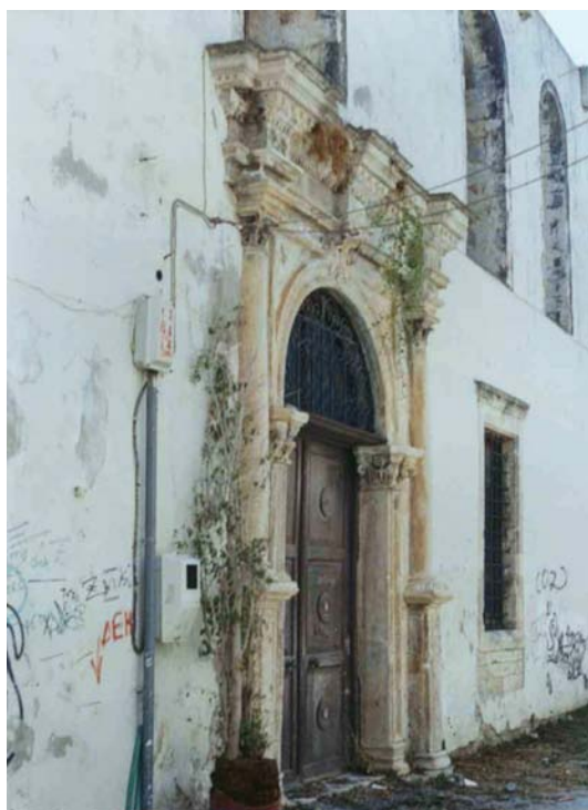
βόρεια όψη – θύρωμα

Εντυπωσιάζει με την υπερβολική του διακόσμηση. Διαθέτει το μοναδικό στο Ρέθυμνο παράδειγμα κιονόκρανων σύνθετου ρυθμού. Όμως συνολικά το θύρωμα ανήκει στον κορινθιακό ρυθμό.