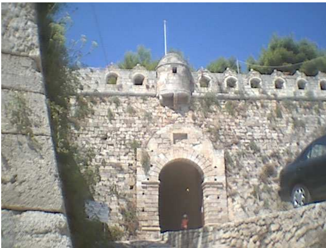
Η Κεντρική Πύλη της Φορτέτσας