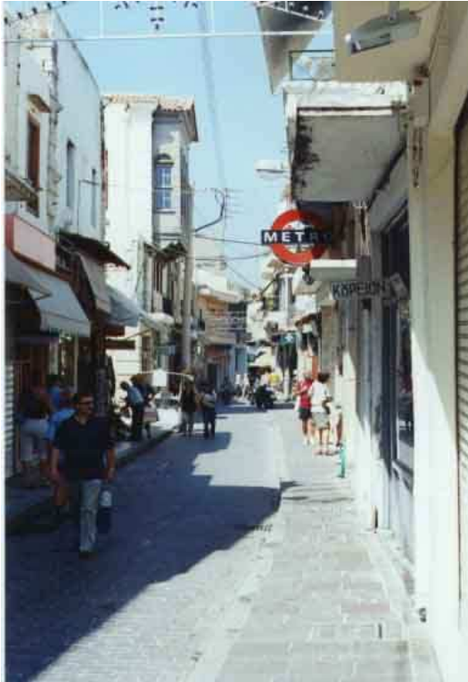
σημ. οδός Αρκαδίου

Σε ολόκληρη την πολιτεία έπαιζαν πρωτεύοντα ρόλο τρεις, μεγάλου μήκους, δρόμοι: η Μεγάλη Ρούγα (σημ. οδός Εθνικής Αντιστάσεως), το Μακρύ Στενό (σημ. οδός Νικηφόρου Φωκά) και ο τότε παραλιακός δρόμος της Άμμου (σημ. οδός Αρκαδίου).