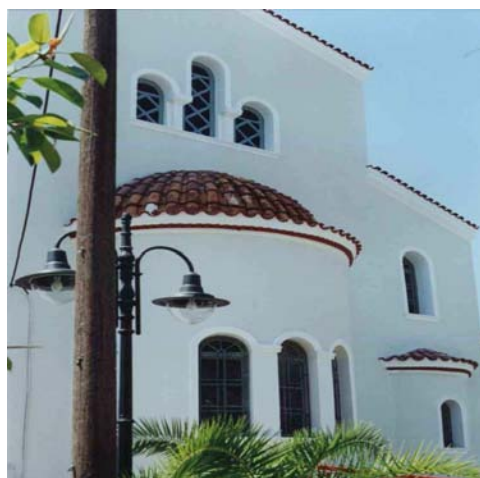
ανατολική όψη Μητρόπολης