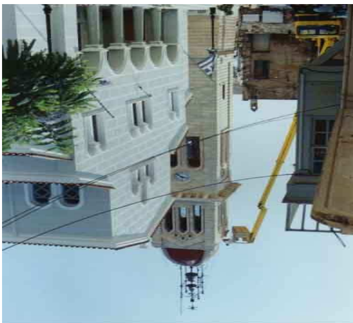
δυτική όψη Μητρόπολης