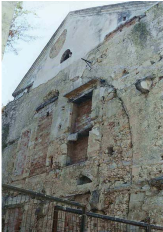
ανατολική όψη Α. Φ.

Η εκκλησία του Αγίου Φραγκίσκου είναι ένα από τα πιο σημαντικά μνημεία του Ρεθύμνου. Βρίσκεται επί των οδών Χ.Τρικούπη και Ε.Αντιστάσεως. Τόσο το θύρωμα και η αρχιτεκτονική της αίθουσας όσο και οι λεπτομέρειες των ανάγλυφων του παρεκκλησίου και οι άριστες αναλογίες του φανερώνουν πεπειραμένα οικοδομικά συνεργεία και ικανούς αρχιτέκτονες 1 .