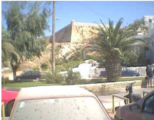
επιπρομαχώνας Αγ. Λουκά

Ο περίβολος του φρουρίου, όπως απεικονίζεται στα βενετσιάνικα σχέδια, αποτελούνταν από τέσσερις κύριους προμαχώνες (S. Salvatore ή Αγίου Νικολάου, Sta Maria ή Αγίου Παύλου, Αγίου Ηλία και Αγίου Λουκά) στη νότια και ανατολική πλευρά και έκλεινε στη δυτική και βόρεια με τρεις κύριες προεξοχές (Αγίου Πνεύματος, Αγίας Ιουστίνης και Αγίου Σώζοντος) που ενώνονταν με απλά μεσοπύργια 1 . Η κύρια πύλη της Φορτέτσας βρισκόταν στην ανατολική πλευρά, ενώ στη δυτική και στη βόρεια πλευρά του φρουρίου βρισκόταν από μια δευτερεύουσα βοηθητική πύλη. Στις επιχωματώσεις του νότιου και του ανατολικού περιβόλου υπήρχαν πρόσθετα αμυντικά έργα.