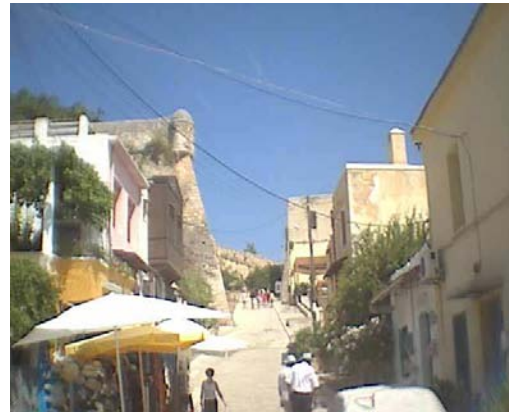
προμαχώνας Αγ. Παύλου

Ενδιαφέρον παρουσιάζει η διάρθρωση του εσωτερικού χώρου της Φορτέτσας. Στις πλευρές -νότια και ανατολική- που ήταν πιο ευάλωτες σε ενδεχόμενη επιδρομή δεν υπήρχαν κτίρια, δημόσια ή ιδιωτικά. Μετά τις επιχωματώσεις του νότιου περιβόλου, αφήνοντας μια απόσταση ασφαλείας από αυτές, τοποθετήθηκαν τα καταλύματα των στρατιωτών, οι χώροι φύλαξης κανονιών και η κατοικία του στρατιωτικού διοικητή.