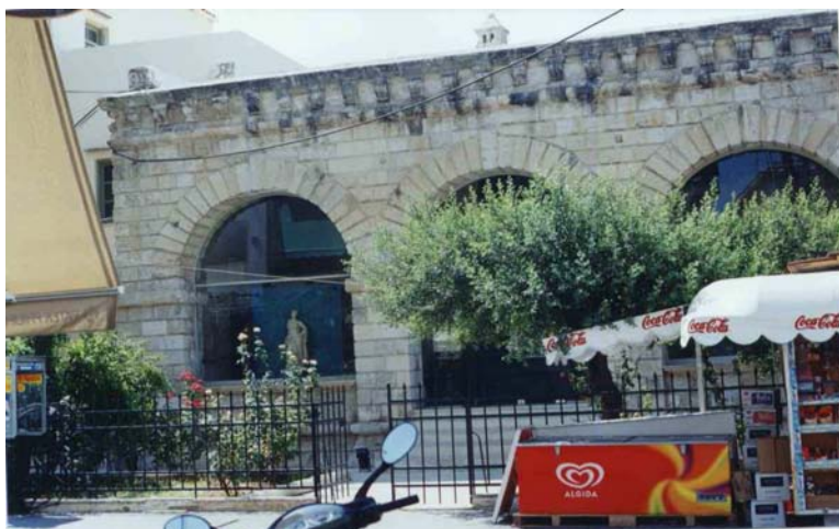
ανατολική όψη Loggia

Αρχικά στεγάζονταν με ξύλινη στέγη που, ανάμεσα στα 1625-1628, αφαιρέθηκε και το κτίριο στεγάστηκε με δώμα. Αμέσως μετά την τουρκική κατάκτηση μετατράπηκε σε τζαμί, αφιερωμένο από τον Κιουτσούκ Χατζή Ιμπραήμ Αγά (Κιουτσούκ σημαίνει μικρός και μπήκε προς αποφυγή σύγχυσης με τον Σουλτάνο Ιμπραήμ) 1 .