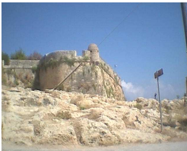
προμαχώνας Αγ. Νικολάου

Ο ενιαίος εσωτερικός χώρος χωρίζεται σε 2 τμήματα που στεγάζονται με ημικυλινδρικές καμάρες. Στο σημείο που αυτές συναντιούνται στηρίζονται πάνω σε 2 τόξα. Μια, κατεστραμμένη σήμερα, πέτρινη σκάλα ανέβαζε στην είσοδο, στο μέσο της ανατολικής πλευράς. Μια άλλη είσοδος υπάρχει στη νότια πλευρά. Το κτίριο διαθέτει 4 ορθογωνικά παράθυρα και 2 φεγγίτες. Νότια και ανατολικά το περιβάλλει περίβολος. 1