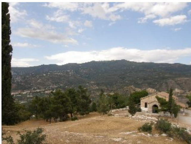
Ο Ιερός ναός της Ζωοδόχου Πηγής