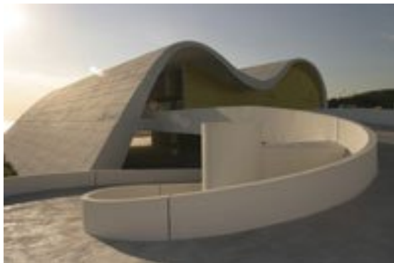
Το «Λαϊκό Θέατρο», ένα από τα πιο δύσκολα και ποιητικά έργα, που σχεδίασε πριν από μερικά χρόνια στο Ρίο ντε Τζανέιρο ο Οσκαρ Νιμάγερ

Το στοιχείο που κυριαρχεί είναι η ακατάπαυστη οριζοντιότητα που δηλώνεται μέσα από μια διαδικασία επανάληψης ενός βασικού μοτίβου που εντάσσεται στη λογική της πλάκας – φέτας . Το μοτίβο αυτό ακολουθείται σχεδόν παντού στη σύνθεση προσδίνοντας παράλληλα ένας έντονα αεροδυναμικό χαρακτήρα. Ξεκινάει από τους δρόμους προσέγγισης, συνεχίζει στα βασικά συνθετικά επίπεδα και καταλήγει στο κτίριο πρόσοψη. Μια παραλλαγή του βασικού αυτού μοτίβου θέλει τις πλάκες σκυροδέματος να στηρίζονται σε κυλινδρικές κολώνες μικρής διατομής σε σχέση με τις πλάκες που φέρουν και πάντα απομακρυσμένες από τα περίγραμμά τους. Παρόμοια στοιχεία συναντούμε και στην αρχιτεκτονική του Oscar Niemeyer ο οποίος «υπήρξε πρωτοπόρος στην εξερεύνηση των δυνατοτήτων του μπετόν. Αν και υπερασπιστής της λειτουργικής διάστασης της αρχιτεκτονικής, τα κτίριά του δεν χαρακτηρίζονται από ψυχρότητα. Αποκάλυψε ευφάνταστα κτίρια με δυναμικές φόρμες και σχεδόν αισθησιακές καμπύλες, γεγονός που οδήγησε τους θαυμαστές να χαρακτηρίσουν την αρχιτεκτονική του μνημειακή γλυπτική και ορισμένους επικριτές του να μειδιούν»( Γιώργος Καρουζάκης την ιστοσελίδα ).