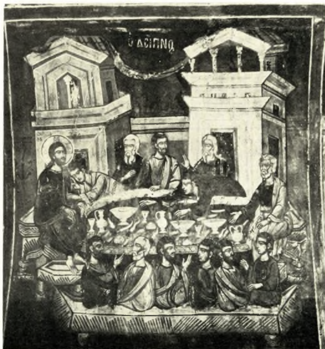
Ἀττική. Μονή Πετράκη: α - β. Ὁ Δείπνος, πρὸ καὶ μετὰ τὸν καθαρισμὸν