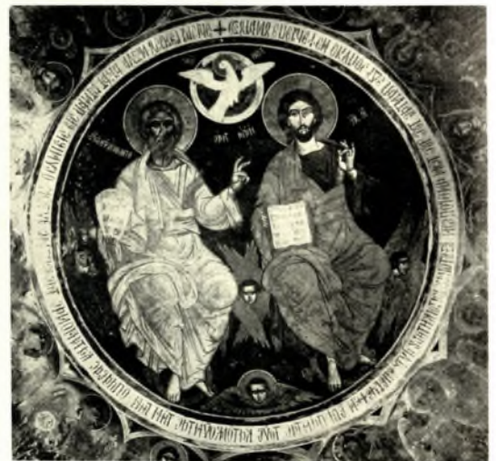
Ἄττική: α. Μονὴ Πετράκη. Ἐκ τῆς Οὐρανοῦ Λειτουργίας, μετὰ τὸν καθαρισμόν, β. Μονὴ Πετράκη. Ὁ Ἰούδας, μετὰ τὸν καθαρισμόν, γ. Μονὴ Καισαριανῆς (Νάρθηξ). Ἡ Ἁγ. Τριάς, μετὰ τὸν καθαρισμόν