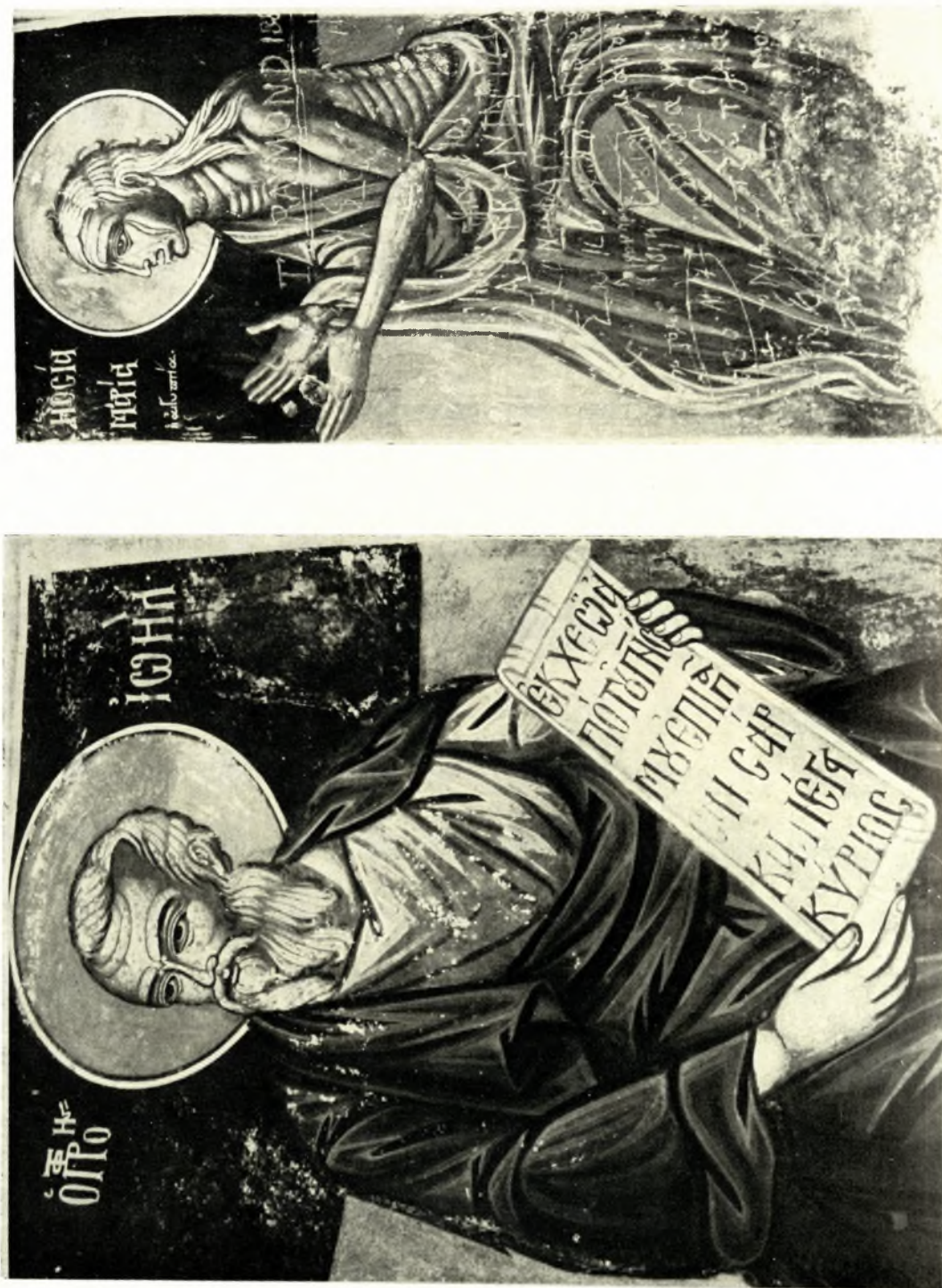
Ἄττικὴ. Μονὴ Καισαριανῆς ( Νιόβη ): α. Ὁ Προφήτης Ἰωήλ, β. Ἡ Ὁσία Μαρία ἢ Αἰγυπτία. Χοράγμιστα.