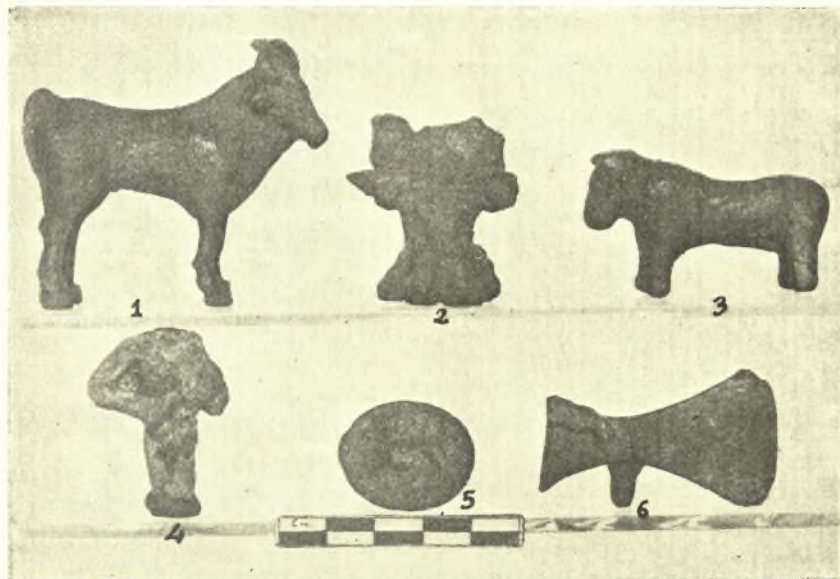
Εἰκ. 1. Χαλκᾶ εὐρήματα ἐξ Ἀμνισοῦ.

Τὰ ἐφετινὰ ἀποτελέσματα εἶναι ἐν συνόψει τὰ ἐπόμενα: Ἀνεκαλύφθη ἐν νέον τμήμα τοῦ ἱεροῦ πρὸς Νότον τοῦ ἤδη ἀνασκαφέντος πέρυσιν. Ἐνταῦθα αἱ παρατηρήσεις ἡμῶν ἦσαν σαφέστεραι καὶ μεγαλυτέρας ἐπιστημονικῆς σπουδαιότητος, διότι τὰ στρώματα ἐν τῷ τμήματι τούτῳ φαίνονται