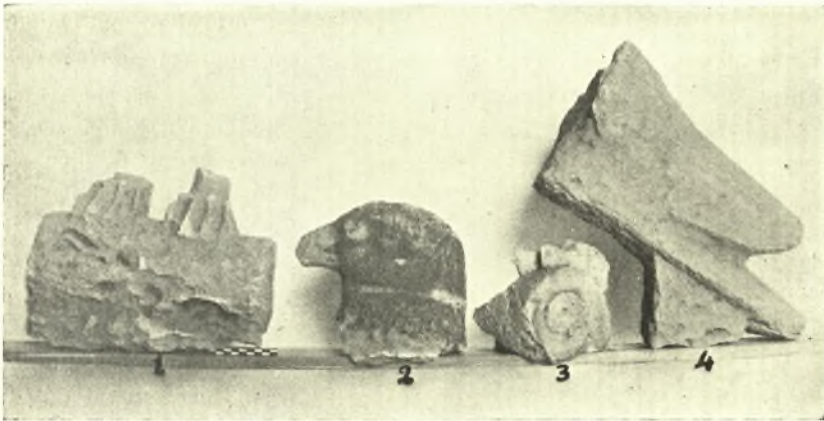
Εἰκ. 3. Πῶρινα γλυπτὰ ἐξ Ἀμνισοῦ.

Τὰ ἐξ αἰγυπτιακῆς φαγεντιανῆς εὐρήματα εἶναι πρωτίστως δύο μικρὰ καθήμενα μορφαὶ κολοβαί, ὧν τὰ βάρη φέρουσιν αἰγυπτιακὰ κοσμήματα (εἰκ. 2, 6 καὶ 8). Τεμάχια μᾶλλον ἢ ἦττον κολοβὰ ἵσταμένων μορφῶν (εἰκ. 2, 1-2). Κεφαλαὶ θεοτήτων (εἰκ. 2, 4-5). Τὸ ἄνω ἡμισυ λεοντοκεφάλου μορφῆς, πιθανῶς τῆς μεμφιτικῆς θεότητος Σεχμέτ (πρβλ. A. Ermann, Die ägypt. Religion 16) καὶ διάφορα ἄλλα τεμάχια καὶ ἐξαρτήματα. Εὐρέθη τέλος μικρότατον λεπτόν δισκάριον χρυσοῦν, πλῆθος ψήφων ἐκ διαφόρων ὕλικῶν, ἐπιπεδόκυρτον φακοειδὲς ἐξάρτημα ὀρείας χρυστάλλου καὶ ἕτερα μικροευρήματα.