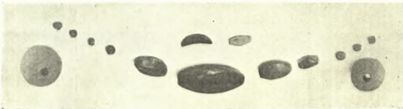
Εἰκ. 3. Χάνδραι ἐξ ἀχάτου.

Ἡ ἀνασκαφή αὕτη ἔφερεν εἰς φῶς ἴσως νέον τρόπον ταφῆς, ὃν ἡ μέλλουσα ἔρευνα μέλλει νὰ πιστοποιήσῃ σαφῶς.