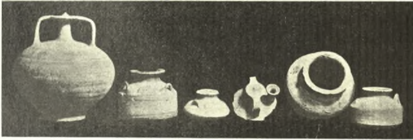
Εἰκ. 2. Ἄγγεϊα Ὑστερομυκηναϊκά.

Ἐξαιρετικὴν σημασίαν ἔλαβεν ἡ ἀνασκαφή εἰς τὸ χωρίον τοῦ τέως δήμου Πατρέων Τσαπλατέικα καὶ Παυλόκαστρον εἰς τοὺς ΝΑ γηλόφους