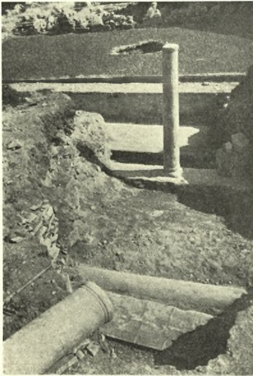
Εἰκ. 4. Τὰ ἀνευρεθέντα δεξιὰ τῆς βασιλικῆς Γ' παλαιότερα κτίσματα

τμήματα αὐτοῦ δύνανται νὰ διακριθῶσι (εἰκ. 3). Τὸ ψηφιδωτὸν τοῦτο — ἐκ τῶν καλυτέρων μωσαϊκῶν δαπέδων τῶν ἀνευρεθέντων ἐν Νέῃ Ἀγχιάλῳ καὶ περὶ τοῦ ὁποίου ὠμίλησα ἤδη εἰς τὴν περυσινὴν μου ἔκθεσιν ἐπ' εὐκαιρίᾳ