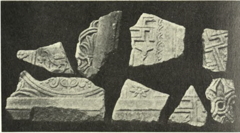
Εἰκ. 9. Τμήματα θωρακίων τῆς βασιλικῆς Δ ἀνευρεθέντα κατὰ τὰς ἀνασκαφάς.

1) Στήλη ἐγγωρίου ὑποφαίου λίθου (0,50 × 0,40, πάχ. 0,07, ὕψ. γραμμ. 0,04 μ.). (βλ. εἰκ. 10).