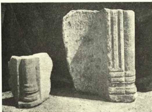
Εἰκ. 7. Ἄνευρεθέντα τμήματα μαρμαρίνων κογχῶν με ἠνωμένους κιονίσκους (ἐκ τῶν κοσμούντων τὰ κάτω μέρη τοῦ ἄμβωνος τῆς ἀνασκαπτομένης βασιλικῆς Δ).

δὲν διαφέρει κατὰ τὸ σχῆμα καὶ τὴν διάταξιν τῶν λοιπῶν τρικλίτων βασιλικῶν τῆς Ν. Ἀγγιᾶλου, ἀνέσκαψα ἐφέτος τὸ ἱερὸν βῆμα καὶ τμήμα τοῦ δεξιοῦ αὐτῆς κλίτους· ἀτυχῶς ἢ ἄψις τοῦ ναοῦ καὶ τὸ σύνθρονον ἀνευρέθησαν