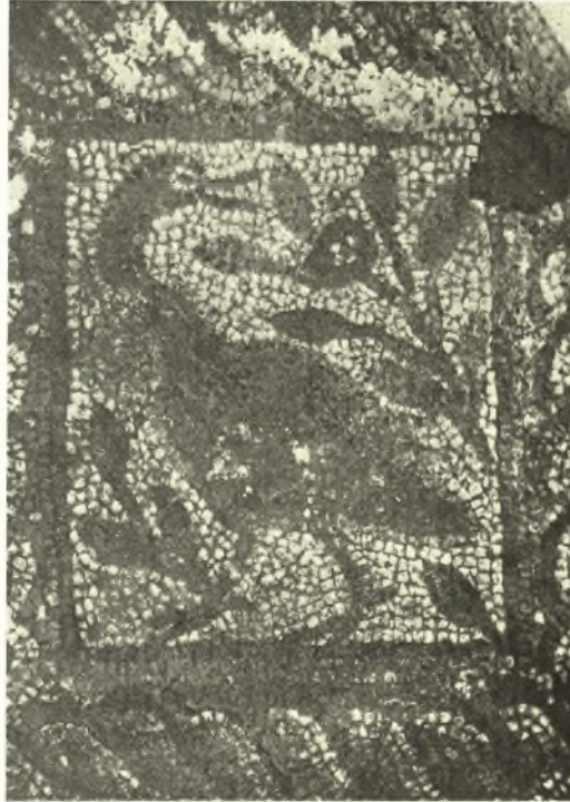
Εἰκ. 3. Τμῆμα τοῦ διασφυζομένου ψηφιδωτοῦ δαπέδου τοῦ αἵθριου τῆς βασιλικῆς Γ.

1. Εἰς τὴν βασιλικὴν Γ ἐγένετο συνέχσις τῆς ἐκκαθαρίσεως τοῦ αἵθριου τοῦ ναοῦ εἰς ἔκτασιν 6.65 μ. Ἀνεφάνη μετὰ τὴν ἐκκαθάρισιν τῶν ὄγκων τῶν χωμάτων (βάθους 3 μέτρων εἰς τὰ μέρη μάλιστα ὅπου ἦτο ἡ κατεδαφισθεῖσα οἰκία Εὐλογημένου) ἡ ἀρχὴ τῆς δεξιᾶς κιονοστοιχίας τοῦ αἵθριου καὶ μέγα μέρος τοῦ ψηφιδωτοῦ δαπέδου τῆς δεξιᾶς στοᾶς, ὡς καὶ τμῆμα τοῦ ὑπαίθρου χώρου τοῦ ἀντιστοιχοῦντος εἰς τὸ μεσαῖον κλίτος τοῦ ναοῦ, ἐπεστρωμένον διὰ μαρμάρων, μικρὰ μόνον τμήματα τῶν ὁποίων διασφύζονται. Ἡ ἐφετινὴ ἐρευνα ἀπέδειξεν ὅτι τὸ αἶθριον τοῦτο ἐχρησιμοποιήθη εἰς χρόνους ἴσως καταστροφῆς τοῦ μνημείου πιθανώτατα διὰ οἰκήσεις ἀνευρέθη ἡ κιονοστοιχία ἐντοιχισμένη — τὰς βάσεις τῶν κίωνων καλύπτουν μεταγενέστεροι τοῖχοι ἐπικεκολλημένοι ἐπὶ τῶν ἀρχικῶν παραστάδων τῆς δυτικῆς πλευρᾶς — ἀνεφάνησαν δὲ εἰς τὸ ἐκκαθαρισθὲν τμῆμα τῆς κιονοστοιχίας καὶ ἐπὶ τοῦ νοτίου τοῖχου τοῦ αἵθριου ἕτεραι μεταγενέστεραι παραστάδες, ἐφ' ὧν ἔβαινε πιθανώτατα τόξον (βλ. εἰκ. 2). Τὸ οἶκημα δὲ τοῦτο φαίνεται ὅτι κατεστράφη εἰς χρόνους ἐρημώσεως τῆς πόλεως ἐκ πυρκαϊᾶς, ἡ ξυλεία δὲ αὐτοῦ καυθεῖσα ἐπὶ τοῦ μωσαϊκοῦ δαπέδου τὸ ἀπηνθράκωσε καὶ οὕτω σήμερον ἐλάχιστα