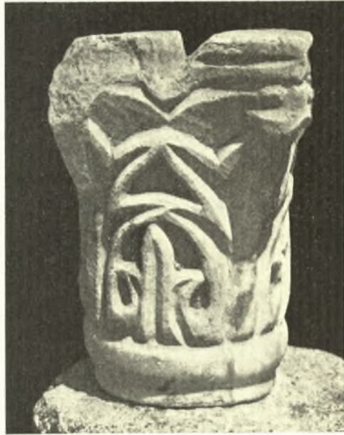
Εἰκ. 8. Ἀνευρεθὲν μικρὸν κιονόκρανον ἄνηκον εἰς τοὺς στηριζόντας τὸν οὐρανὸν τοῦ ἄμβωνος κιονίσκους.

Ἡ σημασία τοῦ ἀνασκαπτομένου μνημείου εἶναι μεγάλη, καθόσον ἐκ τῆς ἀνασκαφῆς ἀπεδείχθη, ὅτι πρόκειται περὶ τῆς ἐκκλησίας τοῦ κοιμητηρίου τῆς ἀρχαίας πόλεως, ἢ προσεχῆς δὲ ἀνασκαφὴ τοῦ χώρου τούτου ἐλπίζω ν' ἀποδώσῃ εἰς ἡμᾶς καὶ ἐπιγραφὰς διαφωτιστικὰς τῆς σημασίας τῆς μεγάλης ταύτης χριστιανικῆς πόλεως τῆς Θεσσαλίας. Ἐκ τῆς βασιλικῆς ταύτης προέρχονται καὶ αἱ κατωτέρω παρατιθέμεναι ἐπιγραφαὶ περισυλλεγεῖσαι ὑπὸ τοῦ φύλακος ἐκ τῶν πέριξ τῆς ἀνασκαπτομένης ἐκκλησίας οἰκίσκων.