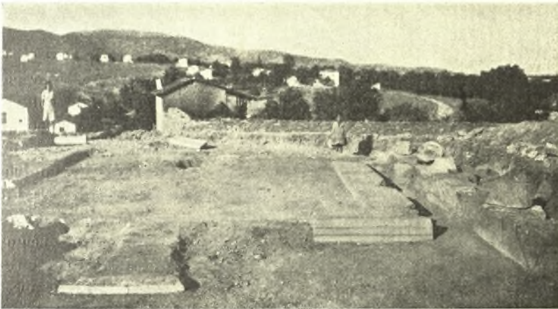
Εἰκ. 5. Τὰ ἀνασκαφέντα τμήματα τῆς βασιλικῆς Δ.

Ἡ ἔρευνα τοῦ διαθέσιμου χώρου ἔχει περατωθῆ πλεόν εἰς τὰ κύρια αὐτοῦ σημεῖα, εἶναι δὲ ἀπόλυτος ἀνάγκη πρὸς συνέχισιν τῆς ἀνασκαφῆς τοῦ ἀξιολογωτάτου τούτου μνημείου τῶν θεσσαλικῶν Θηβῶν νὰ γίνῃ ὅσον τὸ δυνατόν ταχύτερον ἢ ἀπαλλοτριώσις τῶν δύο οἰκοπέδων Βοϊνόγλου καὶ Ζώτου.