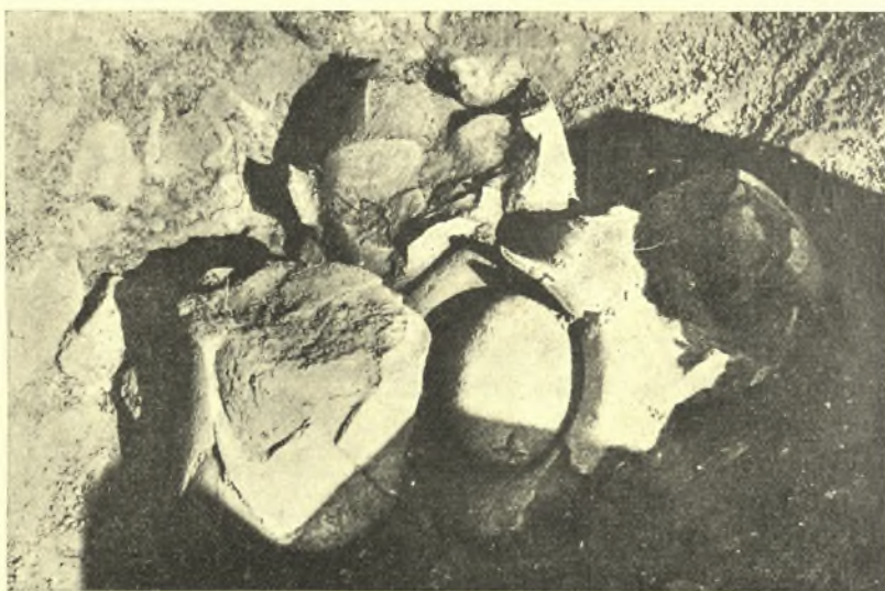
Εἰκ. 6. Ὅμὰς ἀγγείων μαγειρικῆς χρήσεως ἐντὸς τοῦ χώρου 2.

χιστον ἀγγεῖα. Μόνον ἓν τεμάχιον μεσομινωικοῦ εὐρέος κυάθου εἶναι ἄξιον ἰδιαίτερας μνείας, εὐρεθὲν ἐντὸς τοῦ διαδρόμου 5. Τὰ ἄλλα εἶναι ὅλως ἀσήμαντα ἀγγεῖα, (εἰκ. 5) πλὴν ἔτι μιᾶς πρόχον ἥτις ἀγνωστον ἀκόμη κατὰ πόσον θὰ εἶναι δυνατὸν νὰ ἀνασυγκροτηθῇ. Μία ὁμὰς ἀγγείων μαγειρικῆς χρήσεως (εἰκ. 6) εὐρέθη ἐντὸς τοῦ 2 καὶ παρὰ τὴν ΝΑ γωνίαν τοῦ 3, τὰ δὲ πέριξ μελανίζοντα χρώματα δεικνύουν ὅτι ἐδῶ ἦτο τὸ μαγειρεῖον. Ἐπίσης μοναδικὴν ἐξαιρέσιν παρουσιάζει τὸ παρὸν μέγαρον ὡς πρὸς τὴν ἀπουσίαν μεγάλων πίθων ἀποθηκεύσεως, οἵτινες μέχρι τοῦδε οὐδέποτε ἔλειψαν ἀπὸ τὰ ἀνάκτορα, τὰ