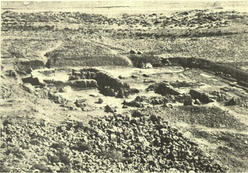
Εἰκ. 2. Ἀποψὶς τῆς ἀνεσκαμμένης ἐπαύλεως.

μέτρον δεξιώτερον ἢ ἀριστερώτερον δὲν ἤθελε προέλθει τι ἀξιόλογον εἰς φῶς καὶ ἠθέλομεν ἐγκαταλείψει τὸ μέρος. Εὐτυχῶς ἐπέσαμεν ἀκριβῶς ἐπὶ τοῦ πυρῆνος τῶν τοιχογραφιῶν, αἵτινες ἐπρόκειτο νὰ προσδώσουν εἰς τὴν ἀνασκαφὴν ἀσυνήθη σπουδαιότητα. Ἦδη μετὰ μίαν ὥραν ἀπὸ τῆς ἐνάρξεως τῆς ἐργασίας προσεῖλκυσε τὴν προσοχήν μου τὸ ἐξαγόμενον καφεόχρουν καθαρὸν χῶμα τῶν διαλελυμένων πλίνθων. Δὲν εἶχεν ἔτι παρῆλθει ἡ δευτέρα ὥρα, καὶ προσεκρούσαμεν ἐπὶ σωροῦ ἀκανονίστου μεγάλων λίθων, τοὺς ὁποίους οἱ