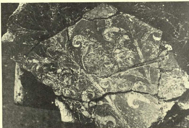
Εἰκ. 8. Μέρος τῆς τοιχογραφίας τῶν ἐμπιέστων κρίνων.

Τὰ εὐρεθέντα τεμάχια θὰ καταστῇ ἴσως δυνατόν νὰ ἀποδώσωσιν ὁλόκληρον τὴν σύνθεσιν τοῦ τοιχογραφημένου δωματίου, διότι ἐν συνόλῳ ἀποτελοῦσιν ἐπιφάνειαν πλειόνων τετραγωνικῶν μέτρων. Μόνον τὸ τεμάχιον τῶν