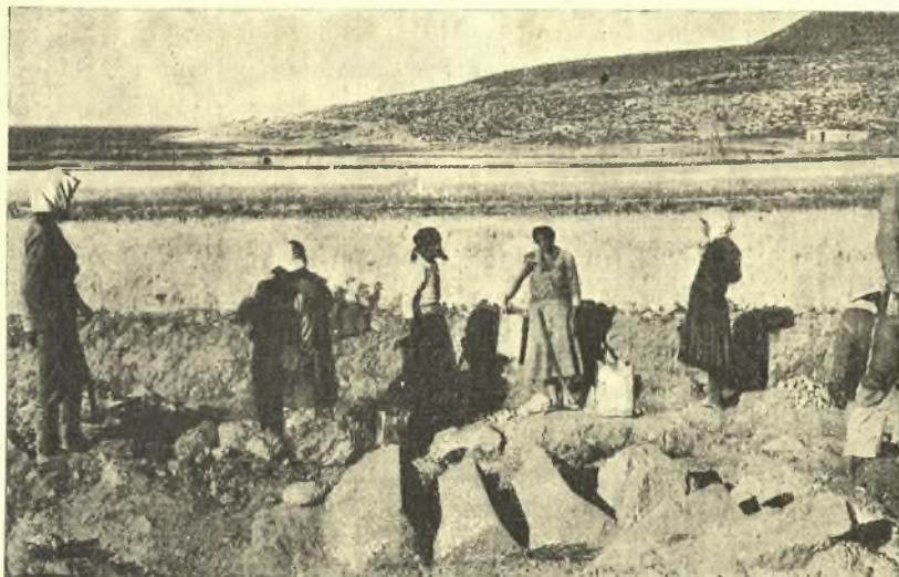
Εἰκ. 4. Ἡ καταπεσοῦσα κλίμαξ τοῦ ἄνω πατώματος κατὰ χώραν, ὡς εὗρέθη, ὁρωμένη ἐκ Δυσμῶν.

Τὸ ἀποκαλυφθὲν οἰκοδόμημα (εἰκ. 3) καταλαμβάνει τετράγωνον περί-