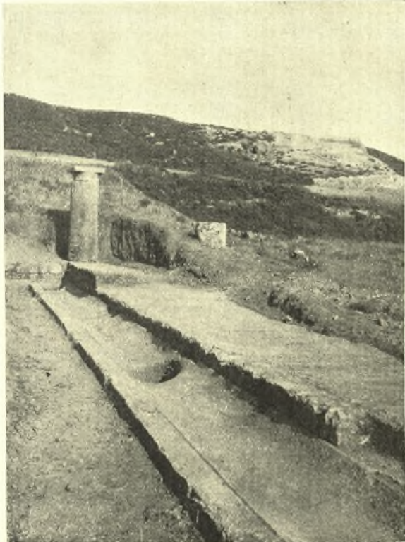
Εἰκ. 3. Τμήμα τοῦ βορείου στυλοβάτου τοῦ πειομόρφου κτηρίου μετὰ τῆς πρὸ αὐτοῦ αὐλάκος.

ὑπὸ τῶν ἐντοπίων ὀνομάζεται παλάτι. Τοῦ ἀνασκαφέντος κτηρίου ἀπεκαλύφθη πρὸς Β. ἱκανὸν τμήμα μακροῦ ἀναλήμματος διήκοντος ἀπ' Α. πρὸς Δ. κατεσκευασμένου δὲ διὰ μεγάλων κανονικῶν κυφωτῶν λίθων ( bombés ) ὕψους 0.48 καὶ πάρχους 0.84, ἰσοδόμως ἐκτισμένων. Τὰ μήκη τῶν λίθων τούτων ποικίλλουσιν ἀπὸ 0.86 ἕως 0.93. Οἱ κατὰ κόρυφοι ἄρμοί των σχηματίζουσι διέδρον γωνίαν, ἀνοίγματος 0.05, τέμνουσαν τὴν προσθίαν ἐπιφάνειαν τῶν λίθων κατ' ἐλαφρὰς καμπύλας γραμμάς. Τὸ ἀνάλημμα τοῦτο, ἀνασκαφὲν εἰς μῆκος 55 μ., ( εἰκ. 1 ) ἐχρησίμευε πρὸς ὑποστήριξιν μακροῦ ὀρθογωνίου ἀνδῆρου (70 μ. \times 35 μ.) ἐκτεινομένου πρὸς νότον μέχρι τοῦ βράχου τῆς κλιτύος τῆς ἀκροπόλεως, ὅστις διεμορφώθη διὰ κατατομῆς εἰς σχῆμα ὀρθῆς γωνίας (ᾧρα κάτωσιν εἰκ. 2 ). Ἐπὶ τοῦ ἀνδῆρου αὐτοῦ ἡ σκαφή ἀπεκάλυψε μέγα κτήριο σχήματος πεῖ, διαστάσεων ἑσωτερικῶν, ἀπὸ ἀκμῆς εἰς ἀκμὴν τοῦ στυλοβάτου, 13 \times 58 μ., φέρον δὲ πρὸς τὸ μὲν ἑσωτερικὸν κιονοστοιχίας, ἑξωτερικῶς δὲ τοῖχον, ἐφ' οὗ ἐστηρίζετο ἡ στέγη τῆς πειομόρφου στοᾶς. Πρὸ τοῦ παλίνου στυλοβάτου τῆς κιονοστοιχίας (πλάτους 0.90 - 1.10) εὗρέθη συνεχῆς, εὐρεῖα 0.63 καὶ βάθει 0.65 αὐλάξ, ἐσκαμμένη ἐντὸς πώρου λίθου ἐπικεχρισμένου διὰ σκληροτάτου ὑδραυλικοῦ κονιάματος καὶ φέρουσα κατ' ἀποστάσεις ἑλλειψοειδεῖς κοιλότητας, χάριν καθιζήσεως τῶν ἐν τῷ ὕδατι στερεῶν οὐσιῶν ( εἰκ. 3 ). Ἡ μεγάλη διάμετρος τῶν ἑλλειψοειδῶν λεκανῶν εἶναι 0.73 ἢ δὲ μικρὰ 0.50, τὸ δὲ βάθος αὐτῶν 0.41. Καὶ ἐπὶ μὲν τῆς δυτικῆς πλευρᾶς εὗρέθησαν τέσσαρες