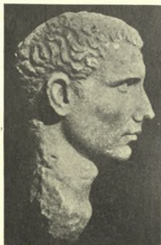
Εἰκ. 11β. Ἡ παραπλευρὸς κεφαλὴ ὁρωμένη κατὰ κρόταφον

μένον πρὸς τὸ ἄπειρον καὶ προέχουσιν τὴν κάτω σιαγόνα. Τὰ ὦτα εἶναι μεγάλα καὶ ἀδρᾶς εἰργασμένα ἢ δὲ βραχεῖα κόμη καταλήγει ἐπὶ τοῦ μετώπου εἰς μικροὺς βοστρίχους. Τὰ οὐχὶ λίαν κανονικὰ χαρακτηριστικὰ τῆς κεφαλῆς αὐτῆς, ἣτις ἔχει μὲν ἥθικὴν τινα πνοὴν ἀλλ' οὐχὶ καὶ ἀνωτέραν πνευματικὴν ἔκφρασιν, μαρτυροῦσιν ὅτι πρόκειται περὶ τινος ἀστοῦ διακριθέντος πιθανῶς εἰς τινα δημοσίαν ὑπηρεσίαν ἢ εὐεργετήσαντος τὴν Σικυνῶνα, ἐφ' ᾧ καὶ ἐτιμήθη δι' εἰκονικοῦ ἀνδριάντος.