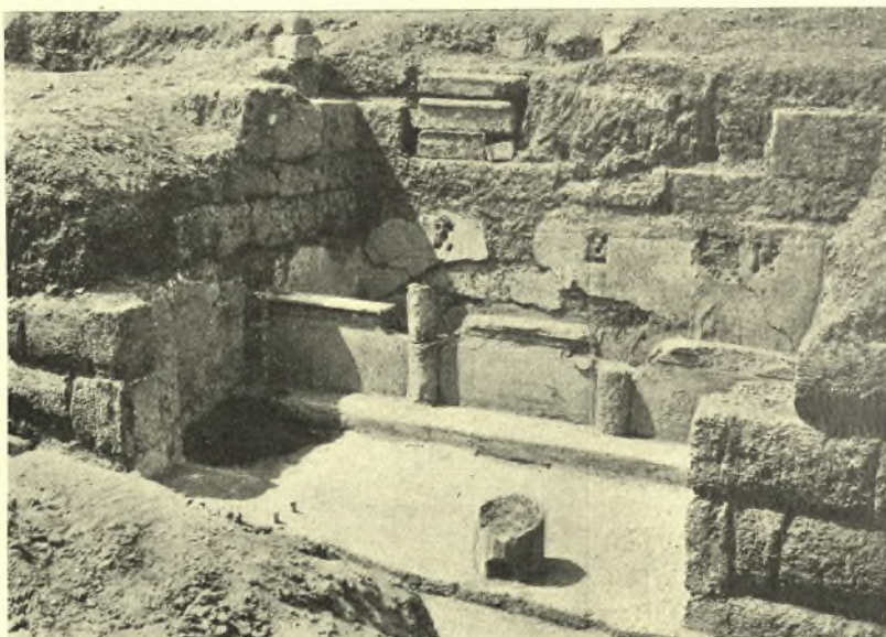
Εἰκ. 6. Ἀποψις τῆς κρήνης ἀπ' ἀνατολῶν.

Κατὰ δὲ τὸ βόρειον ἄκρον τοῦ ἀναλήμματος ἀπεκαλύφθη ἀφ' ἐνὸς μὲν στενωτέρου κλιμαξ ἀνάγουσα καὶ αὐτὴ εἰς τὸ ἄνδρον (ᾧρα εἰκ. 2 καὶ 7) ἀφ' ἑτέρου δὲ τὰ ἐδάφη κατασκευῆς προπύλου τῆς συνήθους δικιονίου μορφῆς, οὕτινος ἡ πρὸς βορρᾶν πρόσοψις ἐφράχθη ἀργότερον συνεχισθέντος πρὸς ἀνατολὰς τοῦ βορείου ἀναλήμματος τοῦ ἀνδῆρου (εἰκ. 2). Τοῦ δὲ προπύλου