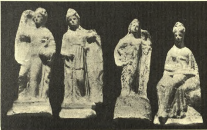
Εἰκ. 15. Πήλινα εἰδώλια ἐκ τάφου παιδίου.

Ἀνοιχθέντος, πρὸς πρόληψιν τυμβωρυχείας, τάφου μικροῦ παιδίου ὠρυγμένου μετ' ἄλλων μεγαλυτέρων σεσυλημένων ἐντὸς τοῦ μαλακοῦ πετρώματος