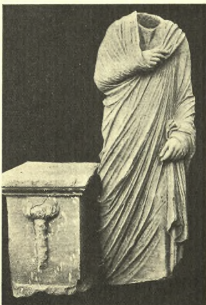
Εἰκ. 10. 'Ανδριὰς ἀκέφαλος ρωμαϊκῶν χρόνων.

προβάλλοντες τὸν ἀριστερὸν πόδα καὶ φέροντες τὴν δεξιὰν πρὸ τοῦ στήθους ἀναδιπλωμένην ἐντὸς τοῦ ἐνδύματος, κατ' ὃν χρόνον ἢ ἀριστερά, κατακορύφως σχεδὸν πρὸς τὸν μηρὸν καταπίπτουσα, συγκρατεῖ, ἐλαφρῶς καμπτομένη, τὴν ἄκραν τῆς toga.