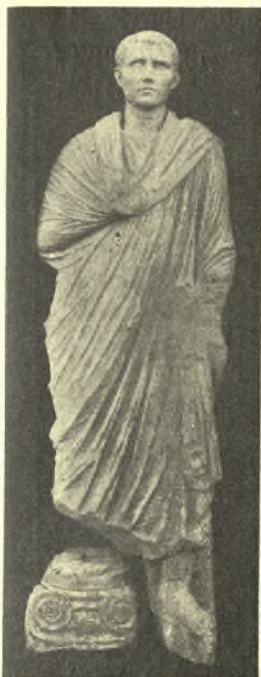
Εἰκ. 9. 'Ανδριὰς μετ' ἐνθέτου κεφαλῆς, ρωμαϊκῶν χρόνων.

2ον) Κατὰ τὴν ἀποκάλυψιν τοῦ ἀνατολικοῦ ἀναλήμματος εὐρέθησαν δύο ἀκέφαλοι, μετρίας τέχνης φυσικοῦ δὲ μεγέθους μαρμάρيني ἀνδρικοὶ κορμοί, ὁ μὲν (εἰκ. 9) ἐπὶ τοῦ πλατυσκάλου τῆς μεγάλης κλίμακος ὁ δὲ (εἰκ. 10) παρὰ τὸν πόδα τοῦ ἀναλήμματος. Περιβεβλημένοι ἀμφοτέρω τὴν συνήθη ρωμαϊκὴν togam μὲ τὴν τόσον ὕστεροῦσαν εἰς ἔκφρασιν πτυχολογίαν, ἐμφανίζονται εἰς τὴν τυπικὴν κατ' ἐνώπιον στάσιν