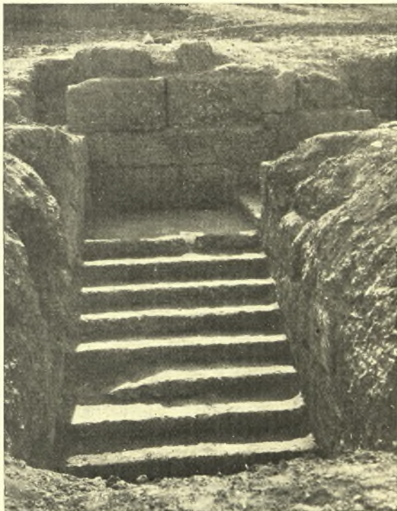
Εἰκ. 5. Ἐπικαμπὴς κλίμαξ ἀνόδου εἰς τὸ ἄνδρον.