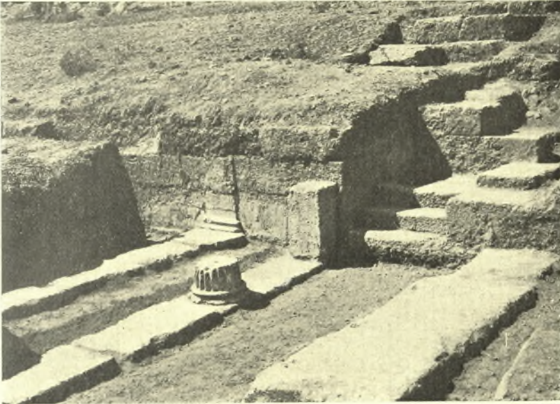
Εἰκ. 7. Τὸ δυτικὸν τμῆμα τοῦ προπύλου μετὰ τῆς ἐσωτερικῆς στοᾶς καὶ τῆς μικρᾶς κλίμακος.

Ὡς πρὸς τοὺς χρόνους κατασκευῆς τοῦ ἀναλήματος παρατηροῦμεν ὅτι