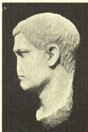
Εἰκ. 12β. Ἡ παραπλευρὸς κεφαλὴ ὁρῶμένη κατὰ κρόταφον.

πρὸς ἑκείνα· διὰ τοῦτο προτιμῶ νὰ θεωρήσω καὶ τὴν δευτέραν κεφαλὴν ὡς εἰκονίζουσαν ἄγνωστόν τινα Ρωμαῖον ἢ καὶ Σικυώνιον.