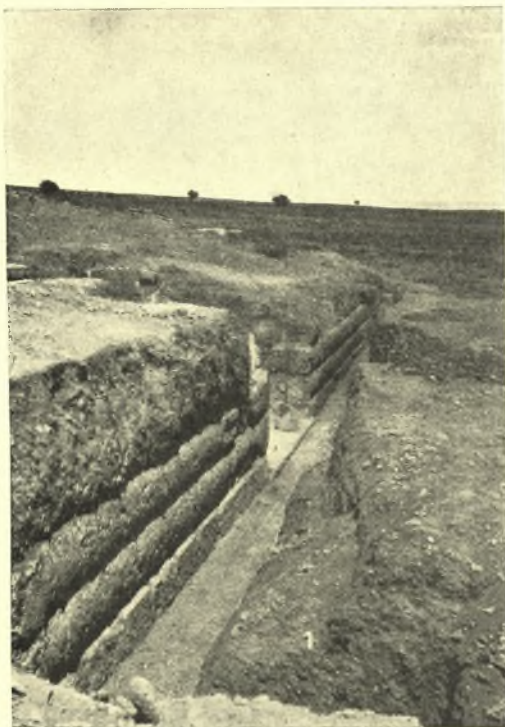
Εἰκ. 4. Ἀποψὶς τοῦ ἀνατολικοῦ ἀναλήματος.

ἔλλειψοειδεῖς λεκάναι καὶ δύο ἄκραι καρδιόσχημοι, ἐπὶ δὲ τῆς βορείου μία μόνον ἔλλειψοειδῆς λεκάνη. Ἡ νοτία πλευρὰ τοῦ κτηρίου δὲν ἀνεσκάφη εἰσέτι. Ἡ ὑπαρξὶς τῆς αὐλακος ἀποδεικνύει, ὅτι ὁ πρὸ τῶν κιονοστοιχιῶν χῶρος ἦτο ὑπαιθρος. Ποῖος ὅμως ἦτο ὁ προορισμὸς τοῦ ἀποκαλυφθέντος