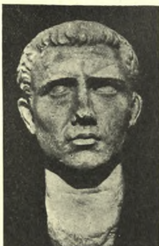
Εἰκ. 11α. Κεφαλὴ ρωμαϊκῶν χρόνων.

Ἡ πρώτη κεφαλὴ, (εἰκ. 11) ἐργασίας μᾶλλον ἀδρᾶς, εἰκονίζει μὲ ἰσχυρὸν ρεαλισμὸν ἄνδρα, ἔχοντα τοὺς ὀφθαλμοὺς βεβαθυσμένους, τὸ βλέμμα ἐστραμ-