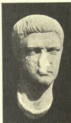
Εἰκ. 12α. Κεφαλὴ ρωμαϊκῶν χρόνων.

ἀμυγδαλωτοὺς ὀφθαλμούς, τὸ εὐρὺ ἀρρυντίδωτον μέτωπον καὶ τὰ λεπτὰ εὐθέα χεῖλη ἀποπνέει εὐγένειαν καὶ ἡρεμίαν ἐνθυμίζουσα ἀρχαῖα ἑλληνικὰ πρότυπα, πρὸς τὰ ὅποια ἄλλως τε τὴν πλησιάζει καὶ ἡ ἀρίστη τεχνικὴ τῆς ἐκτέλεσις. Ἀμφότεραι αἱ κεφαλαί, λόγῳ τοῦ εἵδους τῆς κομώσεως, τῆς διαμορφώσεως τῶν ὀφθαλμῶν καὶ τοῦ καθόλου πνεύματος, ὅπερ τὰς διέπει, ἀνήκουσιν εἰς τοὺς χρόνους τῶν Κλαυδίων ἥτοι εἰς τὰ μέσα τοῦ 1 ου μ. Χ. αἰῶνος. Τὰ χαρακτηριστικὰ τῆς δευτέρας κεφαλῆς παρουσιάζουσιν ὁμοιότητά τινα πρὸς τὰ τοῦ Ἀγρίππα 1 καὶ τοῦ υἱοῦ τοῦ Γαΐου Καίσαρος 2 ἀλλὰ δὲν συμπίπτουν ἀκριβῶς