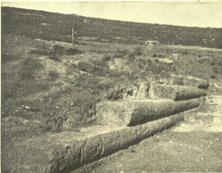
Εἰκ. 1. Ἀποψὶς τοῦ βορείου ἀναλήματος.

Συνεχίζων ἐντολῇ τοῦ Ὑπουργείου τῆς Παιδείας καὶ τῇ ἀρωγῇ τῆς Ἀρχαιολογικῆς Ἑταιρείας τὴν ἀνασκαφὴν τῆς δυσαναλόγως πρὸς τὴν σπουδαιότητα αὐτῆς ἐρευνηθείσης ἀρχαίας Σικυῶνος, ἐπελήφθην, κατὰ τὸν παρελ-