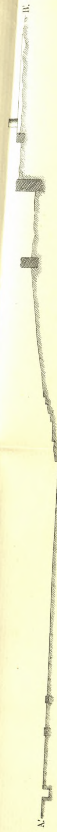
Τομή κατά τὸν ἄξονα Α'-Β'