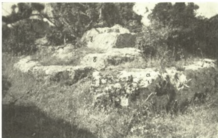
Εἰκ. 3. Βαθμίδες (α-β-γ.) βωμοῦ λελαξευμένου ἐπὶ τοῦ βράχου ἐπὶ τοῦ νοτίου λόφου τῆς Γαληψοῦ.

Ἡ κορυφὴ τοῦ βορείου λόφου κατὰ τὸν μεσαῖωνα περιεβάλλετο ὑπὸ ἑτέρου τείχους, θεμέλια τοῦ ὁποίου σφύζονται εἰς διάφορα αὐτοῦ σημεῖα. Ἐτι δὲ κατὰ τὸ δυτικὸν τοῦ λόφου ἄκρον διεσώθησαν θεμέλια μεσαιωνικοῦ κτίσματος, πύργου πιθανῶς. Πλὴν τῶν μεσαιωνικῶν τούτων κτισμάτων θεμέλια κτηρίων, προφανῶς ἀρχαίων, εἶναι κατεσπαρμένα ἐπὶ τῆς κορυφῆς ταύτης, μεταξὺ δ' αὐτῶν ἀνεύρομεν πολλὰ μελαμβραφῇ ὄστρακα.