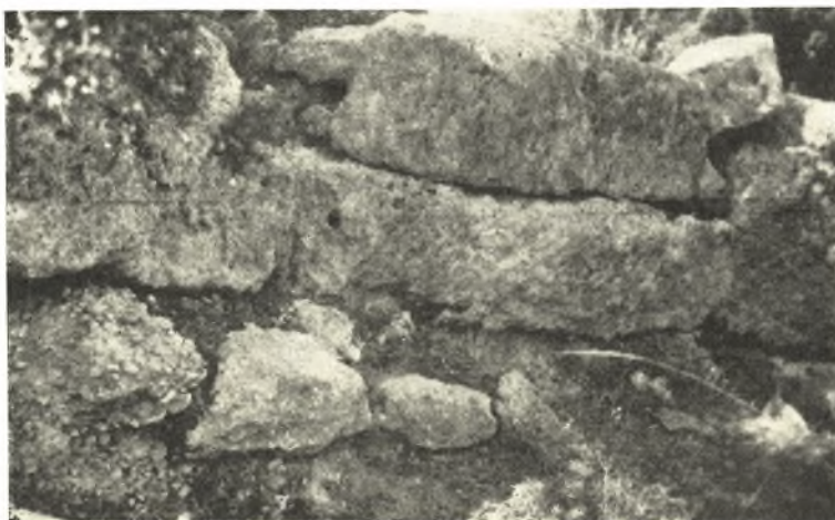
Εἰκ. 1. Τμήμα βορείου τοίχου τῆς Γαληψοῦ.

Ἡ θέσις τῆς πόλεως ἀνεγνωρίσθη ὑπὸ τοῦ Perdrizet, τοῦ Picard καὶ τοῦ Avezou 1 , τελευταίως δὲ τὰ λείψανα αὐτῆς περιεγράφησαν καὶ πῶς ἐκτενέστερον ὑπὸ τοῦ Collard καὶ τοῦ Devambez 2 . Κατὰ τὸν Ἰούλιον τοῦ 1938 καὶ κατὰ τὸ διάστημα τῆς σκαφῆς