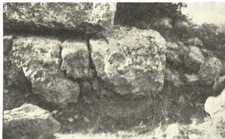
Εἰκ. 2. Τμήμα βορείου τείχους τῆς Γαληψοῦ. Λεπτομέρεια θεμελιώσεως.

τοῦ νεολιθικοῦ συνοικισμοῦ τοῦ Ἁγίου Γεωργίου παρὰ τὸ σημερινὸν χωριὸν τοῦ Ἀκροποτάμου 3 , μᾶς ἐδόθη ἡ εὐκαιρία νὰ ἐπισκεφθῶμεν ἐκ νέου τὴν θέσιν τῆς Γαληψοῦ καὶ νὰ ἐπιβεβαιώσωμεν τὰς παρατηρήσεις τῶν σοφῶν Γάλλων συναδέλφων. Ἡ Γαληψὸς κεῖται περὶ τὰ τέσσαρα χιλιόμετρα πρὸς ἀνατολὰς τοῦ σημερινοῦ χωριοῦ τῆς Καρυανῆς καὶ εἶναι γνωστὴ εἰς τὸν λαὸν μὲ τὸ ὄνομα «Γαῖδουρόκαστρον». Κατέχει δύο ὑψηλοὺς λόφους, ἐκ τῶν ὁποίων ὁ βορειότερος εἶναι ὁ ὑψηλότερος καὶ διὰ λαιμοῦ ἐνοῦται ἀπὸ βορρᾶ πρὸς τὰς λοιπὰς παραφυάδας τοῦ Συμβόλου. Ὁ βορειότερος οὗτος λόφος ἔχει τὸν ἄξονά του περίπου παράλληλον πρὸς τὴν γραμμὴν τῆς ἀκτῆς καὶ ἀπὸ ἀνατολῶν πρὸς δυσμὰς, παρουσιάζει μᾶλλον ὁμαλὰς