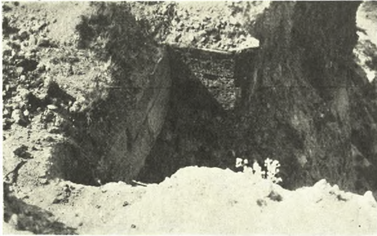
Εἰκ. 4. Ἀναλημματικὸν τεῖχος τοῦ νοτίου λόφου τῆς Γαληψοῦ.

ἢ παρόμοιον κτίσμα 1 . Οὐδὲν ἕτερον θεμέλιον ἢ λείψανον παρατηρήθη εἰς τὴν ἔκτασιν ταύτην, ἢ ὁποία ἴσως ἐχρησιμοποιεῖτο διὰ θρησκευτικὰς τελετὰς καὶ ὡς γέφυρα ἐνοῦσα τὸν βόρειον λόφον καὶ τὴν εἴσοδον τῆς πόλεως μετὰ τὴν χαμηλοτέραν