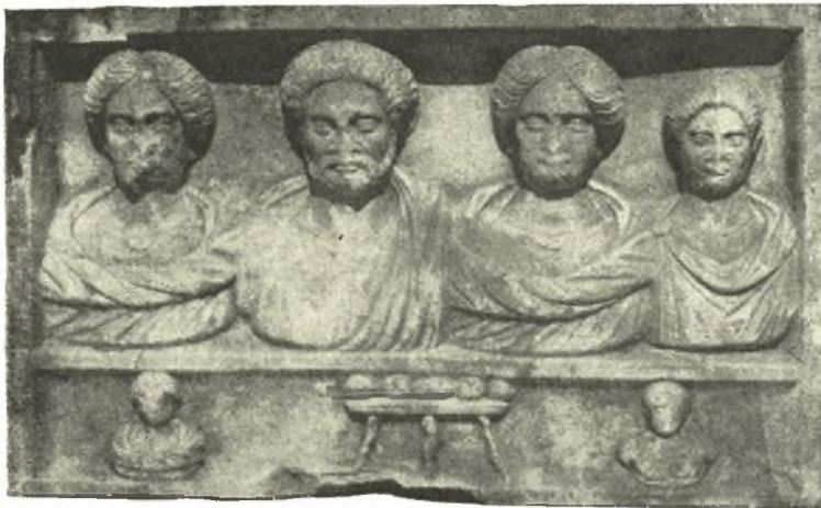
Εἰκ. 5. Ἐπιτύμβιον ἀνάγλυφον ἐκ Γαληψοῦ.

καὶ ἐπικίνδυνος. Ὡς ἐκ τούτου τὸ τμήμα τῆς πόλεως, φυσικῶς ὀχυρὸν, δὲν εἶχεν ἀνάγκην τείχους.