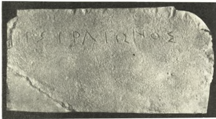
Εἰκ. 7. Ἐκτυπὸν ἐπιγραφῆς ἐκ Γαληψοῦ.

Εἰς τὸ ἀνατολικὸν ἄκρον τοῦ βορείου λόφου τῆς Γαληψοῦ ἀνεύρομεν καὶ θραῦσμα βάσεως, τὸ ὁποῖον εἶχε χρησιμοποιηθῆ ὡς οἰκοδομήσιμον ὑλικὸν ὑπὸ τῶν κτιστῶν