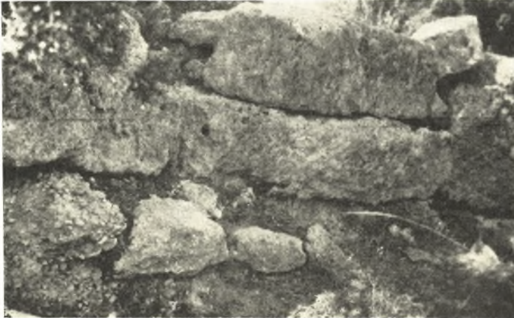
Εἰκ. 1. Τμήμα βορείου τοίχου τῆς Γαληψοῦ.

Ἡ θέσις τῆς πόλεως ἀνεγνωρίσθη ὑπὸ τοῦ Perdrizet, τοῦ Picard καὶ τοῦ Avezou 1 , τελευταίως δὲ τὰ λείψανα αὐτῆς περιεγράφησαν κάπως ἐκτενέστερον ὑπὸ τοῦ Collard καὶ τοῦ Devambe 2 . Κατὰ τὸν Ἰούλιον τοῦ 1938 καὶ κατὰ τὸ διάστημα τῆς σκαφῆς