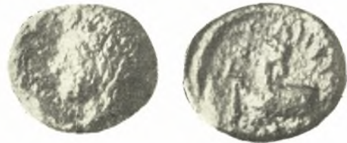
Εἰκ. 8. Χαλκοῦν νόμισμα ἐκ Γαληψοῦ. (ἐν μεγεθύνσει).

B. Προτομὴ τράγου-κεφαλὴ ἐστραμμένη πρὸς τὰ ὀπίσω. Ἐπιγραφή, ΓΑ-ΛΗΨΙΩ[Ν].