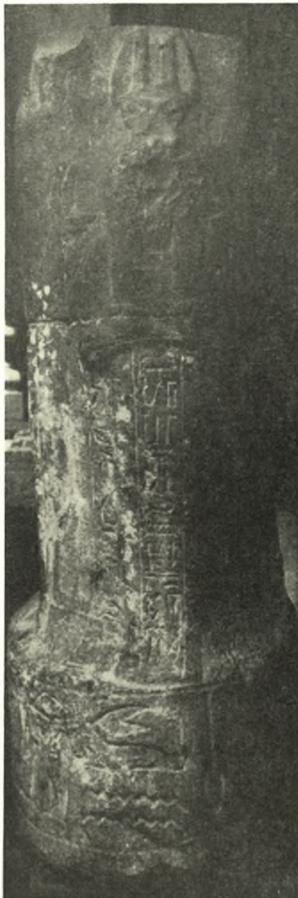
Fig. 4. Côte gauche du monument acéphale d'Unnefer du Musée du Caire, N° 35258.