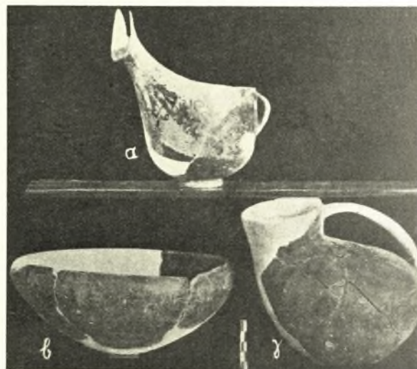
Εἰκ. 2. Χαρακτηριστικὰ πρωτοελλαδικὰ ἀγγεῖα ἐκ τοῦ Mylonas, Excavations at Hagios Kosmas, A.J.A. 1933 σ. 265 εἰκ. 8, εἰς ὁμοίαν τῶν ὁποίων ἀνήκονται τὰ ὄστρακα τῶν εἰκόνων 3 καὶ 4.

Τὰ λεπτότερα καὶ χαρακτηριστικώτερα ὄστρακα τοῦ συνοικισμοῦ καθὼς καὶ ὅλων τῶν πρωτοελλαδικῶν τοιούτων εἶναι τὰ ἐν τῇ εἰκόνι 3 εἰκονιζόμενα, ἀνήκοντα εἰς βαθείας φιάλας μετὰ πλαγίας ἐνιαίας μακροστένου προχοῆς, ἐπὶ δακτυλιοσχήμου βάσεως καὶ μετὰ μιᾶς καθέτου ἢ πλαγίας λαβῆς εἰς τὸ ἔναντι