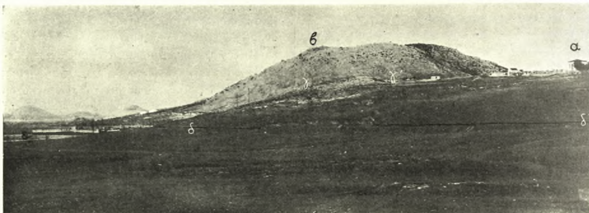
Εἰκ. 1. α' = Ναὸς Ἀγίου Γεωργίου Κερατινίου. β' = κορυφή Αἰγάλεω. γγ' = ὁ κῶνος. δδ' = ἡ τροχιδορομικὴ ὁδὸς Πειραιῶς - Περάματος. ε' = ἡ παραλία. Ὅρια ἐκτάσεως τοῦ συνοικισμοῦ εἶναι τὰ γράμματα δγγ'.

τοῦ λόφου, ὅπου ἐπίσης ὑπάρχει ἀρκετὸν πάχος ἐπιχώσεως φθάνον μέχρι 2 μ. καὶ φέρει ἀρκετὰ χαρακτηριστικῶν Πρωτοελλαδικῶν - Κυκλαδικῶν ἀγγείων ὄστρακα, ὀψιανούς καὶ διαφόρους λίθους λογάδας. Ἀκόμη ἡ ἐπίχωση αὕτη εἶναι μᾶλλον τεφρὰ καὶ περιέχει ὁστὰ ζώων κεκαυμένα.