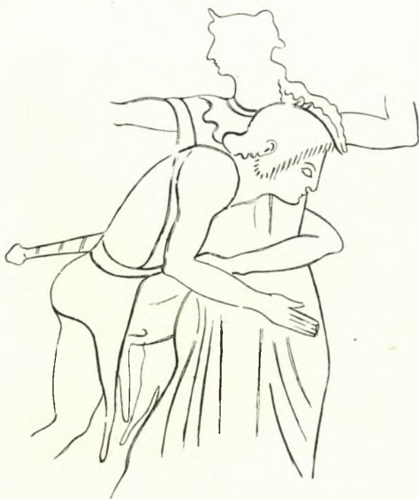
Εἰκ. 5. Πάλη Θετίδος καὶ Πηλέως. Ἐκ τῆς παραστάσεως τῆς ληκύθου.

ἐν Heydemann, Griech. Vasenb, σελ. 6 πίναξ VI εἰκ. 1). Τὸ θέμα τοῦτο εἶνε ἀγαπητότατον εἰς τοὺς ἀγγειογράφους, οἱ ὅποιοι συχνότατα τὸ ἀπεικονίζουσαν εἰς ληκύθους, πινάκια, ὑδρίας, ἐπίνητρα κ. λ. π. (Σ. Παπασπυρίδη, Ἐλευσινιακὰ ἀγγεῖα ἐν Α. Δ. 1924-25 9 σελ. 4-6. Gerhard, Auserl. III πίναξ 180. Roscher, Myth. V σελ. 795, F. R. πίναξ 24 (Δουῖρις), ὁμοίως πίναξ 155, Α. Ε. 1897 σελ. 130 πιν. 9. Collignon-Couve, Catalogue