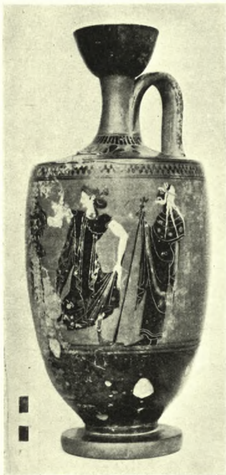
Εἰκ. 3. Ἐκ τῶν εὐρημάτων τοῦ 5ου τάφου.

Μικρὰ σκαφικὴ ἔρευνα ἐγένετο ἀκόμη κατὰ τὴν πρὸ τῆς νοτίας πλαγίᾳς τοῦ λόφου τῆς Καρίας ἔκτασιν, ἀκριβῶς ὀπισθεν τοῦ ἐργοστασίου Λάγγη καὶ εἰς τὴν ὁδὸν, ἣτις ἐκεῖθεν διέρχεται (δρόμος τοῦ Βλιχοῦ). Κατ' αὐτὴν ἀπεκαλύφθη