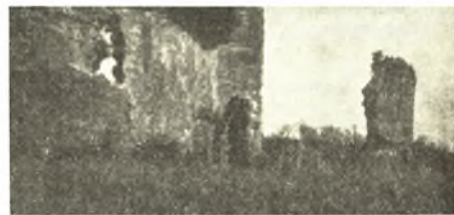
Εἰκ. 5. Τὸ βόρειον τμήμα τοῦ οἰκοδομήματος «Μπούφη». Δεξιὰ διακρίνεται πεσσὸς τοξοστοιχίας τοῦ ὕδραγωγοῦ.

Ὅτι τὸ πρᾶγμα οὕτως ἔχει, ἐνισχύεται καὶ ἐκ