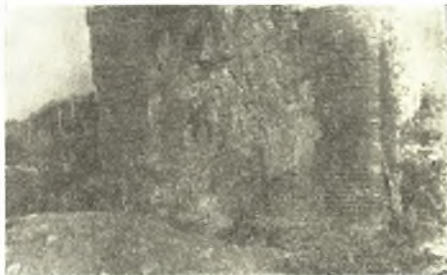
Εἰκ. 3. Ἡ ἀνατολικὴ πλευρὰ τοῦ κρηπίδωματος Α, καλυπτομένη ὑπὸ ἰζημάτων ἀσβεστίου.

Πρὸς ἐξακριβώσιν περὶ τίνος ἐπρόκειτο καὶ τί περιεῖχεν ὁ χώρος οὗτος ἐπέτρεψα τὴν ἐπὶ τοῦ κέντρου τῆς ὁροφῆς διάτρησιν τοῦ κρηπίδωματος τούτου διὰ σιδηρομοχλοῦ. Ὅμοιαν διάτρησιν, βάθους 1 μ. περίπου, καὶ ἄλλοτε εἶχεν ὑποστῆ ἢ ἄνω ἐπιφάνεια τούτου ὑπ' ἀγνώστων, προσδοκόντων θησαυρούς.