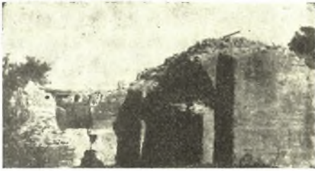
Εἰκ. 2. Ἡ νοτία πλευρὰ τοῦ δυτικοῦ τμήματος τῆς δεξαμενῆς.

Πρὸ τῆς νοτίας πλευρᾶς πλακόστρωσις ἐκ μεγάλων τετραγώνων λευκῶν πλακῶν ἐσχημάτιζεν εἶδος αἰλῆς ἢ πλατείας καὶ πιθανῶς θὰ κατελάμβανεν ὁλόκληρον τὸν πρὸς νότον τοῦ οἰκοδομήματος χώρον.