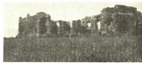
Εἰκ. 4. Ἡ πρόσοψις τοῦ οἰκοδομήματος «Μπούφη», ὀρωμένη ἐξ ἀνατολῶν.

Διότι κατ' ἐκείνην τὴν πλευρὰν καὶ ἐν μέρει κατὰ τὴν νοτίαν ὑπάρχουν παχέα στρώματα ἐξ ἀσβεστολιθικῶν ἰζημάτων (πουροί), τὰ ὅποια ἐσχηματίσθησαν διὰ τῆς συνεχοῦς ὄψης ὕδατος (εἰκ. 3). Τὰ ἰζήματα ταῦτα, καταλαμβάνοντα τὴν κεντρικὴν ἐπιφάνειαν τοῦ τοίχου ἀπὸ τῆς κορυφῆς του μέχρι τοῦ λιθίνου ποδίου, διακόπτονται ὑπὸ κανονικῆς αἰλακῆς, ὅπου ἐλλείπουν ἐντελῶς τὰ ἰζήματα. Προφανῶς διὰ τῆς αἰλακῆς ταύτης διήρχετο ὁ πῆλιμος σωλῆν, ὁ