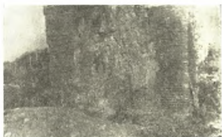
Εἰκ. 3. Ἡ ἀνατολικὴ πλευρὰ τοῦ κρηπιδώματος Α, καλυπτομένη ὑπὸ ἰζημάτων ἀσβεστίου.

Πρὸς ἐξακριβῶσιν περὶ τίνος ἐπρόκειτο καὶ τί περιεῖχεν ὁ χώρος οὗτος ἐπέτρεψα τὴν ἐπὶ τοῦ κέντρου τῆς ὀροφῆς διάτρησιν τοῦ κρηπιδώματος τούτου διὰ σιδηρομοχλοῦ. Ὁμοίαν διάτρησιν, βάθους 1 μ. περίπου, καὶ ἄλλοτε εἶχεν ὑποστῆ ἢ ἄνω ἐπιφάνεια τούτου ὑπ' ἀγνώστων, προσδοκῶντων θησαυρούς.