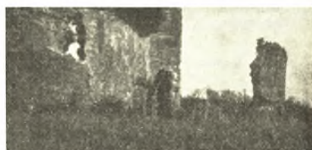
Εἰκ. 5. Τὸ βόρειον τμήμα τοῦ οἰκοδομήματος «Μπούφη». Δεξιὰ διακρίνεται πεσσὸς τοξοστοιχίας τοῦ ὕδραγωγοῦ.

Ὅτι τὸ πρᾶγμα οὕτως ἔχει, ἐνισχύεται καὶ ἐκ