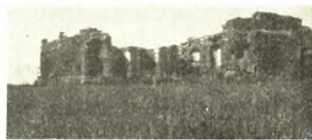
Εἰκ. 4. Ἡ πρόσοψις τοῦ οἰκοδομήματος «Μπούφη», ὀρωμένη ἐξ ἀνατολῶν.

Διότι κατ' ἐκείνην τὴν πλευρὰν καὶ ἐν μέρει κατὰ τὴν νοτιάν ὑπάρχουν παχέα στρώματα ἐξ ἀσβεστολιθικῶν ἰζημάτων (πουρί), τὰ ὁποῖα ἐσχηματίσθησαν διὰ τῆς συνεχοῦς ὄσης ὕδατος (εἰκ. 3). Τὰ ἰζήματα ταῦτα, καταλαμβάνοντα τὴν κεντρικὴν ἐπιφάνειαν τοῦ τοίχου ἀπὸ τῆς κορυφῆς του μέχρι τοῦ λιθίνου ποδίου, διακόπτονται ὑπὸ κανονικῆς αἰλακῆς, ὅπου ἐλλείπουν ἐντελῶς τὰ ἰζήματα. Προφανῶς διὰ τῆς αἰλακῆς ταύτης διήρχετο ὁ πῆλιμος σωλῆν, ὁ