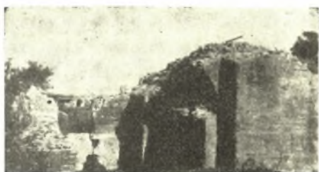
Εἰκ. 2. Ἡ νοτιὰ πλευρὰ τοῦ δυτικοῦ τμήματος τῆς δεξαμενῆς.

Πρὸ τῆς νοτίας πλευρᾶς πλακόστρωσις ἐκ μεγάλων τετραγώνων λευκῶν πλακῶν ἐσχημάτιζεν εἶδος αἰλῆς ἢ πλατείας καὶ πιθανῶς θὰ κατελάμβανεν ὁλόκληρον τὸν πρὸς νότον τοῦ οἰκοδομήματος χώρον.