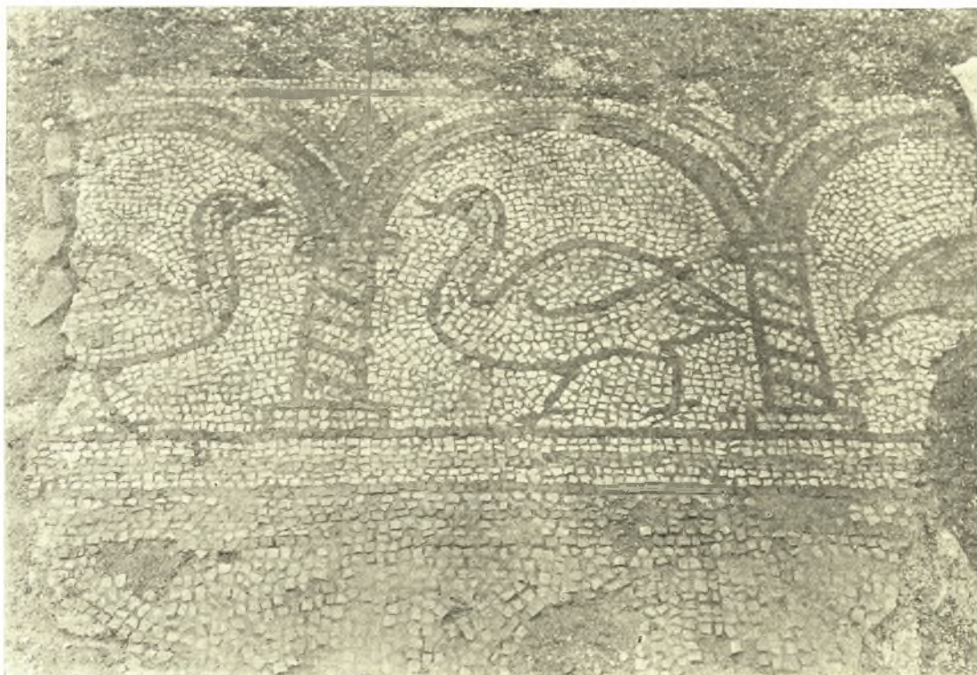
Εἰκ. 4. Τμῆμα ψηφιδωτοῦ δαπέδου ἐκ τῆς ΒΔ πλευρᾶς τοῦ νάρθηκος.