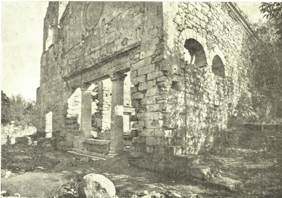
Εἰκ. 2. Τὸ τριβήλον τῆς βασιλικῆς μετὰ τοὺς βομβαρδισμοὺς καὶ τὰς ἐκχωματώσεις.

ρὰς τοῦ ὁποίου σχηματίζονται μικρὰ πλαίσια καὶ ἐντὸς αὐτῶν κατὰ τὰς τρεῖς πλευρὰς, παρίστανται ἰχθύες καὶ πτηνὰ (νῆσαι, ἀλέκτωρ, πέρδικες κ.λ.π.). Τὰ πλαίσια ταῦτα διακόπτονται ὑπὸ μεγάλου κύκλου σχηματιζομένου ἐκ πολυπλόκου πλέγματος, καταλήγοντος εἰς ἕτερον ἐν τῷ κέντρῳ κύκλον, ἐν ᾧ παρίσταται σχηματικῶς ταῶς μετ' ἠνεωγμένων πτερῶν. Δύο ἄλλα τετράγωνα