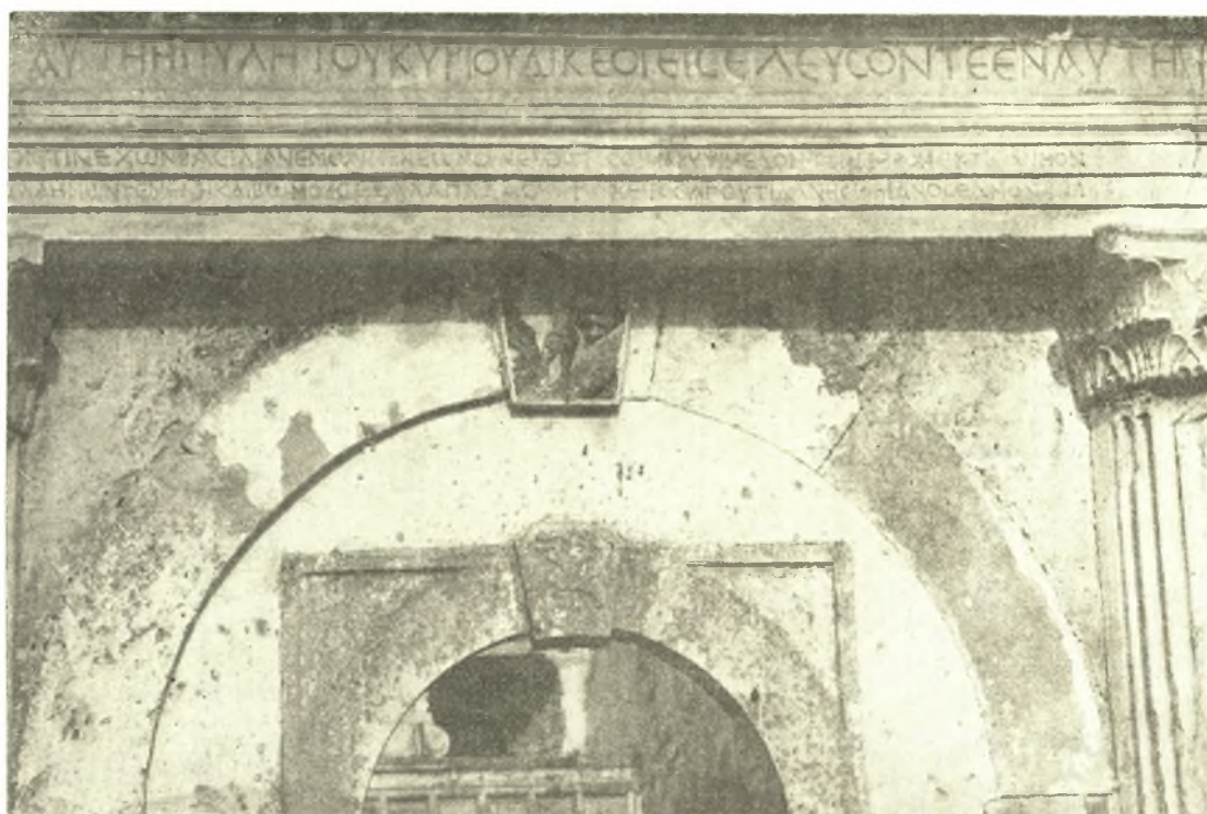
Εἰκ. 1. Τὸ ἐπιστύλιον τοῦ τριβήλου τῆς βασιλικῆς μετὰ τῆς ἐπιγραφῆς.

Καὶ ὁ μὲν παλαιότερος συγγραφεὺς τῆς Κερκυραϊκῆς ἱστορίας ὁ Μάρμορας (Della hist. d.