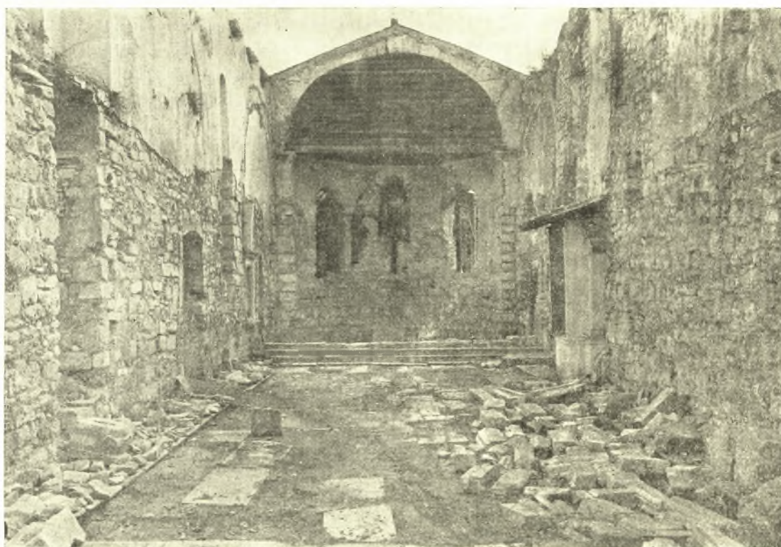
Εἰκ. 5. Τὸ ἐσωτερικὸν τοῦ ναοῦ μετὰ τῶν ἐν αὐτῷ συγκεντρωθέντων γλυπτῶν.