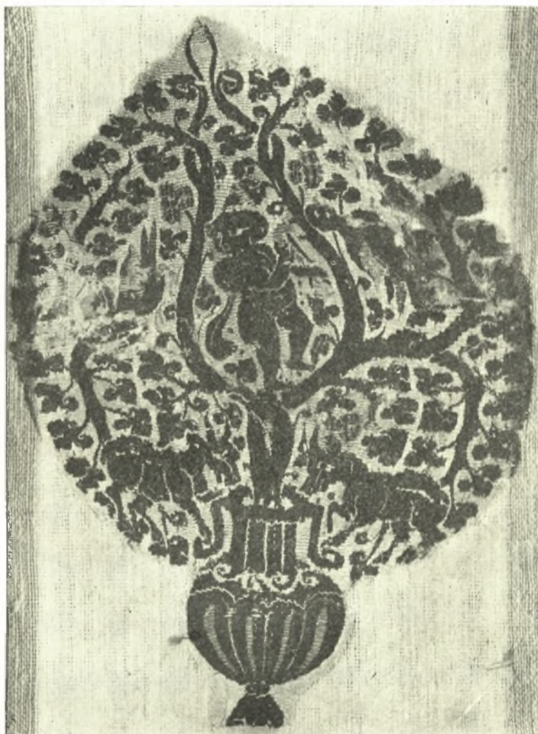
Εἰκ. 1. Ὁ Διόνυσος περιβαλλόμενος ὑπὸ κληματίδων ἐκφρασμένων ἐξ ἀμφορέως (Ἵφραντὸν Μουσείου Μπενάκη 4 ου 5 ου μ.Χ. αἰῶνος).

Τὸ σημεῖον ἔχει σχετικὴν συγγένειαν πρὸς τὸ ὑπ' ἀριθ. 1731 τοῦ Βυζαντινοῦ Μουσείου 1 , πλὴν μικρῶν τινῶν διαφορῶν κατὰ τὴν στάσιν τοῦ Διονύσου καὶ τῶν αἰγῶν Αἰ τοῦ ὑπὸ ἐξέτασιν σημείου αἰγες ὑστεροῦσι κατὰ τὴν φυσικὴν χάριν τῶν τοῦ Βυζαντινοῦ Μουσείου, εἰς τὰς ὁποίας ὁ καλλιτέχνης ἀπέδωκε μετὰ πολλῆς ἐπιτυχίας τὸν παλ-