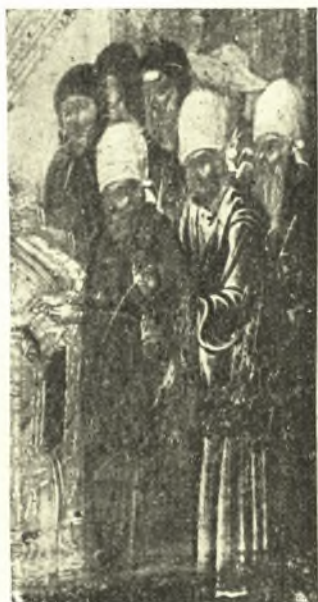
Εἰκ. 2. Μοναχοὶ καὶ ψάλται. Λεπτομέρεια τοῦ πίν. 1.

Μένει τώρα πρὸς ἐρμηνείαν ὁ εἰς τὸ ἀριστερὸν μέρος τῆς ἐξεταζομένης εἰκόνας ὁμιλος τῶν ἀνθρώπων, τῶν ἰσταμένων πρὸ τοῦ ἀναλογίου καὶ ἀντλούντων ἀπὸ τοὺς ἐξ αὐτοῦ ἐξερχομένους κρουνοὺς (εἰκ. 2). Τὸ μέρος τοῦτο τῆς εἰκόνας εἶναι, ὡς εὐκόλως δύ-