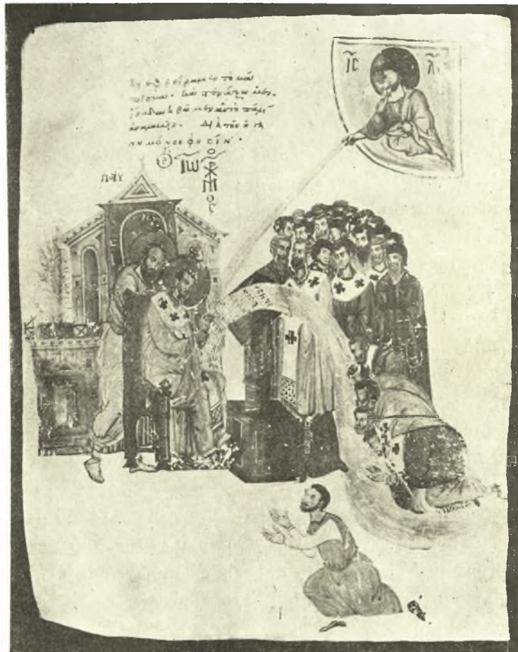
Εἰκ. 7. Μικρογραφία τοῦ κώδ. Α. 172 τῆς Ἀμβροσιανῆς Βιβλιοθήκης τοῦ Μιλάνου.

του στολήν και γράφων εις μακρὸν εἰλητάριον. Ἐπὶ τοῦ εἰληταρίου τούτου, τοῦ ὁποίου τὸ ἄνω ἄκρον εὐρίσκεται ἐπὶ ἀναλογίου ἰσταμένου πρὸ τοῦ Χρυσοστόμου, ἀναγινώσκειται ἡ ἀνορθόγραφος ἐπιγραφή: + ΣΥΝΕ|ΧΟΣ Α|ΚΟΥΟ|Ν| ΑΝΑ|ΓΙΝΟΣΚ|ΟΜΕΝΟΝ| ΤΟΝ|ΕΠΙ|ΣΤΟΛΟ|Ν ΤΟΥ ΜΑ|Κ|Α|ΡΙΟΥ. Εἶναι δὲ αὕτη ἡ ἀρχὴ τῆς ὑποθέσεως τῆς ἐρμηνείας τοῦ Χρυσοστόμου εἰς τὴν πρὸς Ῥωμαίους ἐπιστολήν τοῦ Παύλου (Migne, P. G. 60, 391). Ὅπισθεν τοῦ θρόνου τοῦ Χρυσοστόμου εἰκονίζεται ὁ Παῦλος εἰς τὴν γνωστὴν στάσιν. Ἀπὸ τοῦ ἄνω ἄκρου τοῦ εἰληταρίου τοῦ Χρυσοστόμου ἔξορμα ποτα-