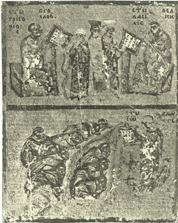
Εἰκ. 11. Μικρογραφία τοῦ Σερβικοῦ Ψαλτηρίου τῆς Βιβλιοθήκης τοῦ Μονάχου.

Ἡ μικρογραφία τοῦ Σερβικοῦ Ψαλτηρίου τοῦ Μονάχου (εἰκ. 11) 1 , ἀνήκοντος εἰς τὰ τέλη τοῦ 14 ου ἢ εἰς τὰς ἀρχὰς τοῦ 15 ου αἰῶνος 2 , παριστάνει εἰς δύο ζώνας, ἄνω τὸν Γρηγόριον καὶ τὸν Βασιλείου, κάτω δὲ τὸν Χρυσόστομον. Καὶ οἱ τρεῖς εἰκονίζονται ἐνώπιον ἀναλογίου, ἀπὸ τοῦ ὁποῦ οὐ ρέουσι κρουνοί. Πρὸ τοῦ Γρηγορίου καὶ τοῦ Βασιλείου ἴστανται ἄνθρωποι μὲ πλουσίας στολὰς καὶ ὑψηλοὺς σκούφους, Τούτους, βοηθούμενοι ἀπὸ τὰς ἀναλόγους μορφὰς ἐπὶ τῆς εἰκόνας Λοβέρδου, καθὼς καὶ ἀπὸ τοὺς