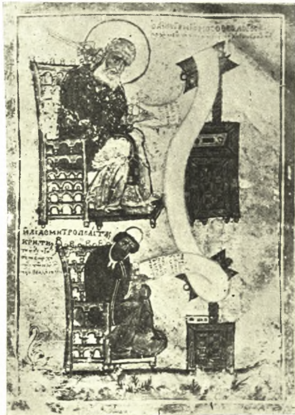
Εἰκ. 8. Ἁγ. Γρηγόριος ὁ Θεολόγος καὶ Ἡλίας Κρήτης. Μικρογραφία τοῦ κώδ. Α.Ν.Ι. 8 τῆς Πανεπιστημιακῆς Βιβλιοθήκης τῆς Βασιλείας.

μὲ τὸν κρουνόν, ὅπως τὴν βλέπομεν εἰς τὴν μικρογραφίαν τοῦ Ἀμβροσιανοῦ κώδικος, δὲν δυνάμεθα νὰ εἶμεθα βέβαιοι ὅτι ἐδημιουργήθη εἰδικῶς διὰ τὴν προκειμένην παράστασιν. Τὰς περὶ τούτου ἀμφιβολίας μᾶς ἐγείρει μία περιέργος μικρογραφία τοῦ κώδ. Α. Ν. Ι. 8 ἀποκειμένου εἰς τὴν Πανεπιστημιακὴν βιβλιοθήκην τῆς Ἑλβετικῆς Βασιλείας (Bâle, Basel) καὶ περιέχοντος τὰ ἔργα τοῦ Ἁγ. Γρηγορίου τοῦ Θεολόγου μετὰ τῶν ἐρμηνειῶν τοῦ Ἡλίου Κρήτης ἀνήκοντος δέ, κατὰ πᾶσαν πιθανότητα, εἰς τὰ τέλη τοῦ 12 ου ἢ εἰς τὰς ἀρχὰς τοῦ 13 ου αἰῶνος (εἰκ. 8) 1 . Εἰς τὴν μικρογραφίαν αὐτὴν εἰκονίζεται