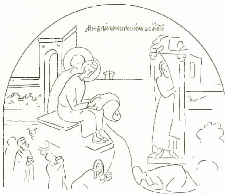
Εἰκ. 9. Τοιχογραφία τῆς Μ. Ντίλιου (1543) ἐπὶ τῆς νησίδος τῆς λίμνης Ἰωαννίνων.

Οὕτω, ἐκ τῆς ὅλης μέχρι τοῦδε γενομένης ἐρεῦνης, ἀποδεικνύεται ὅτι ἤδη ἀπὸ τοῦ 11 ου ἢ 12 ου αἰῶνος εἰς τὴν ἀρχικὴν ἀπεικόνισιν τοῦ Χρυσοστόμου μὲ τὸν Παῦλον,