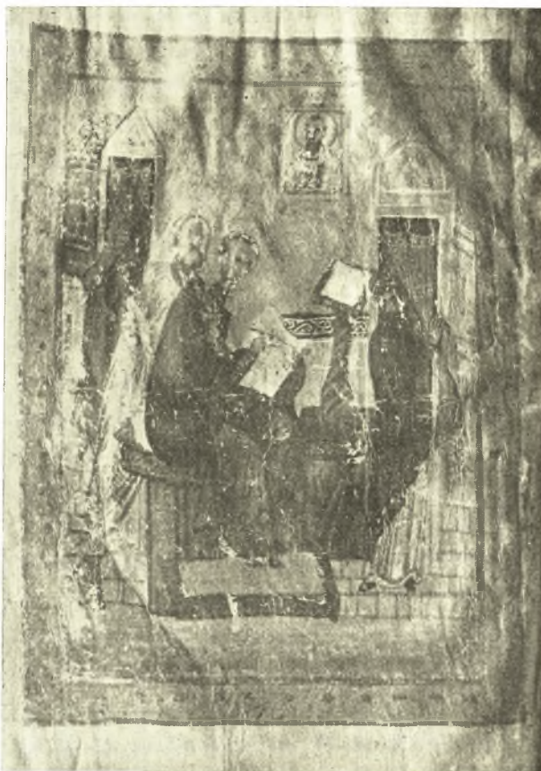
Εἰκ. 5. Μικρογραφία τοῦ κώδ. 7 τῆς Ἐθν. Βιβλιοθ. τῶν Ἀθηνῶν.

Αἱ δύο ἐξετασθεῖσαι μικρογραφίαι δεικνύουν ὅτι τὸν 11 ον ἤδη αἰῶνα ἢ παράστασις αὕτη τοῦ Χρυσοστόμου μὲ τὸν Παῦλον ὄχι μόνον εἶχε τελείως ἀπαρτισθῆ, ἀλλ' εἶχε καὶ εὐρύτατα διαδοθῆ. Τοῦτο ἐπιβεβαιοῦται καὶ ἀπὸ τὸ ἐπίγραμμα τοῦ Ἰωάννου Εὐχαίτων, τὸ φέρον τὸν τίτλον: « Εἰς τὴν κατὰ τὸν ἅγιον Παῦλον καὶ τὸν Χρυσόστομον ἱστορίαν », ὅπου ὁ λόγιος ἱεράρχης τοῦ 11 ου αἰῶνος περιγράφει εἰκόνα ἐντελῶς ἀνά-