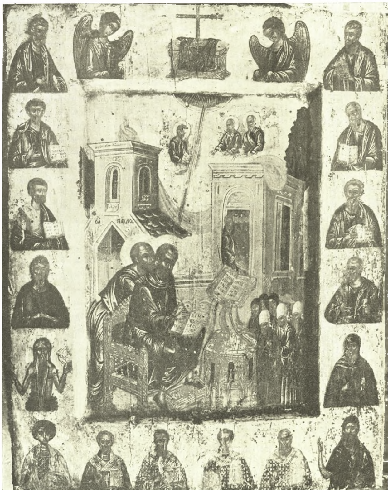
Ὁ Ἅγ. Ἰωάννης ὁ Χρυσόστομος μετὰ τοῦ Παύλου. Συλλογὴ Δ. Λοβέρδου. Ἀθῆναι.