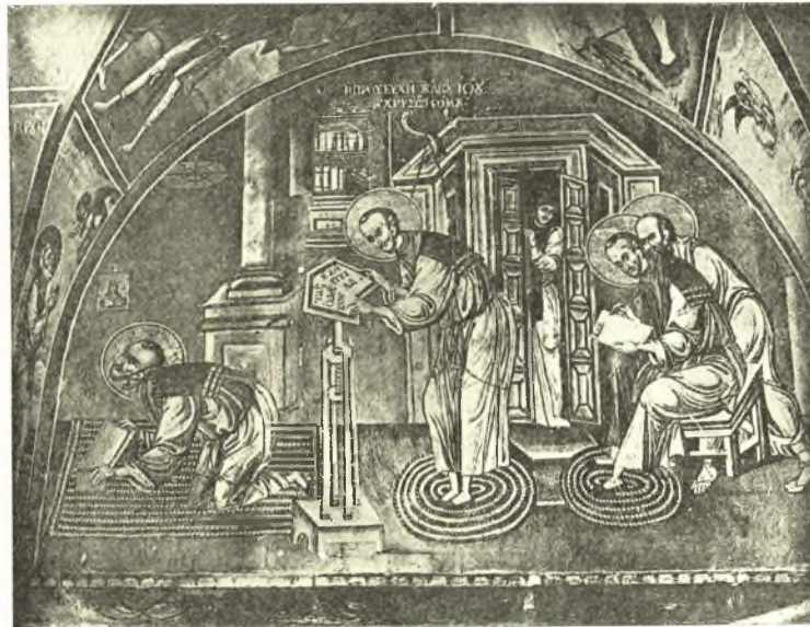
Εἰκ. 6. Σκηναὶ ἐκ τοῦ βίου τοῦ Χρυσοστόμου. Τοιχογραφία Μ. Χελανδαρίου Ἁγίου Ὄρους.

Διὰ νὰ συμπληρώσωμεν τὴν ἐξέτασιν τοῦ θέματος τοῦ Χρυσοστόμου μὲ τον Παῦλον εἶναι ἀνάγκη νὰ μελετήσωμεν καὶ μίαν ἀκόμη παράστασιν. Αὕτη εὑρίσκεται μεταξὺ τῶν τοιχογραφιῶν τοῦ καθολικοῦ τῆς Μονῆς Χελανδαρίου εἰς τὸ Ἅγιον Ὄρος. Αἱ τοιχογραφίαι αὗται ἐγένοντο περὶ τὸ 1300, τὰ χρώματά των ὅμως ἀνεανεώθησαν κατὰ τὸ 1804, χωρὶς οὐδὲν σχεδόν, εἰς τὰς περισσοτέρας τοῦλάχιστον σκηνας, ν' ἀλλοιωθῇ ἡ ἀρχικὴ σύνθεσις των 2 . Ὡστε εἰς τὴν ἐνδιαφέρουσαν ἡμᾶς σύνθεσιν ἡ ὅλη εἰκονογραφικὴ διάταξις εἶναι ἡ ἀρχικὴ τοῦ 14 ου αἰῶνος, ἐκτὸς ἐλαχίστων ἀσημάντων προσθηκῶν