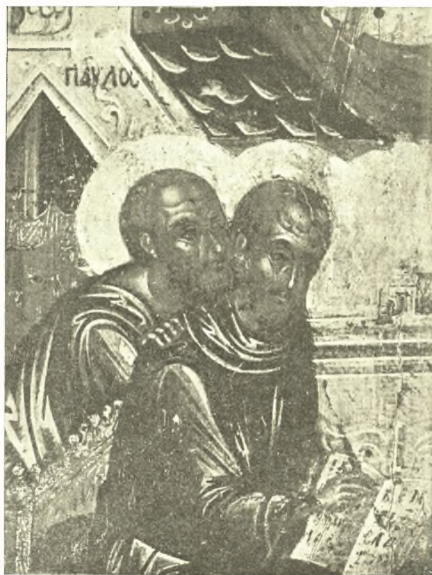
Εἰκ. 1. Ὁ Χρυσόστομος μετὰ τοῦ Παύλου. Λεπτομέρεια τοῦ πίν. 1. Μέγεθος πραγματικόν.

Τὰ πρόσωπα καὶ αἱ χεῖρες ζωγραφίζονται μὲ ἓν γενικὸν βαθὺ καστανὸν χρῶμα, τὸν προπλασμόν, ἐπ' αὐτοῦ δὲ λευκοκίτρινοι φωτεινὰ κηλίδες λίαν περιορισμένης ἐκτάσεως δηλοῦσι τὰ φωτιζόμενα μέρη (εἰκ. 1). Τὰ λίαν προεξέχοντα σημεῖα (οὔνα, ζυγωματικά, μέτωπον κ.λ.π.) τονίζουσιν ἐλάχισται λεπτόταται καὶ λίαν φωτεινὰ γραμμαί, ἐνῶ ὀλίγιστα ἄλλαι σκοτεινοῦ χρώματος, μόλις αἰσθηταί, σχεδιάζουν τὰς ὀφρῦς, τὰ βλέφαρα, τοὺς ὀφθαλμοὺς καὶ τὸ στόμα. Οὕτω κυριαρχεῖ εἰς τὰ πρόσωπα μία ζωγραφικὴ τεχνικὴ, συμφώνως πρὸς τὴν ὁποίαν ὅλα δηλοῦνται μόνον μὲ ἐναλλαγὴν φωτὸς καὶ σκιάς, χωρὶς οὐδόλως σχεδὸν τὴν χρησιμοποίησιν τῆς γραμμῆς διὰ τὴν δῆλωσιν τοῦ περιγράμματος καὶ τῶν λεπτομερειῶν. Ἡ ἴδια τεχνικὴ χρησιμοποιεῖται καὶ εἰς τὰ ἐνδύματα. Μέσοι τόνοι σχεδὸν οὐδόλως ὑπάρχουν. Τὰ φῶτα εἶναι πολὺ ὀλίγα, τονίζοντα καὶ ἐδῶ τὰς ἀκμὰς μόνον τῶν πτυχῶν. Τὰ ἴδια ἀκριβῶς χαρακτηριστικά, ὡς πρὸς τὴν τεχνικὴν ἐκτέλεσιν, παρουσιάζει ἡ ὠραιότητι εἰκῶν τῆς Συνάξεως τῶν Δώδεκα Ἀποστόλων, ἢ εὐρισκομένη εἰς τὸ Ἱστορικὸν Μουσεῖον τῆς Μόσχας 1 . Δυστυχῶς ἡ ἀκριβὴς χρονολόγησις τῆς εἰκόνας ταύτης δὲν ἔχει ἀκόμη ἐπιτευχθῆ. Ὁ Αἰνάλον χρονολογεῖ τὴν εἰκόνα ἀπὸ τοῦ 14 ου αἰῶνος 2 , ἀλλ' αἱ συγκρίσεις, ἐπὶ τῶν ὁποίων βασιζέται, δὲν εἶναι διόλου ἀσφαλεῖς 3 . Τὴν γνώμην τοῦ Αἰνάλον ἀκολουθοῦν καὶ οἱ