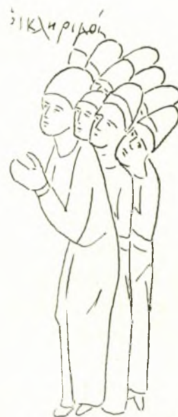
Εἰκ. 3. Κληρικοὶ. Λεπτομέρεια ἐκ μικρογραφίας τοῦ Σκυλίτζη τῆς Μαδρίτης.