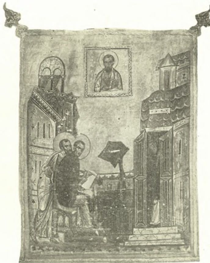
Εἰκ. 4. Μικρογραφία τοῦ κώδ. 766 τῆς Βιβλιοθήκης τοῦ Βατικανοῦ.

Συλλογῆς Λοβέρδου, πρὸ ὁμοίας ἀδυναμίας εὐρεθεὶς διὰ τὴν ἐξεύρεσιν θέσεως πρὸς τοποθέτησιν τῆς εἰκόνος τοῦ Παύλου καὶ μὴ ἐννοῶν, φαίνεται, νὰ παραβιάσῃ τὴν φυσικότητα τοῦ ἔργου του, τὴν παρέλειψε. Δέον τέλος νὰ σημειώσωμεν, σχετικῶς μὲ τὴν μικρογραφίαν ταύτην τοῦ κώδικος τοῦ Βατικανοῦ, καὶ μίαν ἀκόμη λεπτομέρειαν. Ὁ Χρυσόστομος δηλαδὴ παρίσταται καθήμενος ἐπὶ θρόνου, ὅπως καὶ εἰς τὴν εἰκόνα τῆς Συλλογῆς Λοβέρδου. Τὸν θρόνον ἀναφέρει ρητῶς ἐκ τῶν βιογράφων μό-