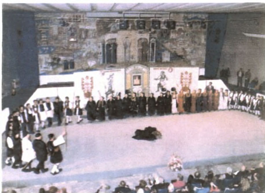
Εικόνα Νο.7: Χορός των Βλάχων της Βέροιας στη Θεσσαλονίκη (1993)