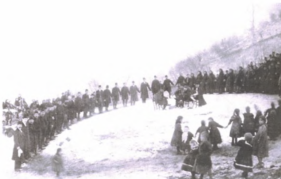
Εικόνα Νο.6: Χορός των Βλάχων της Βέροιας στην Κουμαριά (1906)

βλάχικοι σκοποί : συγκαθιστά, στρωτά, μπεράτια, τσάμικα, κυρατζίδικα και κτηνοτροφικά. Άλλα είναι καθιστικά και άλλα χορευτικά.