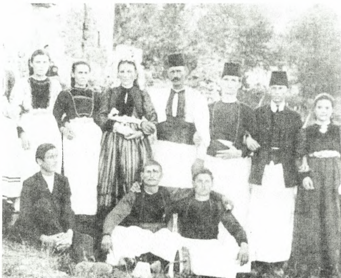
Εικόνα Νο 17: Οι νεόνυμφοι με φίλους και συγγενείς – Σαμαρίνα (1911)

Από 'κει κι έπειτα η ζωή κυλούσε στα πλαίσια του έγγαμου βίου με τη γέννηση των παιδιών και το μεγάλωμα της οικογένειας.