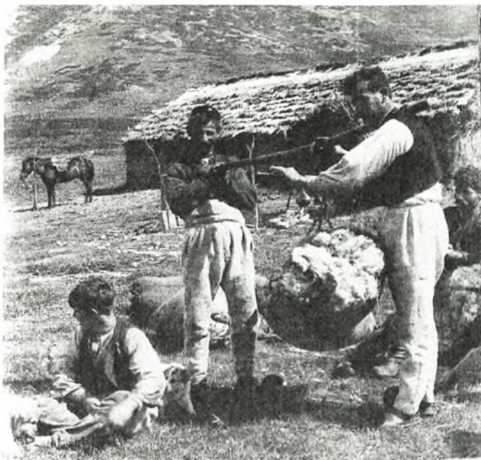
Εικόνα Νο.1 Βλάχοι κτηνοτρόφοι

μεταφορείς όχι μόνο προϊόντων αλλά και ιδεών, σύνδεσμος του Ελλαδικού χώρου με τον ευρύτερο Βαλκανικό και την Ευρώπη.