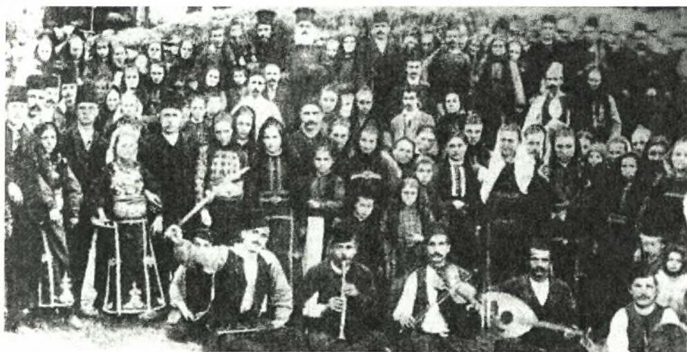
Εικόνα Νο.8: Γλέντι βλάχικου γάμου στο χωριό Βρυσχώρι του Ζαγορίου

Κομπανίες με κλαρίνα και βιολιά που αποδίδουν αυθεντικά τα βλάχικα τραγούδια υπάρχουν πολλές ακόμη και σήμερα, κυρίως στα Γρεβενά, που ασχολούνται με μεράκι και πάθος με την παραδοσιακή μουσική και αποδίδουν με εκπληκτική ακρίβεια τα βλάχικα τραγούδια. Επίσης, σήμερα, πολλά νέα παιδιά μαθαίνουν παραδοσιακά όργανα και επανδρώνουν τις κομπανίες των συλλόγων, όπως της Βέροιας, των Σερρών, του Βελεστίου.