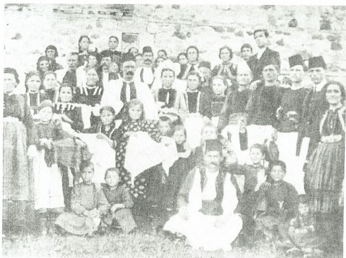
Εικόνα Νο 16: Οι συγγενείς πηγαίνουν την παπάρα –Σαμαρίνα (1911)