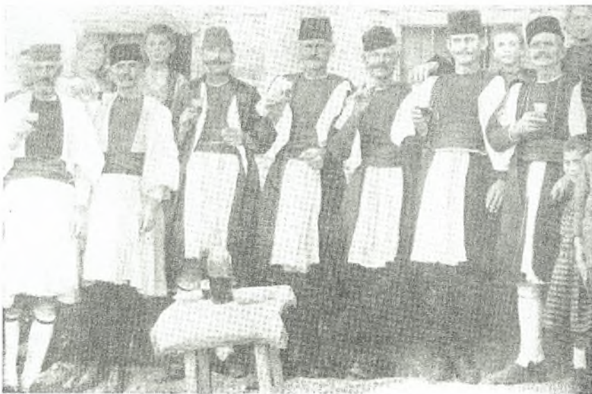
Εικόνα Νο.9: Από βλάχικο αρραβώνα στην Αβδέλα (1927)

Στη διάρκεια του αρραβώνα, οι συγγενείς του γαμπρού πάνε κάπου κάπου στην νύφη με <<ποάμιλε>> (φρούτα). Καθένας τους αγοράζει ένα μαντήλι και γλυκά. Τα βάζουν σ' ένα καλάθι, το σκεπάζουν με άσπρο πανί, το δίνουν σ' ένα αγόρι να το κουβαλήσει στο κεφάλι του, και πηγαίνουν στην νύφη. Πρώτα πηγαίνει το αγόρι και μετά οι αδερφές και ξαδέρφες εκείνου που στέλνει τα δώρα. Μόλις δεχτεί η νύφη τα δώρα και τα βγάλει από το καλάθι, βάζει στη θέση τους τρία ζευγάρια κάλτσες πλεκτές και ένα μαντήλι για τον κουβαλητή. Τη Σαρακοστή οι συγγενείς του γαμπρού στέλνουν και πάλι δώρα με τον ίδιο τρόπο, αλλά αντί για γλυκά βάζουν χαλβά. Το Πάσχα ο γαμπρός στέλνει στη νύφη μια λαμπάδα για την Ανάσταση.