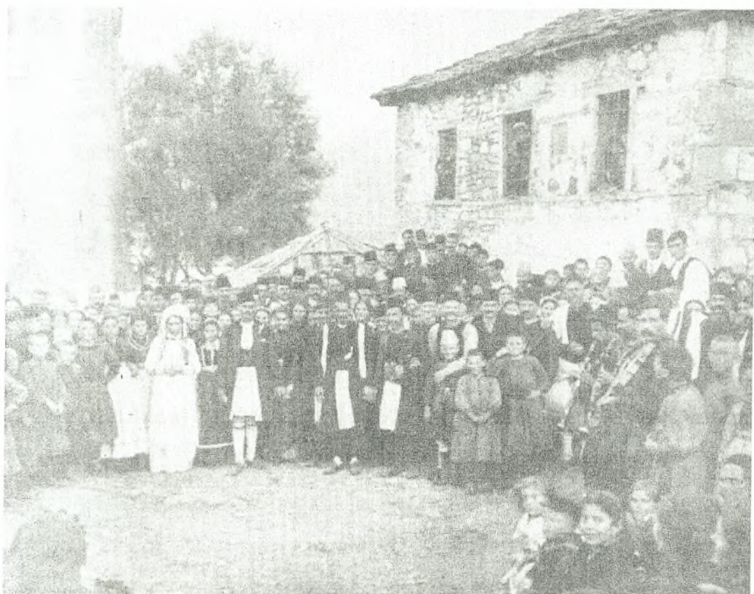
Εικόνα Νο 15: Η νύφη στο σπίτι του γαμπρού μετά τα στέφανα – Σαμαρίνα (1911)

παραλαβής>>. Τα χέρια της νύφης τώρα τα κρατούν ο πατέρας και ο θείος του γαμπρού. Ο πατέρας του γαμπρού δίνει στο συμπτέθερό του χρήματα, ως ένδειξη ευγνωμοσύνης.