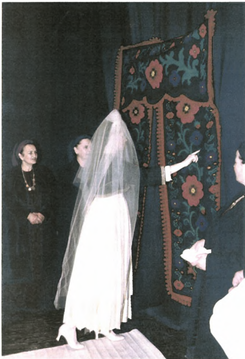
Εικόνα Νο.10: Η νύφη δείχνει τα προικιά. (Αναπαράσταση βλάχικου γάμου από Σύλλογο βλάχων Βέροιας)

τηγάνια, ταψιά, τεντζερέδες για το νέο σπιτικό που θα ανοίξουν οι νιόπαντροι. Τα δώρα αυτά έχουν ανταποδοτικό χαρακτήρα.