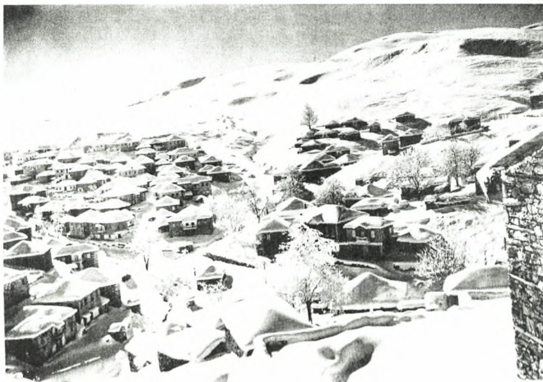
Εικόνα Νο.4: Το Σέλι

Οι Βλάχοι του νομού Ημαθίας διακρίνονται σε όλους τους τομείς του επιχειρηματικού και κοινωνικού βίου και αντιπροσωπεύονται πανελληνίως και διεθνώς από το Λαογραφικό Σύλλογο Βλάχων Βέροιας.