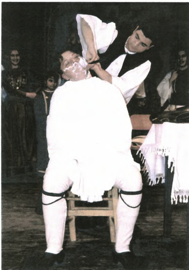
Εικόνα Νο 13: Ο μπράτιμος ξυρίζει το γαμπρό (Αναπαράσταση βλάχικου γάμου από Σύλλογο βλάχων Βέροιας)

Βέβαια ο γαμπρός δεν αλλάζει σπίτι, όπως η νύφη, αρχίζει όμως μια καινούρια ζωή και οι σχέσεις του με τους δικούς του θα αλλάξουν.