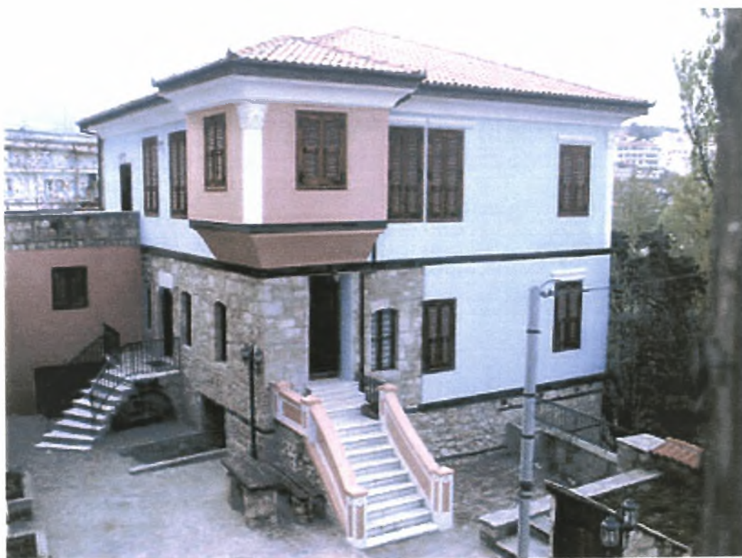
Εικόνα Νο 18 : Το κτίριο του Λαογραφικού Συλλόγου Βλάχων Βέροιας

<<Τραγούδια από τη ζωή των Βλάχων>>. Συνεργάστηκε στην έκδοση βιβλίων και γύρισε δύο ταινίες μικρού μήκους.