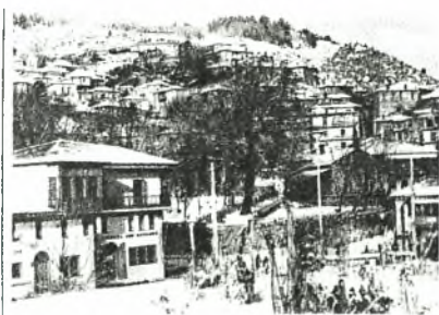
Εικόνα Νο.2 Το Μέτσοβο

Τη Χώρα Μετσόβου αποτέλεσαν τα χωριά Μηλιά Μετσόβου, Ανήλιο, Βοτονόσι, Ανθοχώρι, Μαλακάσι, Πλατάνιστος, καθώς και οι μικροί οικισμοί που φέρονται να υπήρχαν στις θέσεις των σημερινών χωριών Παναγία και Καλυβοχώρι. Η περιοχή τους απολάμβανε προνομιακό καθεστώς αυτονομίας και αυτοδιοίκησης. Από τα βλαχοχώρια της <<Χώρας Μετσόβου>>, το Μέτσοβο, το Συρράκο και οι Καλαρίτες γνώρισαν στιγμές μεγάλης δόξας και πλούτου κατά τη διάρκεια του 18 ου και τις αρχές του 19 ου αιώνα. Όμως μόνο το Μέτσοβο μπόρεσε να παραμείνει ακμαίο μέχρι και σήμερα, παραμένοντας ο μεγαλύτερος και ακμαιότερος βλάχικος οικισμός σε όλη τη Βαλκανική. Οι περισσότεροι από τους Βλάχους του Νότιου Μαλακασίου ή Βλαχοτζουμέρκου έχουν σκορπίσει ως πρώην παραχειμάζοντας νομαδοκτηνοτρόφοι, εμποροβιοτέχνες και εσωτερικοί μετανάστες κυρίως στα Γιάννινα, την Πρέβεζα και τα χωριά του Θεσσαλικού κάμπου, όπως και τα πεδινά χωριά της Άρτας, μέχρι και στα χωριά του Ξηρόμερου στην Αιτωλοακαρνανία.