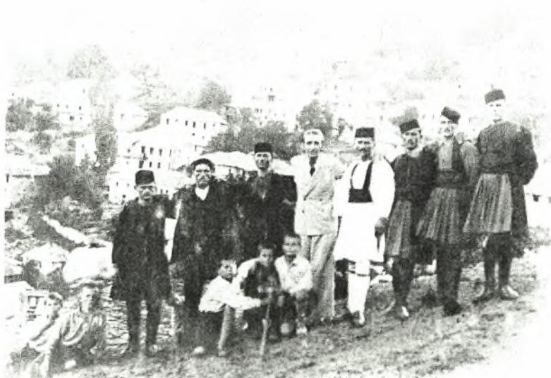
Εικόνα Νο.3: Βλάχοι στην Αβδέλα

Κατά τη διάρκεια του 20 ου αιώνα, οι κάτοικοι που παρέμεναν συνδεδεμένοι με τους μητροπολιτικούς οικισμούς ακολούθησαν την πορεία της οριστικής εγκατάστασης, κυρίως στις περιοχές των παραδοσιακών θεσσαλικών χειμαδιών και περισσότερο στις επαρχίες των Τρικάλων, της Ελασσόνας, του Τυρνάβου, της Λάρισας και του Βόλου.