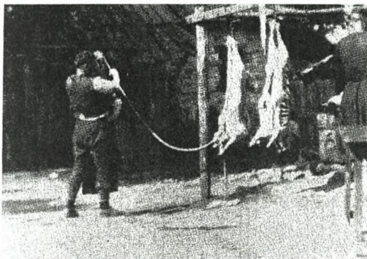
Εικόνα Νο.11: Τα σφαχτά του γάμου-Αβδέλα (1927)

Στενοί συγγενείς φέρνουν σφαχτά (κανίσκια) και οι φίλοι και σχεδόν όλο το χωριό, κουλούρες από ζυμωτό ψωμί.