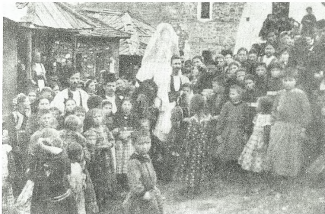
Εικόνα Νο 14: Οι συμπέθεροι παίρνουν τη νύφη – Σαμαρίνα (1911)

Όλοι μαζί, νύφη, γαμπρός, κουμπάρος και συγγενείς παίρνουν το δρόμο για την εκκλησία. Μπροστά πηγαίνουν οι μουσικοί και οι τραγουδιστές. Στο δρόμο, δεξιά και αριστερά, περιμένουν όλοι σχεδόν οι κάτοικοι του χωριού, οι οποίοι ακολουθούν κι εκείνοι μετά τη γαμήλια πομπή στην εκκλησία.