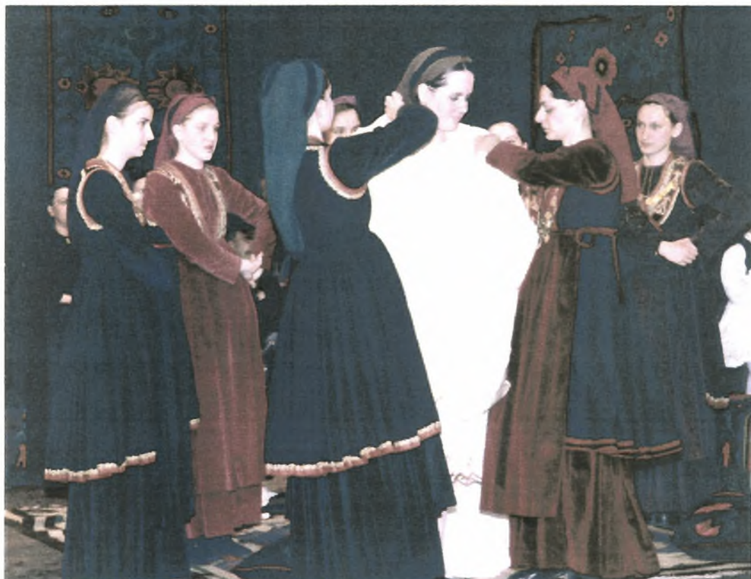
Εικόνα Νο.12: Το στόλισμα της νύφης από τις φιλενάδες της. (Αναπαράσταση βλάχικου γάμου από Σύλλογο βλάχων Βέροιας)