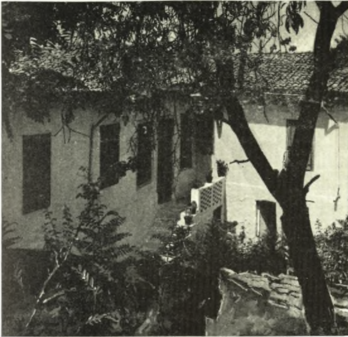
Τὸ σπίτι τοῦ Σκίπη