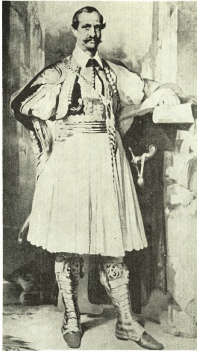
ΟΘΩΝ ΒΑΣΙΛΕΥΣ ΤΩΝ ΕΛΛΗΝΩΝ

Ἐπιτρόπων ἐπιφορτισμένων τὴν μελέτην τῆς καταστάσεως τῶν πραγμάτων καὶ νὰ ἐπιζητήσουν νὰ ἐπαναφέρουν εἰς τὸ καθῆκον τοὺς ἀρχηγούς τῶν ἐπαναστατῶν καὶ ν' ἀποκαταστήσουν, ἂν εἶναι δυνατόν, τὴν μεταξὺ τῶν Τουρκικῶν καὶ Ἑλληνικῶν ἀρχῶν καλὴν ἁρμονίαν. Εὐτυχῶς εἶχον πρὸχειρον πρὸς ἐκπλήρωσιν τῆς ἀποστολῆς ταύτης τὸν Guerin, τὸν ὁποῖον ἡ Ὑμετέρα Ἐξοχότης εἶχε θέσει εἰς τὴν διάθεσιν τοῦ στρατηγοῦ Forey 4 καὶ ὅστις πρὸς στιγμὴν οὐδὲν εἶχε πλέον νὰ κάμῃ ἐν Ἀθήναις. Ὁ Guerin κατοικεῖ τὴν Ἑλλάδα ἀπὸ 25 ἐτῶν. Γνωρίζει τοὺς Ἑλλη-