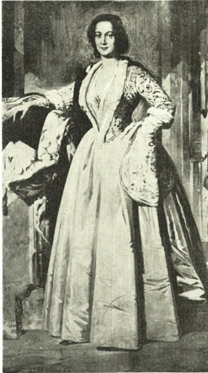
ΑΜΑΛΙΑ ΒΑΣΙΛΙΣΣΑ ΤΩΝ ΕΛΛΗΝΩΝ

Τὴν 2 Ἰουλίου ὁ Guerin ἀναφέρει περὶ τῆς 24 ἡμέρας διαρκεσάσης ἀποστολῆς του εἰς τὸν ὑπουργὸν Ἑξωτ)κῶν Dr. Lhuys, εἰς ὃν ὁ πρεσβευτὴς Rouen τὴν ἰδίαν μὲν ἡμέραν (E 4, E 15) διαβιβάζει συνημμένως τὰς 4 ἐκθέσεις τοῦ διατρέξαντος «ἐν μέσῳ ληστῶν» τὴν Θεσσαλίαν Guerin, τὴν δὲ 7 Ἰουνίου (E 11, E 13) γνωρίζει τὴν εἰς Ἀθήνας ἄφιξιν τοῦ Παπακώστα (E 3) κλπ. ὡς καὶ τῶν Γριζάνη καὶ Μοσκοβάκη εἰς Εὐβοίαν, ὅπου κατ' ἀναφορὰν τοῦ ὑπο-