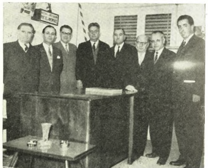
Τὸ Διοικητικὸν Συμβούλιον τῆς ἐν Θεσσαλονίκῃ Λέσχης τῶν Θεσσαλῶν «Ρήγας Φεραῖος» (1961 - 1962), τοῦ σωματείου μετὰ τὴν λαμπρὰν δρᾶσιν, πού τιμᾶ τὸ θεσσαλικὸν ὄνομα εἰς τὴν συμπρωτεύουσαν.