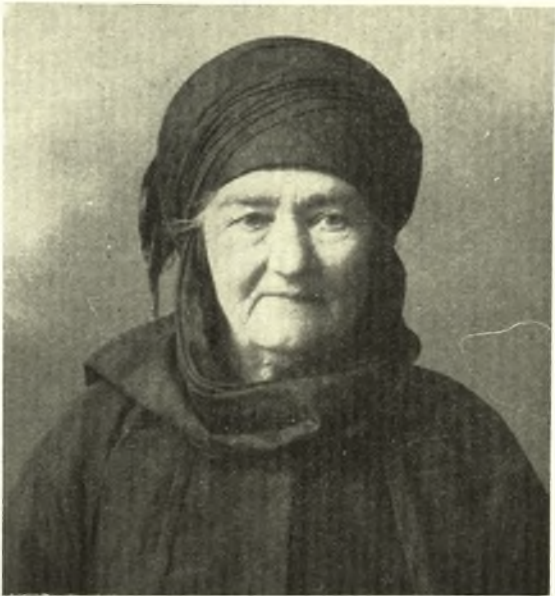
Ἐνδυμασία ὀρίμου γυναικός.