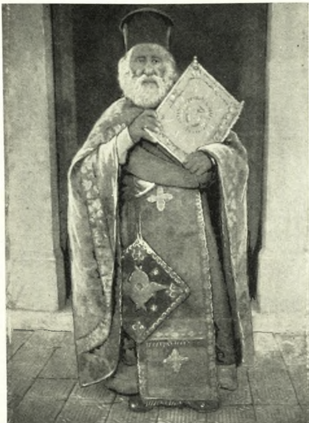
Ίερεὺς παρελθόντος αἰῶνος.

μπούλεων καὶ ἡ κομόπολις Ἅγιος Λαυρέντιος τῇ προτροπῇ καὶ ἐνθαρρύνσει τοῦ Κωνσταντίνου Σακελλαρίδου Θετταλομάγνητος.