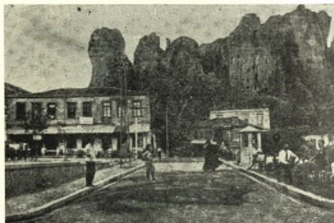
Καλαμπάκα: Κεντρική πλατεία.