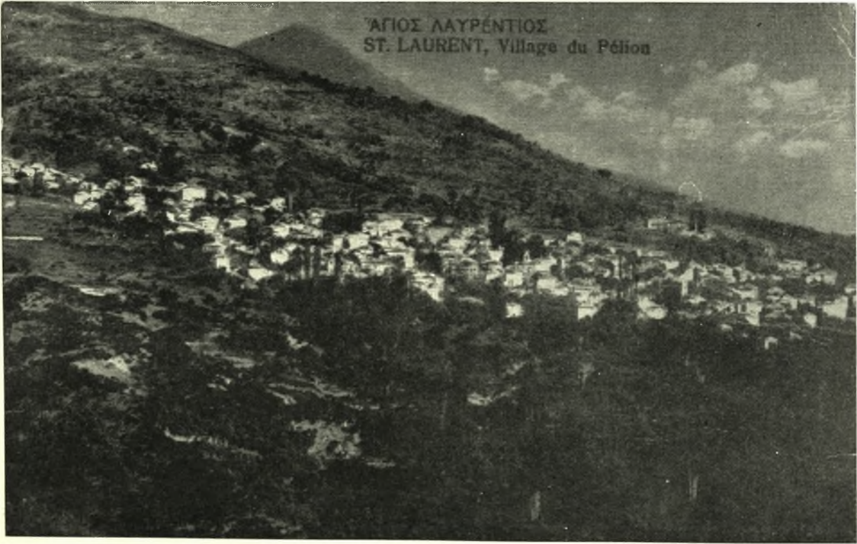
Γενικὴ ἀποψὶς τοῦ χωρίου Ἅγιος Λαυρέντιος Πηλίου.

Ὅμοίως κατὰ τὴν σφαγὴν τῶν 3 χιλιάδων Τρικκαίων ἐν Λαρίσσει τὴν 9 Μαρτίου τοῦ 1770 (Κούμας Τ. 10 σελ. 583), πολλοὶ κατέφυγον καὶ πάλιν εἰς τὰ χωρία τοῦ Βόλου.