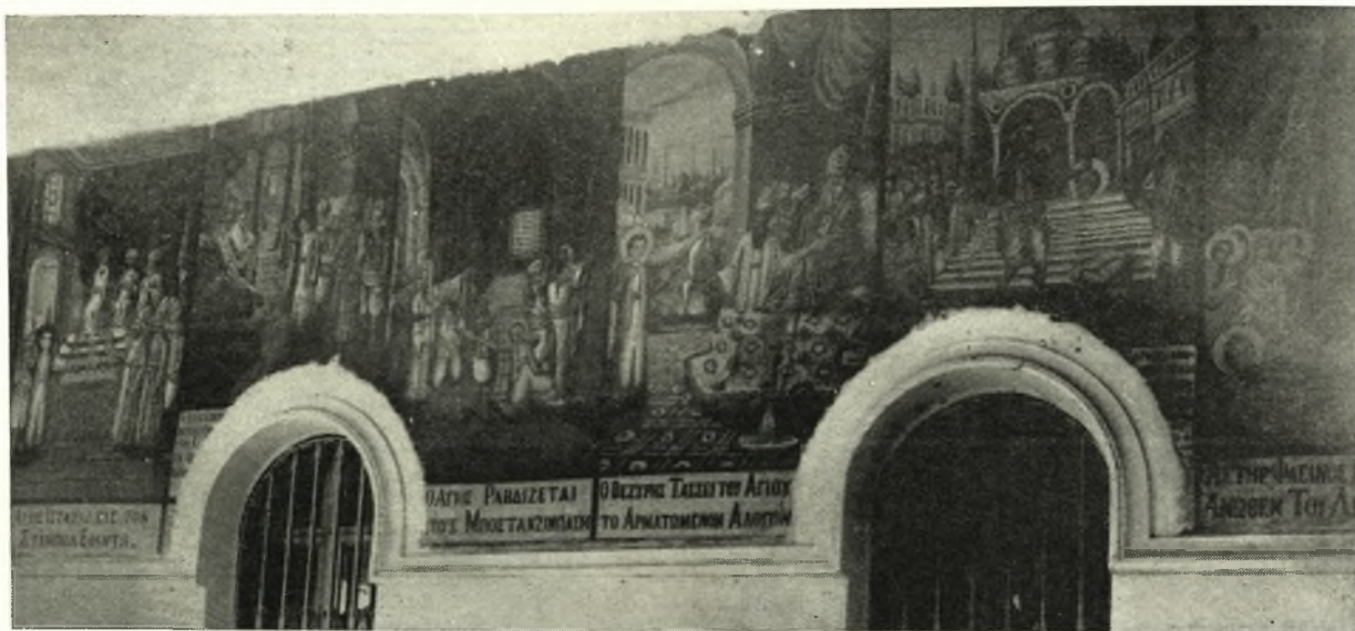
Τοιχογραφία ἐκ τοῦ κατεστραμμένου Ναοῦ Ἁγίου Ἀποστόλου τοῦ Νέου.

σης τοῦ ἐγένετο ὑποδοχή καὶ συνωμίλησε μετὰ τῶν προυχόντων, εἶτα ἀνεχώρησεν εἰς Ἅγιον Λαυρέντιον παραμείνας καὶ συνεννοηθεὶς μετὰ τοῦ ἀρχηγοῦ τῆς ἐπαναστάσεως καὶ ἐκεῖθεν διὰ τῆς Δρακείας μετέβη εἰς Μακρυνίτσαν ἔνθα καὶ ἔλαβε μέρος εἰς τὰς αἵματηρὰς μάχας Μακρυνίτσης καὶ Σαρακηνοῦ.