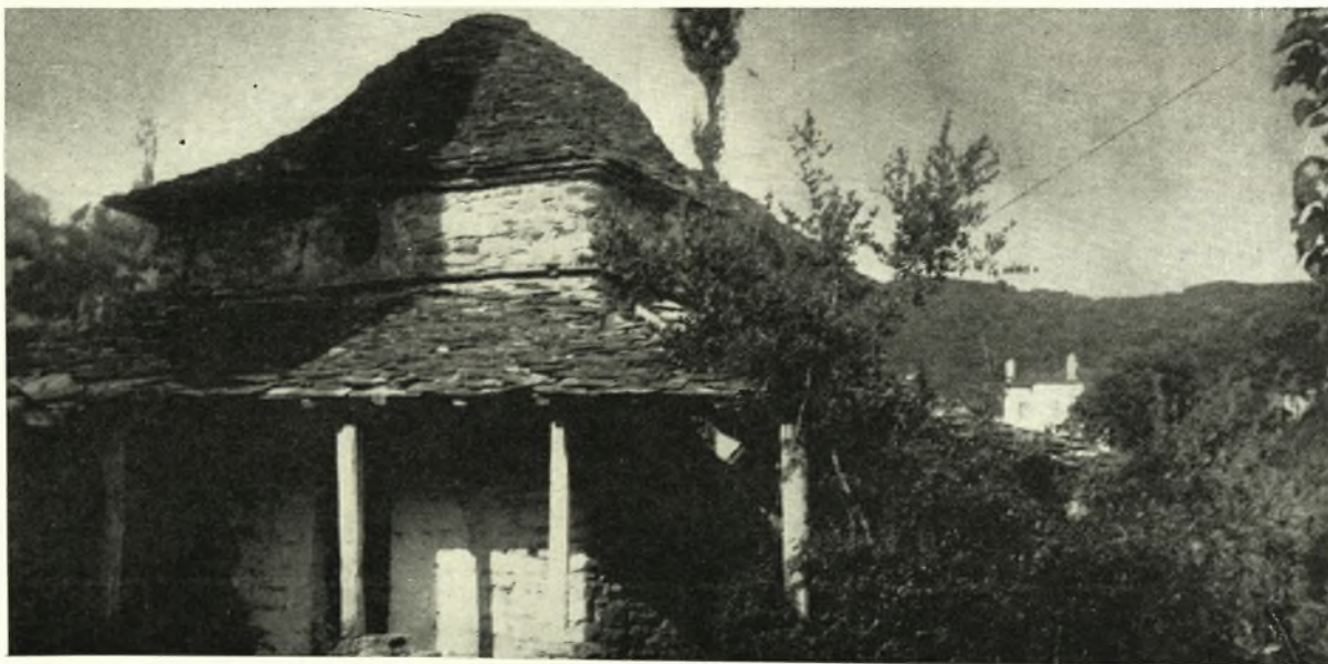
Ἅγιος Λαυρέντιος: Ἐξωκλήσιον Ἁγίου Νικολάου.