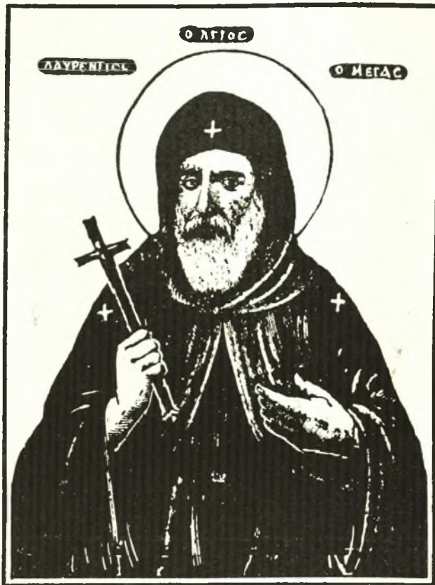
Εἰκὼν Ἀγίου Λαυρεντίου.

βερνήσεως τὸν Ἱερώνυμον Κασσαβέτην καὶ Γενικὸν Γραμματέα τὸν Κ. Σακελλαρίδην.