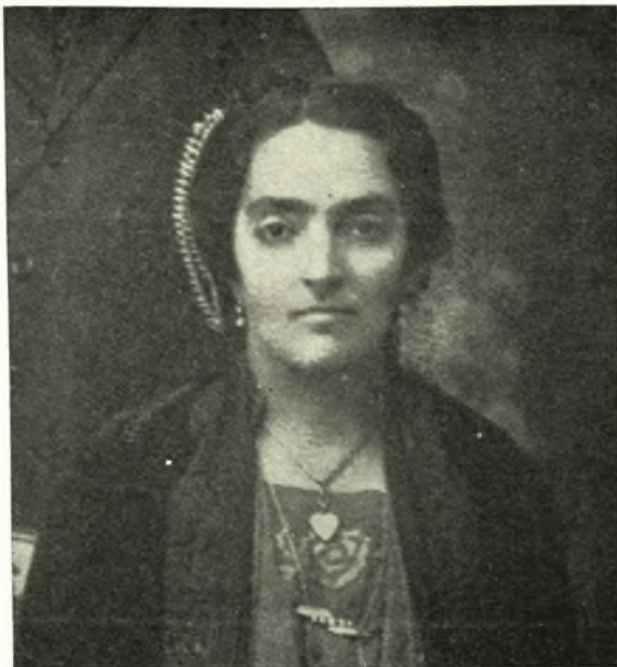
Περίκομψη ένδυμασία γυναικός.