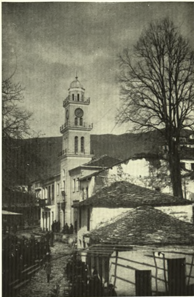
Ἅγιος Λαυρέντιος. Ἀγορὰ μὲ τὸ παλαιὸν Ὁρολόγιον.

Οὕτω καὶ ἡ κωμόπολις Ἅγιος Λαυρέντιος ἐδιοικεῖτο αὐτονομιακῶς ἀπὸ τοῦ ἔτους 1517 καὶ μάλιστα προνομιακῶς καθὼ βακουφικὴ ὑποκειμένη εἰς τὸ Ἑβκάφιον (Ὑπουργεῖον τῶν Θρησκευμάτων), ἡ ὑπηρεσία τοῦ ὁποίου διώριζεν ἱερωμένον διοικητὴν μέχρι τοῦ 1790, Βοεβόδα καλούμενον. Τῆς ὑπηρεσίας ταύτης ὑπάλληλος λαϊκός, πρῶτος διωρίσθη ὁ Σουκρὴ Πασσᾶς Βοεβόδας, ἔδρα τοῦ ὁποίου ἦτο ἡ Μακρυνίτσα, ὅποτε ἔνεκα ἔριδος τῶν κομμμάτων καὶ τῶν προεστώτων τῆς Μακρυνίτσας, ἀπεφάσισαν οἱ προεστοὶ νὰ μεταφέρωσι τὸ Διοικητήριον εἰς μικρὸν χωρίον, καὶ ὡς τοιοῦτον ἐξέλεξαν τὸ Καραμπάσιον. Ἀλλ' ἐπειδὴ