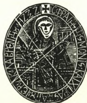
Ίστορική σφραγίς Κοιν. Ἁγ. Λαυρεντίου.