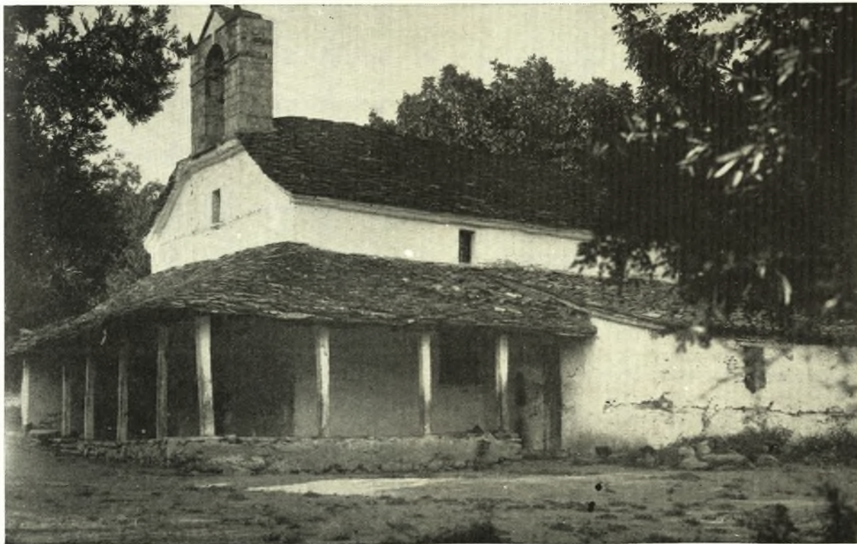
Ἅγιος Λαυρέντιος. Ἐξωκλήσιον Ἁγίου Ἰωάννου