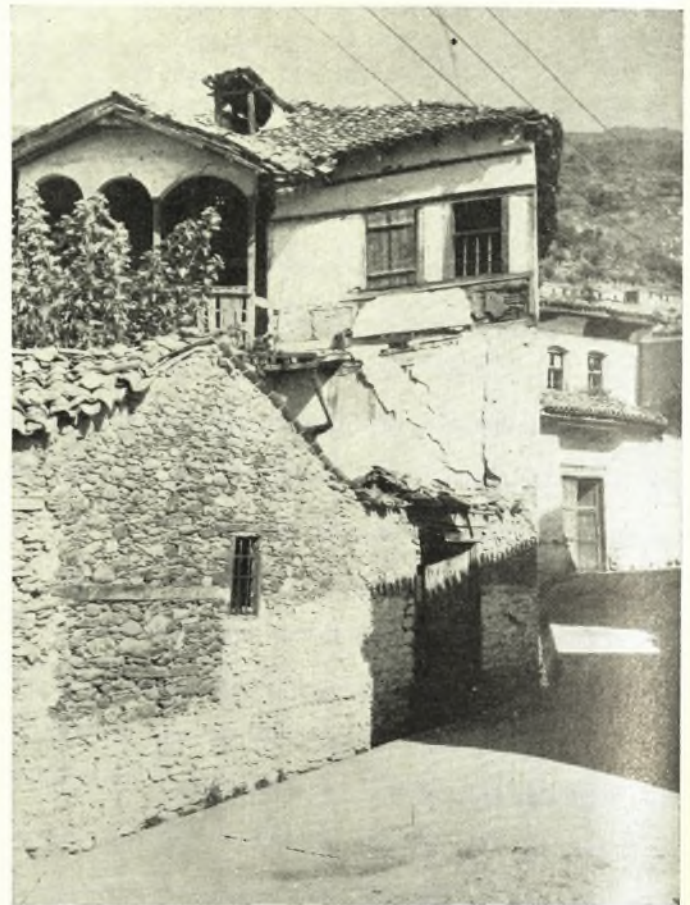
Ἁγία: Παλιὸ Ἀρχοντικό.