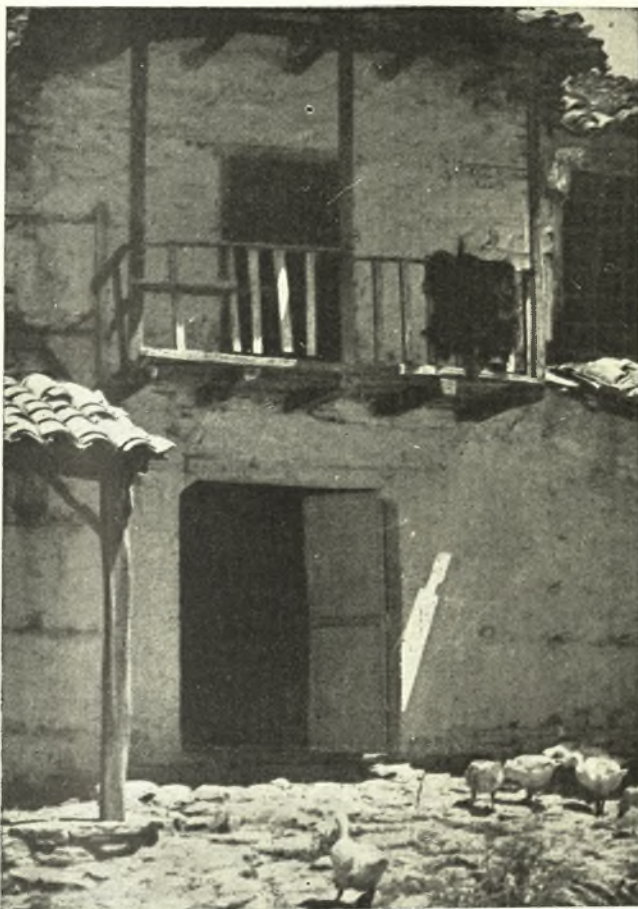
Ἄγια: Μιά γραφική αὐλή.