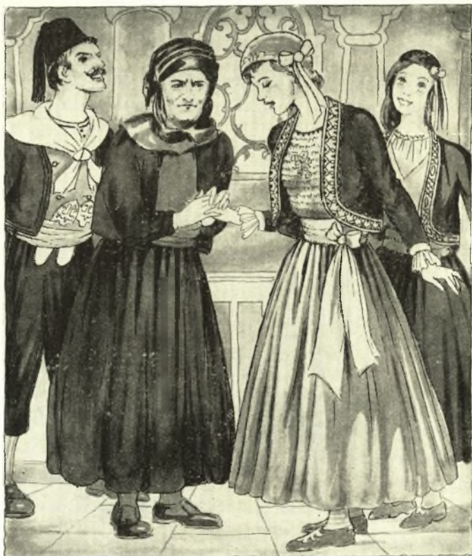
Μητέρα και Νύφη

Ἀπ' τὴν Τετάρτη τὸ βράδι ὁ γαμπρός σταματοῦσε τὶς συχνὲς ἐπισκέψεις στο σπίτι τῆς νύφης. Θὰ ξαναβλέπονταν πιά τὴν ἡμέρα του γάμου. Τὴν Πέμπτη γίνονταν οἱ προετοιμασίες του «μπακλαβᾶ», του γλυκοῦ πού θὰ κερνοῦσαν μετά τὰ στεφανώματα, και τὴν Παρασκευὴ τὸ πρῶι τὸν ἔστρωναν στά ταψιά, τὸν ἔκοβαν και τὸν φούρνιζαν. Τὸ «ἀστέρι», δηλαδή τὴν καρδιά του μπακλαβᾶ, τὸ κρατοῦσαν γιὰ νὰ κερᾶσουν τὸ ζευγάρι μετά τὸν γάμο. Τὸ πρῶι τῆς Παρασκευῆς γίνονταν τὰ «καλεσματα». Τούτη τὴν φροντίδα τὴν εἶχε ὁ «μπράτιμος», πούκανε προφορικὴ τὴν πρόσκληση, γυρίζοντας σ' ὄλα τὰ σπίτια πού τοῦχαν ὑποδείξει οἱ συμπεθέροι, φορώντας μαντήλι ἄσπρο στὸν λαιμὸ κι ἔχοντας περασμένο γαρύφαλο στ' αὐτὴ, κάτω ἀπ' τὴν τραγιάσκα. Ὁ μπράτιμος ἦταν ἓνα εἶδος επαγγελματία κι ἀνελάμβανε μέ ἀμοιβὴ ὅλη τὴ διοργάνωση και ὁμαλὴ διεξαγωγὴ ἑνὸς γάμου. Φρόντιζε γιὰ τὸ φόρτωμα τῶν προικιῶν, τὸ κάλεσμα και κέρασμα τῶν προσκεκλημένων, τὸ κάλεσμα τῶν ὀργάνων και τὸ κάλεσμα του μπαρμπέρη, κι εἶχε τὴν φροντίδα του γαμήλιου τραπεζιοῦ. Πολλὲς φορές ἔμπαιναν δυὸ μπράτιμοι, κι ἂν ὁ γάμος ἦταν πολὺ πλούσιος και τέσσερις, ἓνας ἢ