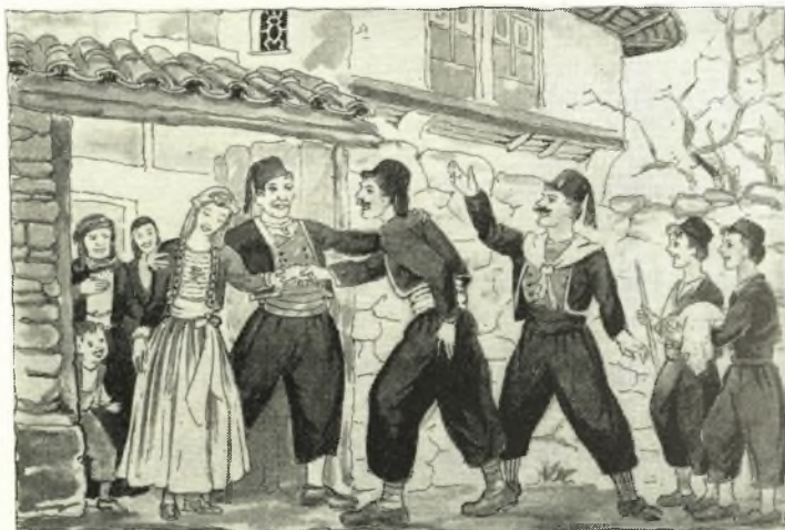
Έρχεται ὁ Γαμπρὸς

Τήν Κυριακή τὸ πρωί θὰ φόρτωναν απ' τὸ σπίτι της νύφης τὰ προικιά. Τὰ ζῶα ξεκινούσαν απ' τὸ σπίτι του γαμπρὸς στολισμένα με λουλούδια, με σκεπασμένο τὸ σαμάρι τους μ' ένα πολύχρωμο χράμι ή κιλίμι, πάνω στο ὁποῖο κάθονταν τὸ συμπεθεριό. Κατὰ τήν πομπή μπροστὰ πήγαινε τὸ ζῶο του μπράτιμου μ' αὐτὸν καβάλλα, κρατώντας ένα μεγάλο δίσκο πάνω στον ὁποῖο ὕπηρχε ή νυφιάτικη φορεσιά, οί κάλτσες, τὰ παπούτσια, οί παντόφλες και τὰ κοσμήματα της νύφης, όλα δῶρα του γαμπρού. Πίσω άκολουθοῦσαν οί συμπεθεροι κρατώντας από μιά άνοδοέση με λουλούδια της εποχής. Φτάνοντας στο σπίτι της νύφης ξεπέζευαν· ή νύφη τούς κερνούσε μεζὲ και κρασί, χόρευαν τὰ προικιά κάμποση ὦρα, και ὕστερα τὰ φόρτωναν. Σ' ένα απ' τὰ ζῶα φόρτωναν απ' τήν μιά μεριά τὸ καζάνι και απ' τήν άλλη τὸ άρνί, στολισμένο με κορδέλλες, τὸν μπακλαβά και τις κουλούρες. Ἡ ἴδια πομπή περνούσε απ' τούς καλύτερους δρόμους του χωριού για να καμαρώσουν και να