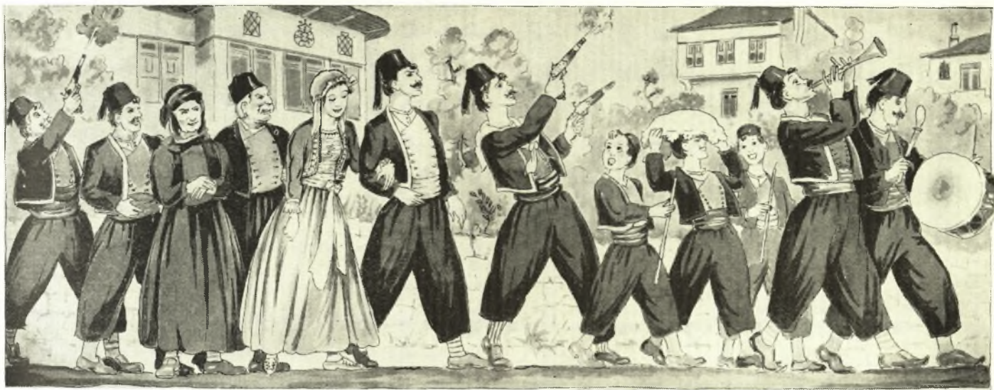
Ἡ πομπή του Γάμου

Σάν τέλειωνε το μυστήριο και χαιρετούσαν όλοι τα στέφανα, έβγαιναν στην πλατεία όπου γίνονταν ο χορός. Το χορό τον άνοιγε ο κουμπάρος κι ύστερα οί γονεΐς του ζευγαριού. Μετά θα περνούσαν και θα χόρευαν την νύφη όλοι οί συγγενείς, γνωστοί πολλοί και φίλοι, κι όλοι