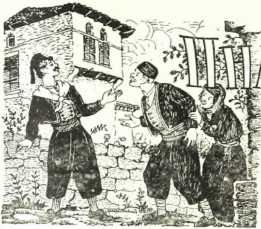
Εικόνογρᾶψη Ε. ΣΠΥΡΙΑΩΝΟΣ