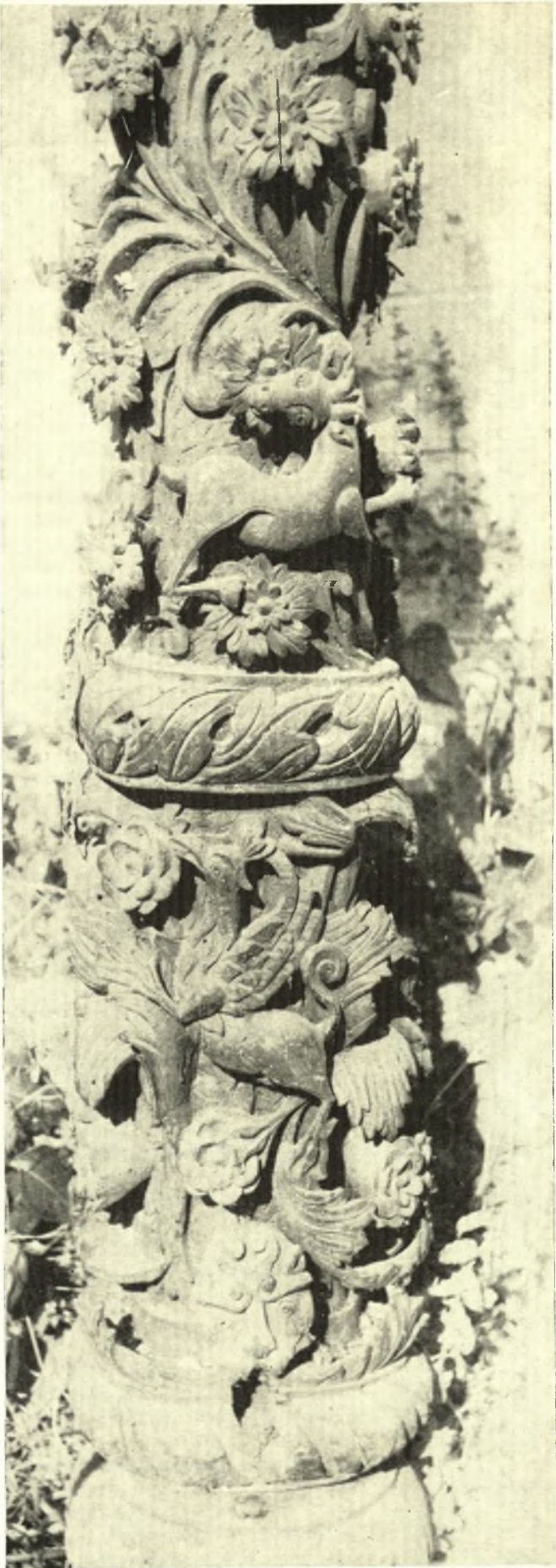
Συλόγλυπτος κιονίσκος ἀπὸ τὸ τέμπλο τῆς Παναγίτζας Ζαγορᾶς (Ἀπὸ τῆ συλλογῆ Βαγγέλη Σκουβαρᾶ)