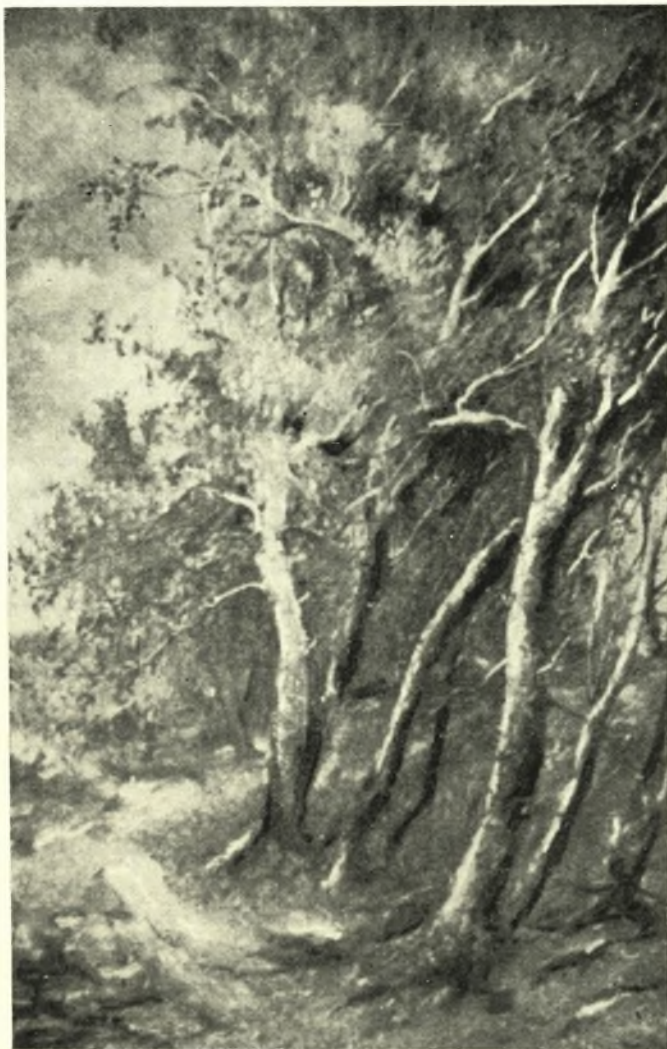
ΚΩΣΤΑ ΝΤΑΚΟΥ : ΤΟ ΔΑΣΟΣ