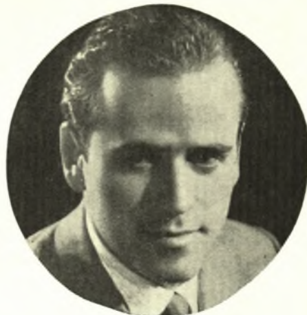
ΓΕΩΡΓΙΟΣ ΚΑΛΑΚΑΛΑΣ Γλύπτης

Γεννήθηκε στον Τύρναβο το 1938. Άπεφοίτησε το 1957 από το Γυμνάσιο Λαρίσης. Το 1962 άπεφοίτησε από την Σχολή Καλών Τεχνών και έτυχε του Διπλώματος. Το 1962 έλαβε μέρος εις τον Πανελλήνιον Διαγωνισμόν του μνημείου της Άπελευθερώσεως των Κυπρίων μετά του Άνδριάντος Αύξεντιου (έλαβε παμψηφεί το Α΄ βραβείον). Το 1964 έλαβε μέρος εις τον Πανελλήνιον Διαγωνισμόν διά την άνέγερσιν μνημείου πεσσόντων εις Πειραιά. Έτυχε παμψηφεί του Α΄ Βραβείου. Το 1966 έλαβε μέρος εις την Έκθεσιν Γλυπτικής νέων του Υπουργείου Παιδείας έτυχεν τον Β΄ έπαινον. Επίσης έλαβε μέρος εις την Α΄ έκθεσιν του Συλλόγου άποφοίτων καλλιτεχνών.