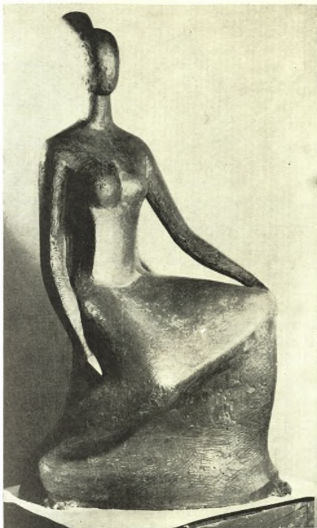
Γ. ΚΑΛΑΚΑΛΑ : ΦΙΓΟΥΡΑ