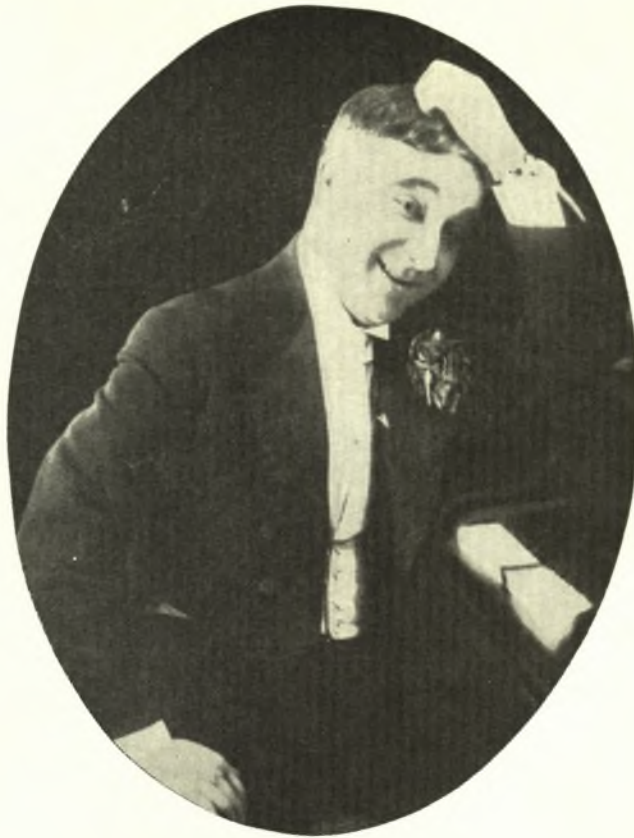
Ο ΑΤΤΙΚ (ΚΛΕΩΝ ΤΡΙΑΝΤΑΦΥΛΛΟΥ)

γνωστοῦ ὡς «Μάνδρα τοῦ Ἴαττικ» (1930-1940), ἐγένετο δημοφιλέστατος, ἐδημιούργησεν δὲ ἰδίαν «σχολήν» καὶ ἀνέδειξε πολλοὺς ἠθοποιούς, τραγουδιστὰς καὶ κονφερασιε. Ἐκτὸς τῶν ἑλαφρῶν τραγουδιῶν συνέθεσεν ἐπίσης μουσικὰς ἐπιθεωρήσεις, ὀπερέττας, δράματα καὶ ἐπρωταγωνίστησεν εἰς τὸν κινηματογράφον εἰς τὴν ταινίαν «Τὰ χειροκροτήματα» τὸ ἔτος (1940).