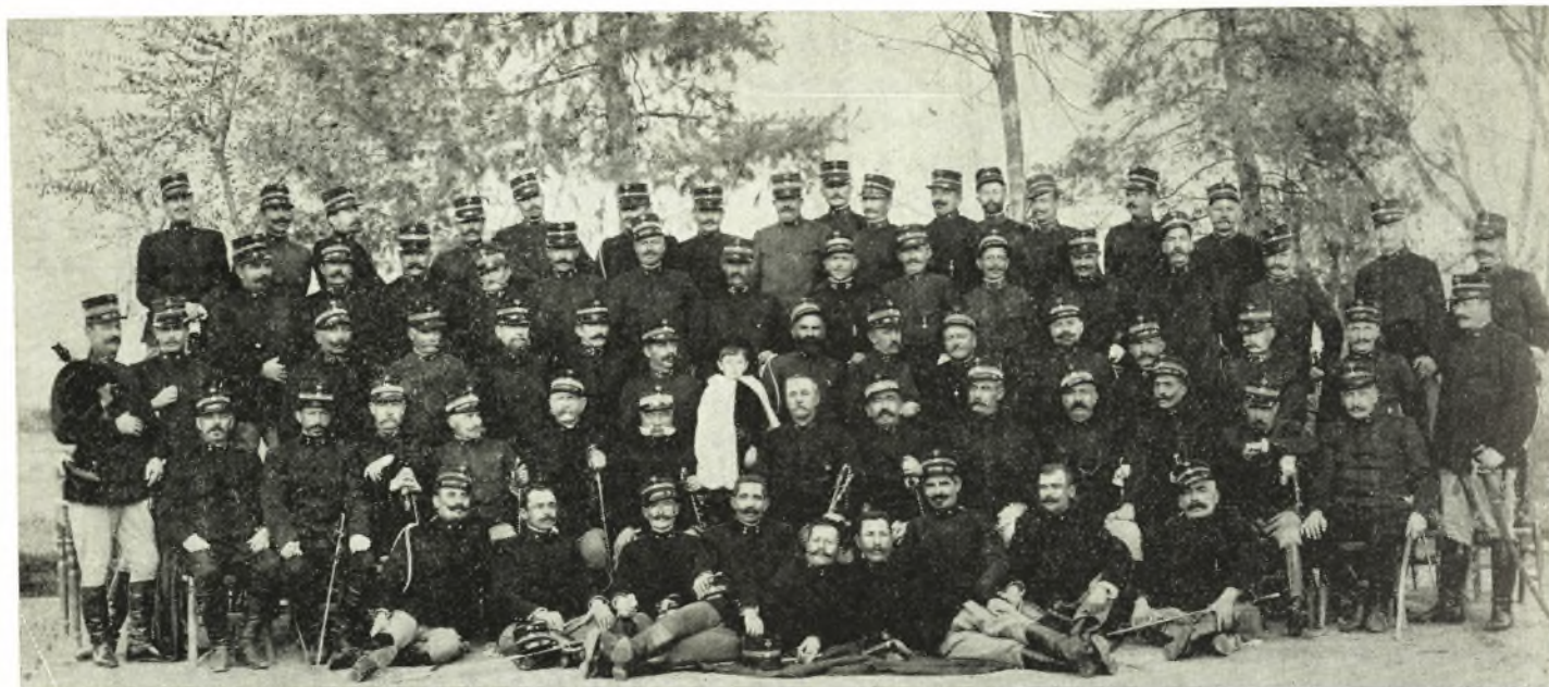
ΛΑΡΙΣΣΑ 1903: Ἀξιωματικοὶ 4 ου Πεζικοῦ Συντάγματος Β α ς Ταξιαρχίας