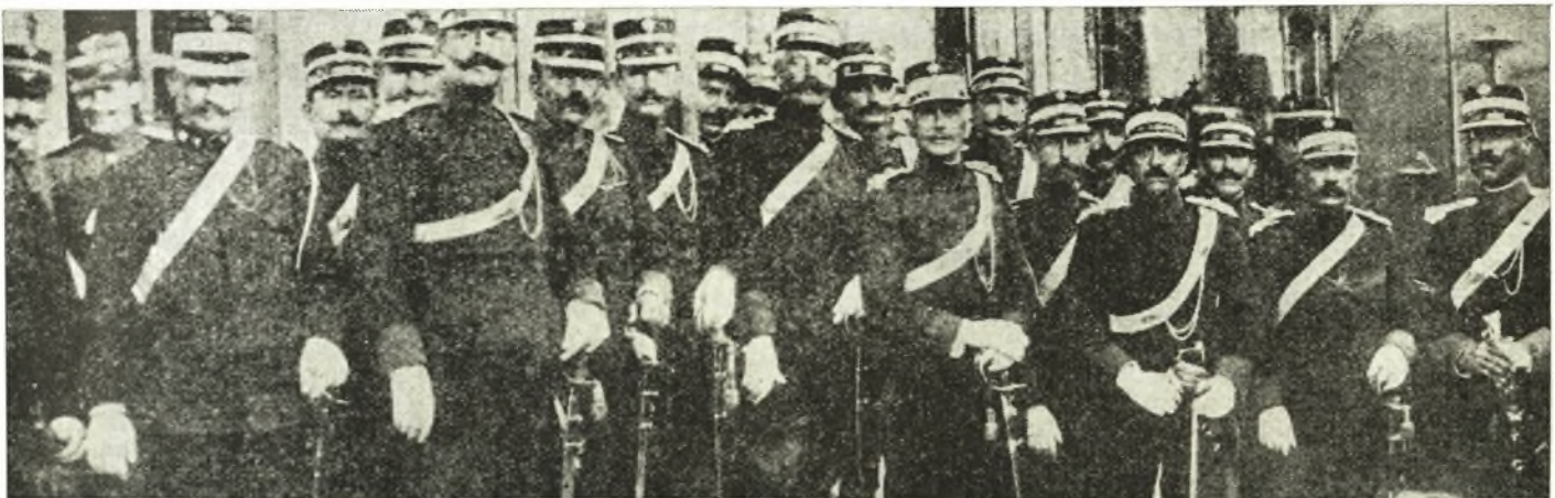
ΒΟΛΟΣ 1911: Ἀξιωματικοὶ τοῦ Ἱππικοῦ ἀναμένοντες εἰς τὸν Σταθμὸν τὴν ἀφίξιν τοῦ τότε Διαδόχου Κωνσταντίνου