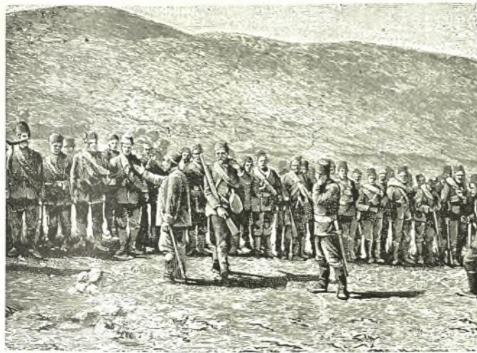
Τύραβος: Τουρκ. στρατός παρά την Μελούναν κατά τὸ 1897