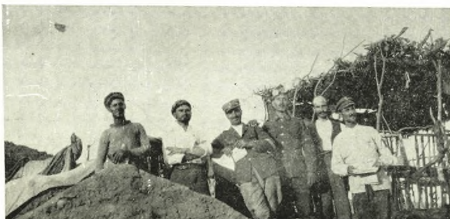
1918: Ὑπαξιωματικοὶ καὶ Ὀπλίται Θεσσαλοὶ εἰς Μαῦρον Δένδρον (Σκρᾶ).

Συνέτριψε τὴν ἀποσκοποῦσαν εἰς τὴν διάσπασιν τοῦ ἐλληνικοῦ μετώπου καὶ ἐνεργηθεῖσαν διὰ δυνάμεως 12 Μεραρχιῶν, ὑποστηριζομένων δὲ ὑπὸ ἰσχυροτάτου πυροβολικοῦ (400 πυροβόλα) καὶ ἰσχυροτάτης ἀεροπορίας, με-