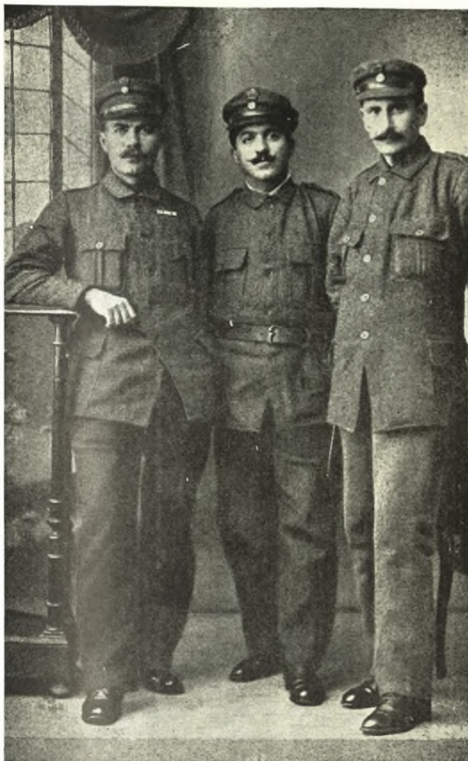
1912-1913: Θεσσαλοί όπλίται