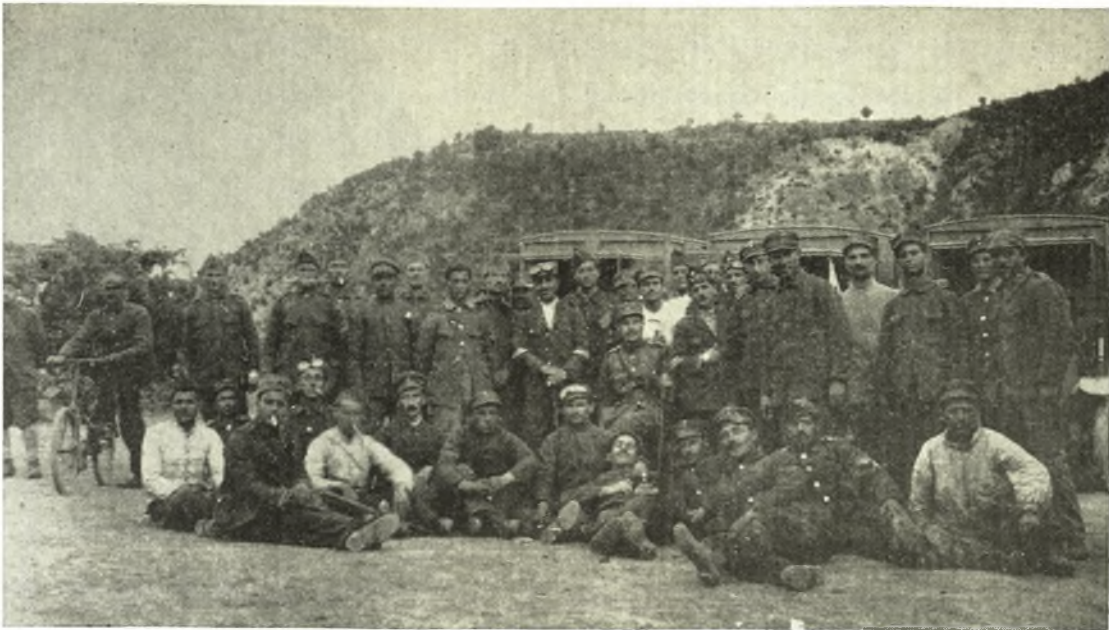
1918: Όμας Θεσσαλών της Ύγειονομικής μοίρας Αυτοκινήτων εις Σκρά

γάλην εαρινήν επίθεσιν των Ίταλων κατά του ύποτομέως αὐτῆς Μπούμπασι (ὕψ. 717 καὶ 731) καὶ ἐπὶ μετώπου μόνον 6 χιλιομέτρων κατόπιν ἑπταήμερων σκληρῶν ἀγῶνων (ἀπὸ 9 ης μέχρι 15 ης Μαρτίου 1941), χωρὶς οὐδὲ σπιθαμὴν ἐδάφους νὰ παραχωρήσῃ εἰς τοὺς Ἰταλοὺς καὶ ἐπενεγκοῦσα εἰς αὐτοὺς βαρυτάτην ἦταν μετὰ βαρυτάτων ἀπωλειῶν. Κατήγαγεν οὕτω μίαν τῶν ὠραιότερων ἑλληνικῶν νικῶν τοῦ Ἑλληνικοῦ ἔπους.