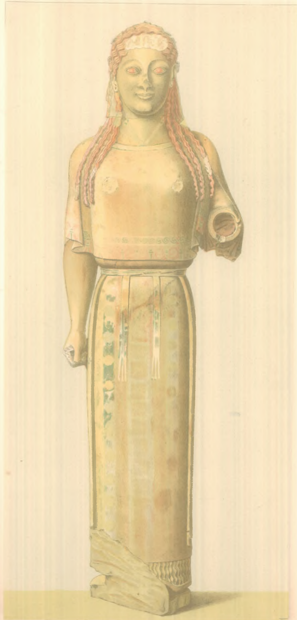
ΑΡΧΑΪΚΟΝ ΑΓΑΛΜΑ ΕΞ ΑΚΡΟΠΟΛΕΩΣ