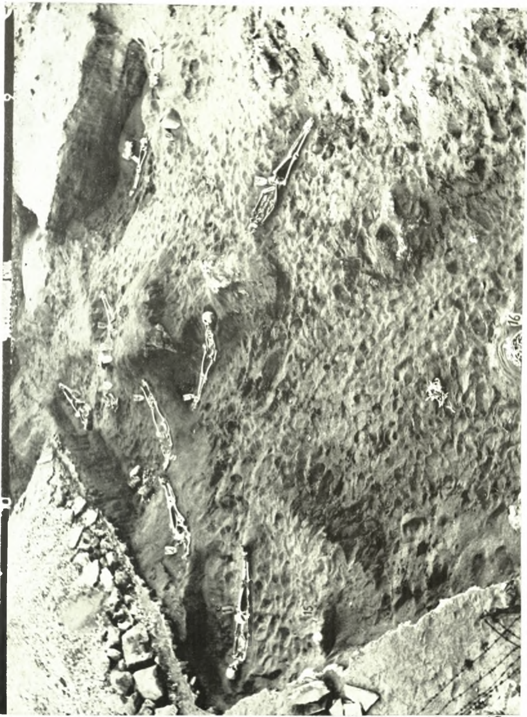
Ρόδος. Σκελετοί προγείριων τυφών παρά τὸ ἐργοστάσιον Σ.Α.Ι.Φ.Ε.