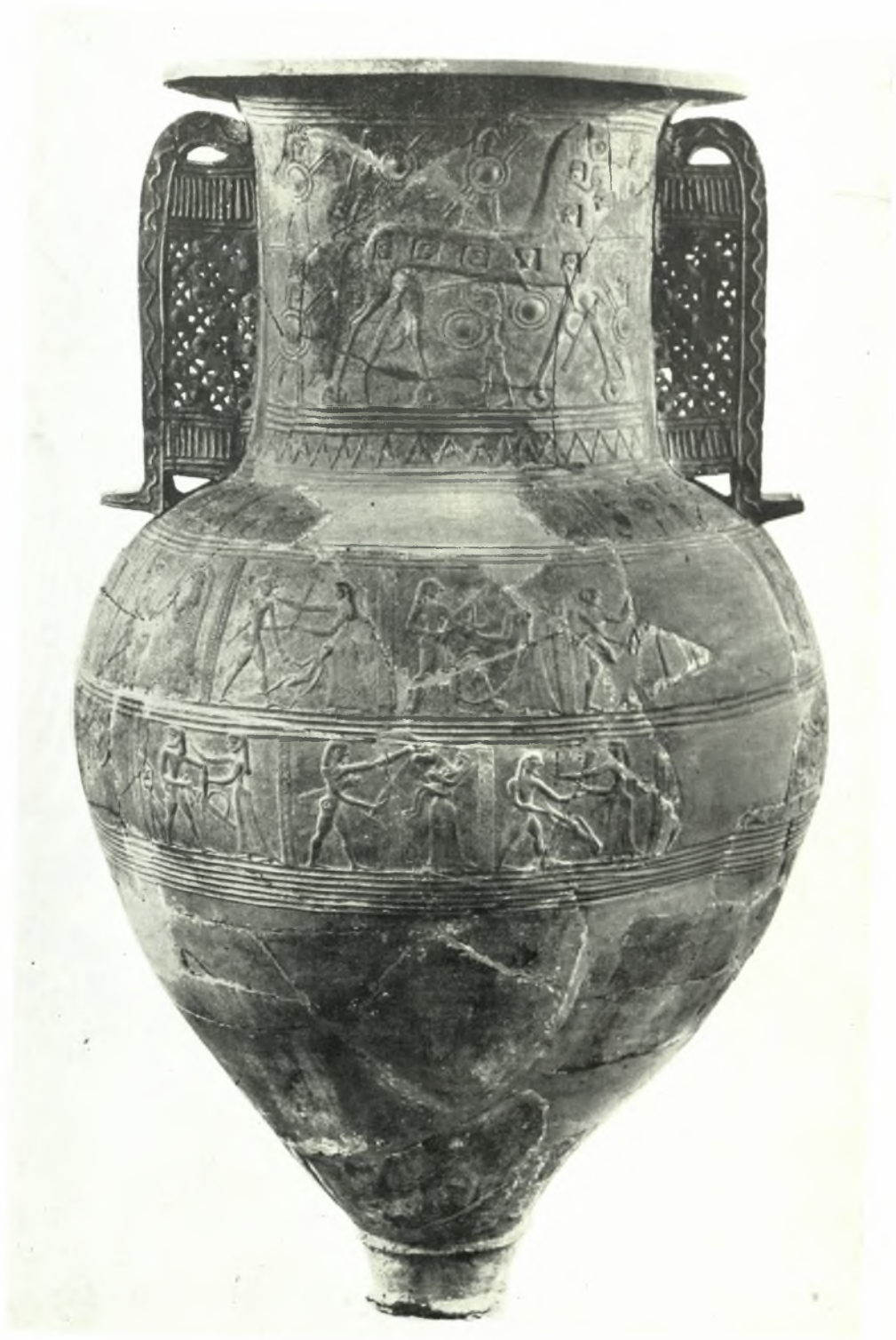
Μύκονος. Μουσείον: Μέγας ἀμφορεὺς μετ' ἀναγλύφων παραστάσεων (7ου π.Χ. αἰ.)