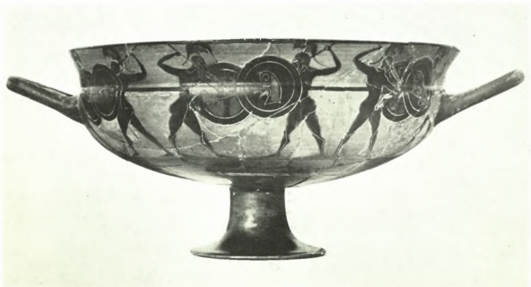
Θήρα: α. Ἄρχαϊκὸν πινάκιον, β. Κύλιξ Σιάνας