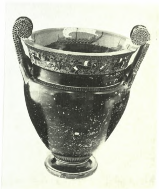
Θήρα: α-β. Μελανόμορφος άμφορεύς, γ. Μελανόμορφος κρατήρ