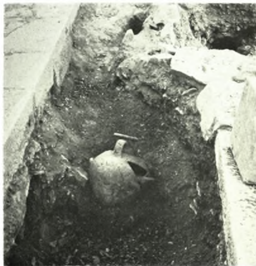
Θήρα : α. Σειρά αρχαϊκῶν τάφων, β. Ταφικαὶ κατασκευαί, συνεχιζόμεναι εἰς βάθος, γ. Συστᾶς πέντε ἀρχαϊκῶν τάφων, δ. Τεφροδόχον ἀγγεῖον