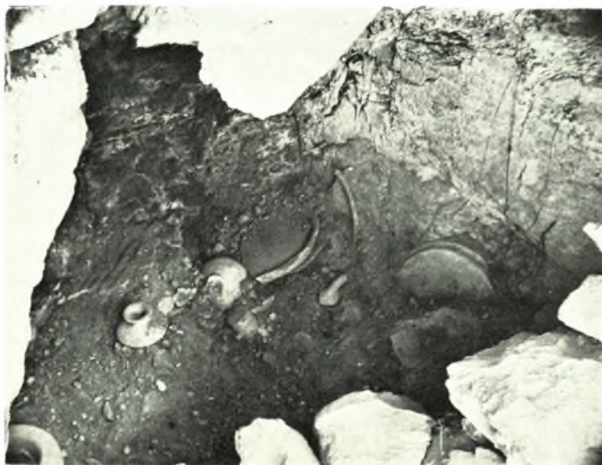
Θήρα: α. Κρηπίδιωμα οικογενειακῶν ταφῶν, β-γ. Θαλαμωτός τάφος