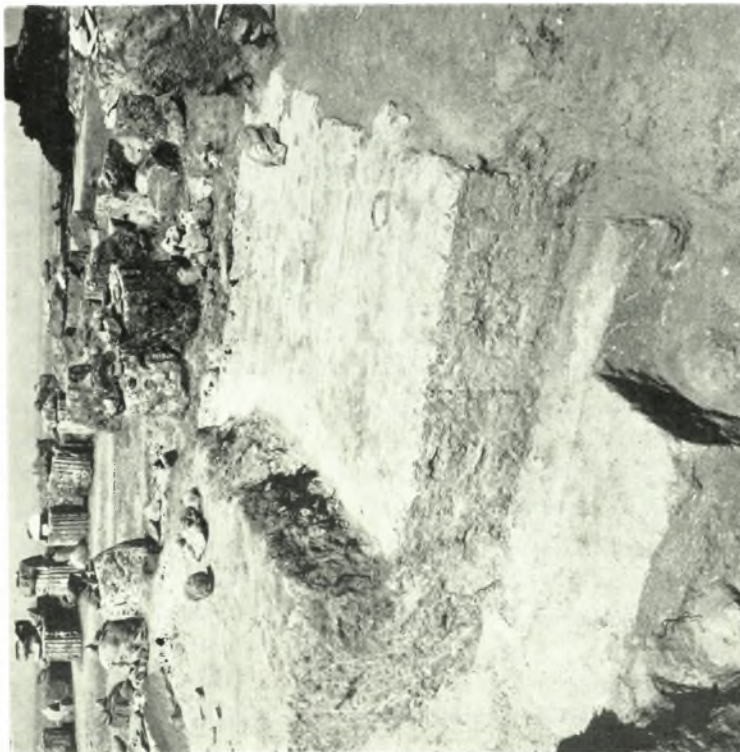
Δ. Μακεδονία. Ανάκτορον Βεργίνης: α. Ο άγωγός εις τὸ Β. άκρον τῆς άνωτ. στοάς, β. Ο βόρειος τείχος