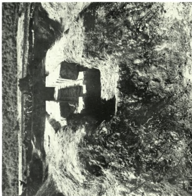
Δ. Μακεδονία. Ἀνάκτορον Βεργίνης: α. Τοίχος τῆς θόλου, β. Ἡ θόλος, τὰ λείψανα τοῦ «βήματος»