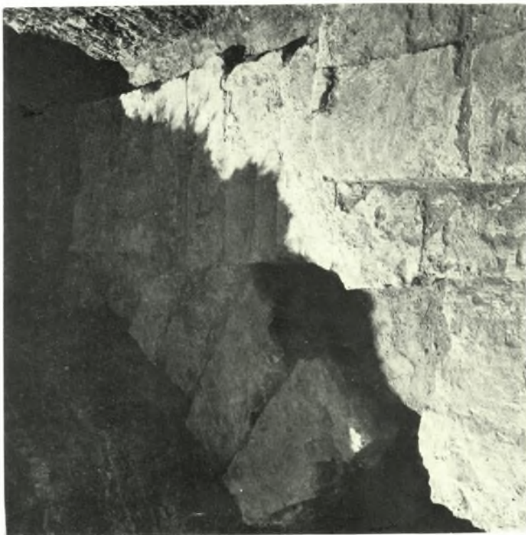
Δ. Μακεδονία. Ἀνάκτορον Βεργίνης: α. Δομῆτα Α. τμήματος, β. Ἡ ὑποδομὴ τοῦ καμπύλου τοίχου