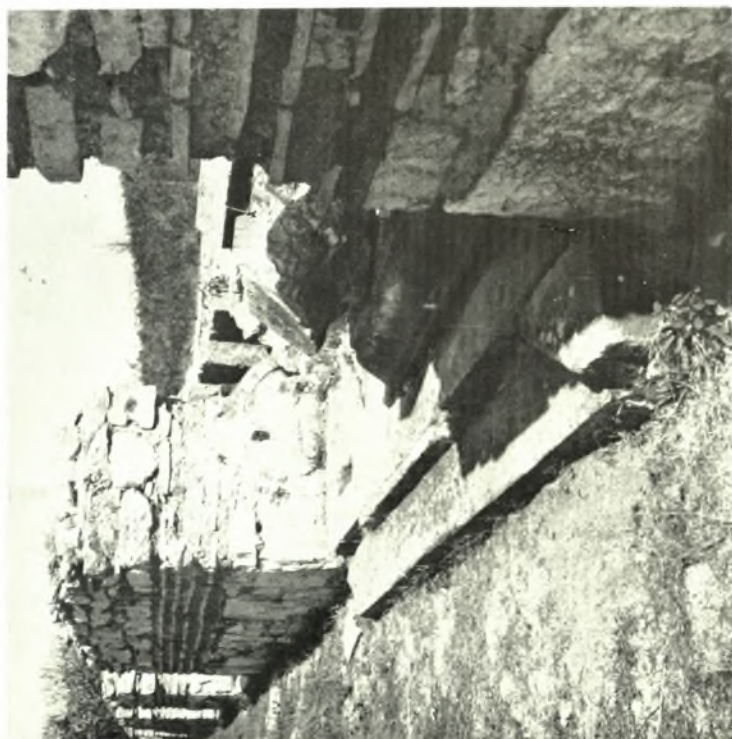
Νικόπολις. Βασιλική Β' Αλκίσοнос: α. Κατώφλιον τῆς θύρας ἀπὸ τοῦ νότιου πρὸς τὸν ναὸν. β. Ἀρχιτεκτονικὰ μέλη τοῦ ἀναστηλωθεμένου θυρώματος τῆς βασιλικῆς