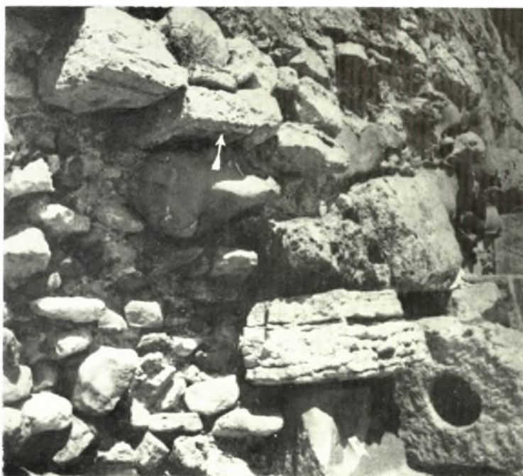
Αιτωλία: α. Κτιστός θάλαμος παρά τὸ χωρίον Παπαδάτες Μακρυνείας, β. Τμήμα τοῦ τείχους Ναυπάκτου παρά τὸν λιμενίσκον ἀριστερὰ τῷ εἰσερχομένῳ· τὸ βέλος δεικνύει τὴν θέσιν τοῦ οἰκοσήμου πρὸ τῆς ἀποτειχίσεως