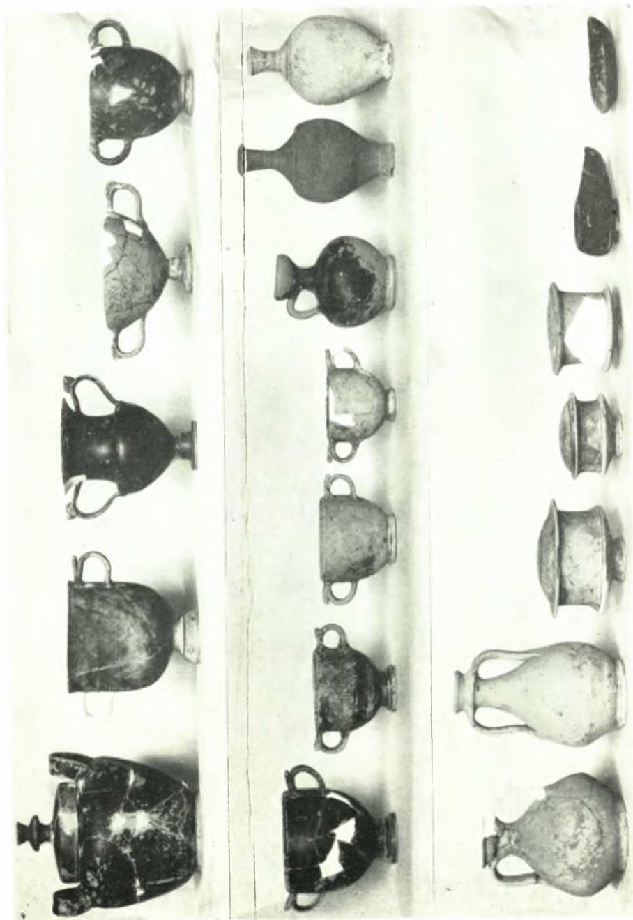
Αιτωλία: α-β. Ἀγγεῖα ἐκ Ναυπάκτου