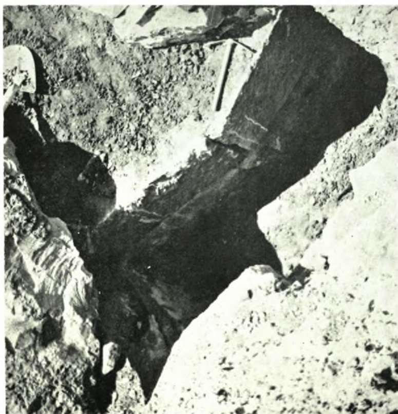
Αιτώλια : α-β. Κιβωτιόσχημοι τάφοι του έν τή συνοικία Βερναρράχη Ναυπάκτου άρχαίου νεκροταφείου