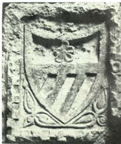
Λιτώλια: α. Ὁ ναός τοῦ Θερμίου Ἀπόλλωνος μετὰ τὰς ἐργασίας συντηρήσεως, β. Κτιστός θάλαμος παρὰ τὸ χωριὸν Παπαδάτες Μακρυνεΐας, γ. Οἰκόσημον ἐκ Ναυπάκτου