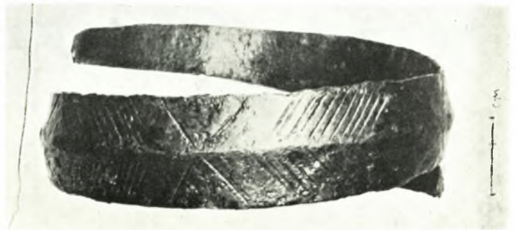
Αίτωλοακαρνανία: α. Πρωτογεωμετρικός κώνθαρος ἐκ Καλυδῶνος καὶ γεωμετρικά ἀγγεῖα ἐκ Παλαιομανίνης, β. Τύποι δακτυλιολίθων ἐκ Στράτου καὶ Ναυπάκτου, γ. Χρυσοῦς ὀφιομόρφος δακτύλιος ἐκ Ναυπάκτου, δ. Χαλκοῦν ψέλιον ἐκ Παλαιομανίνης