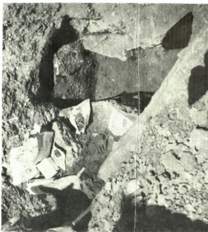
Αίτωλια: α-β. Κιβωτιόσχημοι τάφοι του έν τῆ συνοικία Βαρναρράχη Ναυπάκτου νεκροταφείου