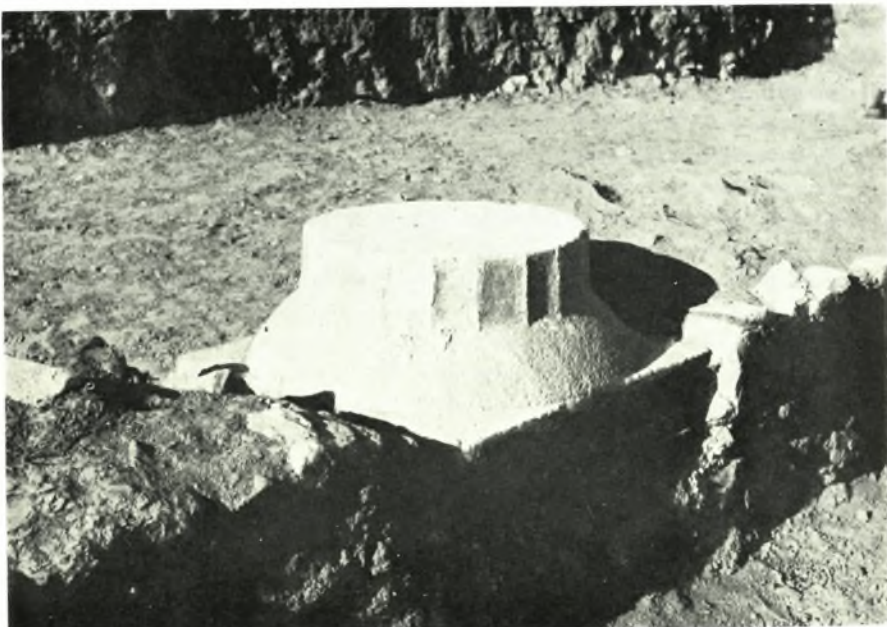
Νέα Ἄγχιλος: α - β. Βάσεις Ν. Στοῦς