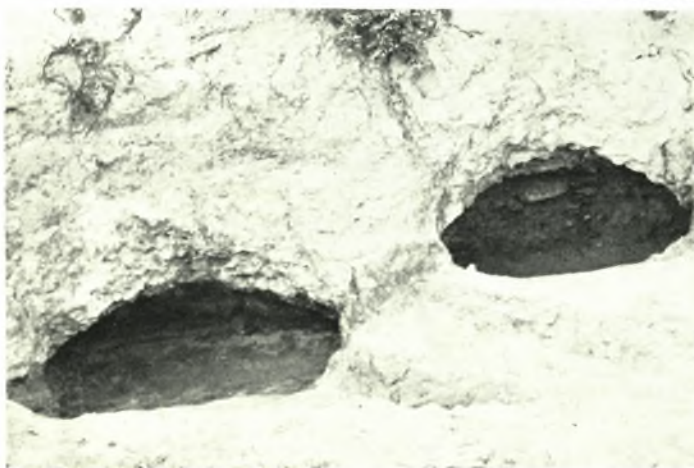
α. Ίωλκός. Στραματογραφική τομή, β. Άποψις της θέσεως τοῦ ἀρχαίου Ὀμολίου ἀπὸ Β. Εἰς τὴν κορυφὴν ἢ ἀκρόπολις, γ. Ὀμόλιον. Σπηλαιώδεις πρωτογεωμετρικοὶ τάφοι