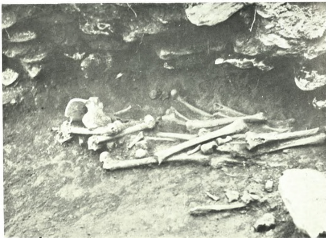
Όμόλιον: α. Πρόχοι οπισθόμητοι εκ σηλαιωδών Πρωτογεωμ. τάφων, β. Κτιστός θολωτός Πρωτογεωμ. τάφος παρά τὸ «Ρέμα Κολιαλῆ»