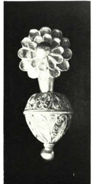
Όμόλιον: α-β. Τάφος Α. Χρυσούν ένώτιον (μέγεθος 2:1) καί χρυσούν μετάλλιον, γ. Τάφος Β. Δακτύλιος (μέγεθος 2:1 περίπου), δ. Τάφος Α. Όρμος χρυσού περιδεραιίου (ύψ. 0,0265 μ.)