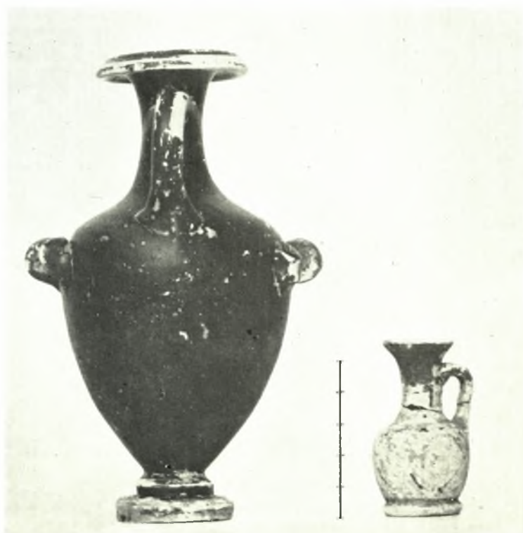
Όμόλιον: α. Τάφος Α. Πολύχρωμα ύλινα ἀλάβαστρα, β. Ἀγγεῖα ἐκ τοῦ τάφου Α