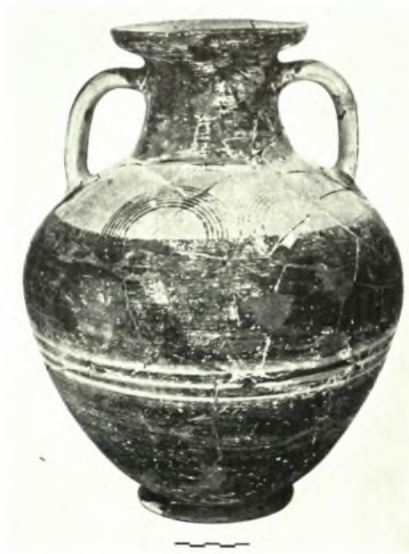
Όμόλιον: α. Έσωτερικόν σπηλαιώδους πρωτογεωμετρικοῦ τάφου, β. Χρυσά κοσμήματα ἐκ Πρωτογεωμετρικῶν τάφων, γ. Πρωτογεωμετρικός ἀμφορεύς τάφου Ι (ἀριθ. Κ. 2550)