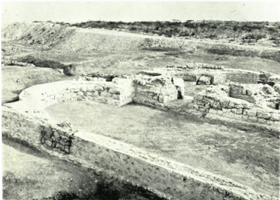
Λέχαιον: α. Τομή εις βάθος έξω τής βορειοδυτικῆς γωνίας τοῦ βορείου πτεροῦ, β. Ὀκτάγωνον. ᾿Αποψις ἐκ ΒΔ., γ. Βαπτιστήριον, προθάλαμος. ᾿Εκ ΒΔ., δ. Βαπτιστήριον, προθάλαμος καὶ τετράκογχον. ᾿Εκ ΝΔ.