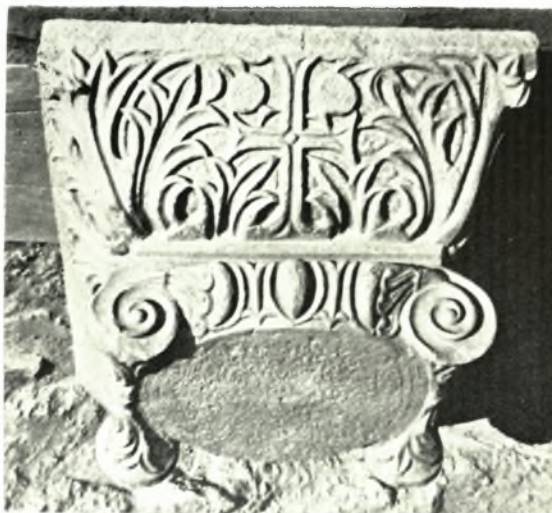
Λέχαιον: α. Κιονόκρανον ΝΕΚΤΟΛΥΔΙ, β. Κιονόκρανον Θεοδοσιανόν (λεπτομέρεια), γ. Ίωνικόν κιονό- κρανον, δ. Κιονόκρανον βυθισμένον ἐντός τοῦ νοτίου κλίτους Δ. ΠΑΛΛΑΣ