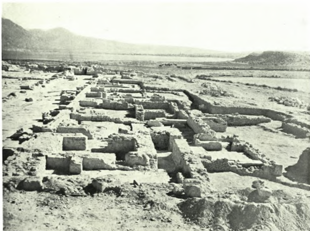
Λέχειον: α. Ἐποψὶς τῆς βασιλικῆς ἐκ Δ., β. Νότια προσκτίσματα καὶ νοτιὰ κατοικία ἐκ Δ.