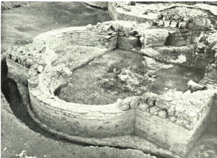
Λέχαιον: α-β. Τετράκογχον ἐκ ΒΑ. καὶ ἐκ ΒΔ.