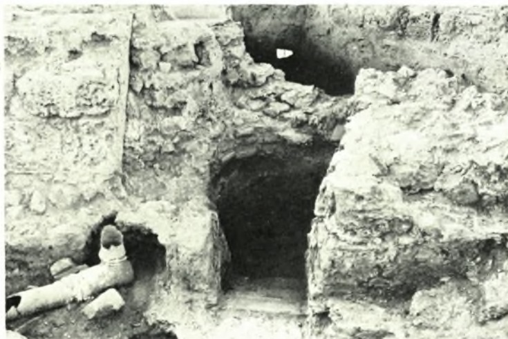
Λέχαιον: α. Ὀκτάγωνον. Κεντρικὴ κολυμβήθρα. Ἐκ ΒΔ., β. Ὀκτάγωνον. Κολυμβήθρα τῆς ΒΑ. κόγχης. Ἐκ ΒΔ., γ. Ὑδραυλικαὶ ἐγκαταστάσεις καὶ κάμινος μεταξὺ ὀκταγώνου καὶ προθαλάμου. Ἄποψις ἐκ. Ν.