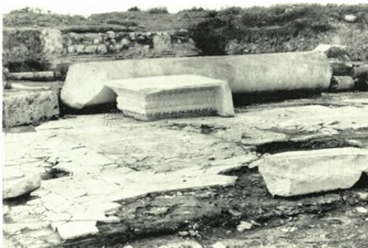
Λέχαιον: α. Ἐποψὶς τοῦ νοτίου κλίτους πρὸς τὰ ΝΔ., β. Ἐποψὶς τοῦ βήματος καὶ τοῦ νοτίου περυγίου ἐκ ΒΔ., γ. Κιλλιβαντοειδῆς ἐπίθημα καὶ μέγας κίων