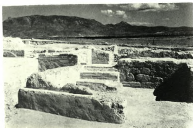
Λέχαιον: α. Βασιλική. Βόρειον περύγιον, ΒΑ. γωνία με όπην βόθρου, β. Κατασκευή κτιστή εις τήν ΒΔ. γωνίαν τοῦ βορείου περυγίου, γ. Κατοικία νοτιοανατολική