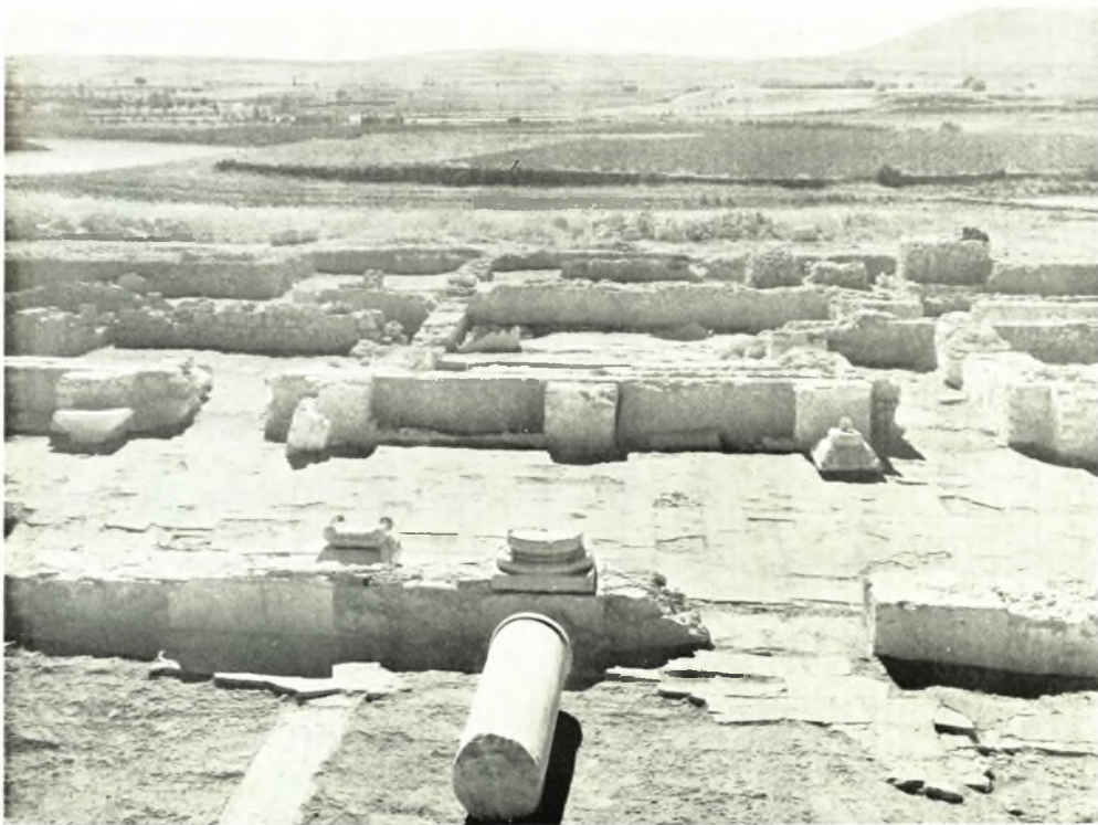
Λέχαιον: α. Δεξαμενή έξω τῆς βορειοδυτικῆς κατοικίας, β. Ἄποψις ἐκ τοῦ κεντρικοῦ κλίτους πρὸς Ν., παρὰ τὰ νότια προσκτίσματα