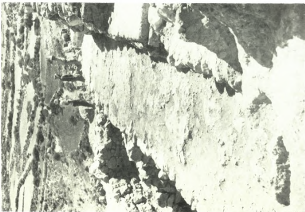
Μυκῆναι. Ἐνασκαφὴ Ἀκροπόλεως: α. Δρόμος ἀπὸ τὴν κατεῦθυνσιν τῆς Πύλης τῶν Λεόντων πρὸς τὴν Β. κλίμακα, β. Ἀναλημματικὸς τοῖχος τοῦ κύκλου Α καὶ τὰ ὑπολείμματα τοῦ ὑπὸ τὰ θεμέλιά του τοῖχου