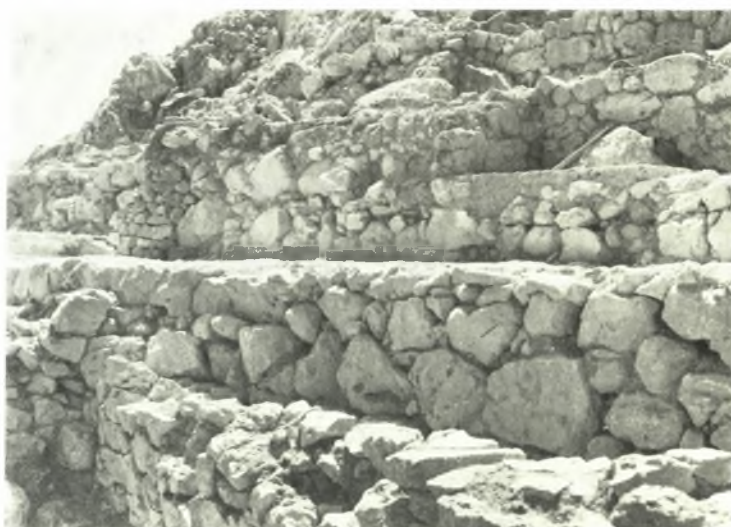
Ἀνασκαφή Ἀκροπόλεως Μυκηθῶν: α. Τοῖχος κατὰ τὴν ΒΔ κλιτῶν, β. Ἀναλημματικὸν τεῖχος τῆς ἀπὸ τῆς Πύλης τῶν Λεόντων ὁδοῦ