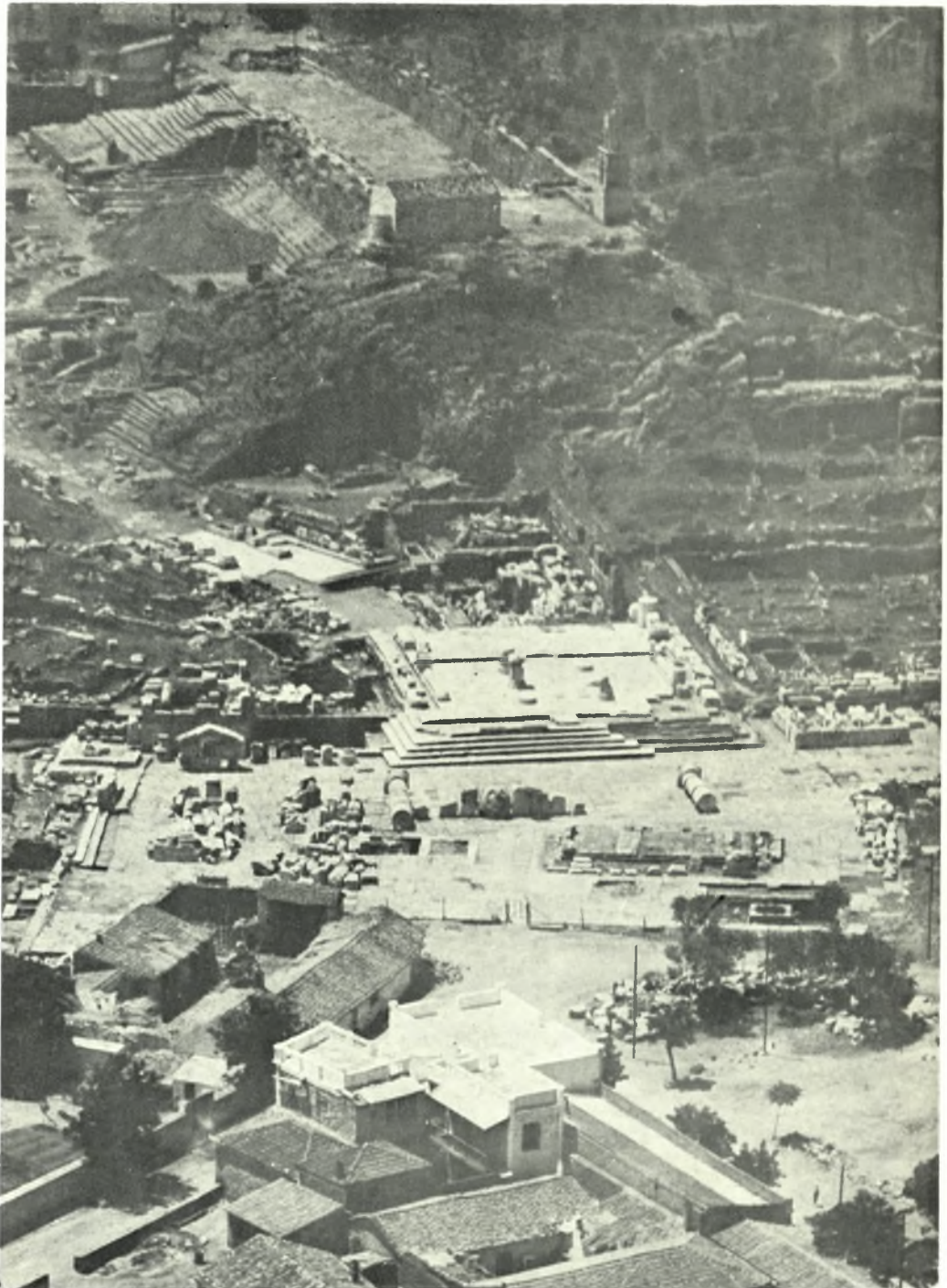
Ἐλευσίς. ἼΑποψις ἀπὸ ἀεροπλάνου τῆς Ρωμαϊκῆς αὐλῆς