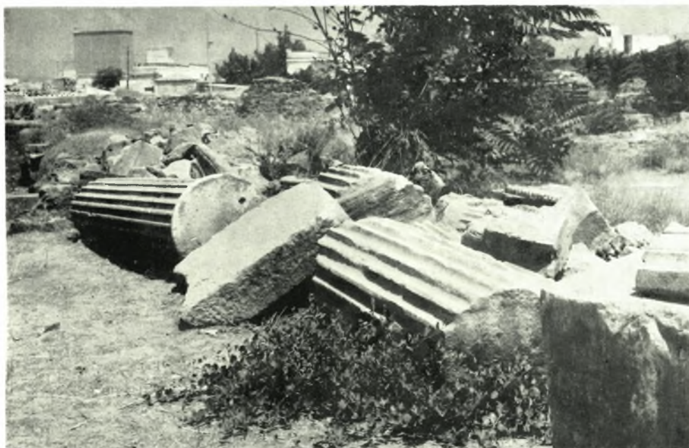
Ἐλευσίς: α-β. Ἀρχιτεκτονικά μέλη ἀνατολ. θριαμβευτικῆς ἀψίδος