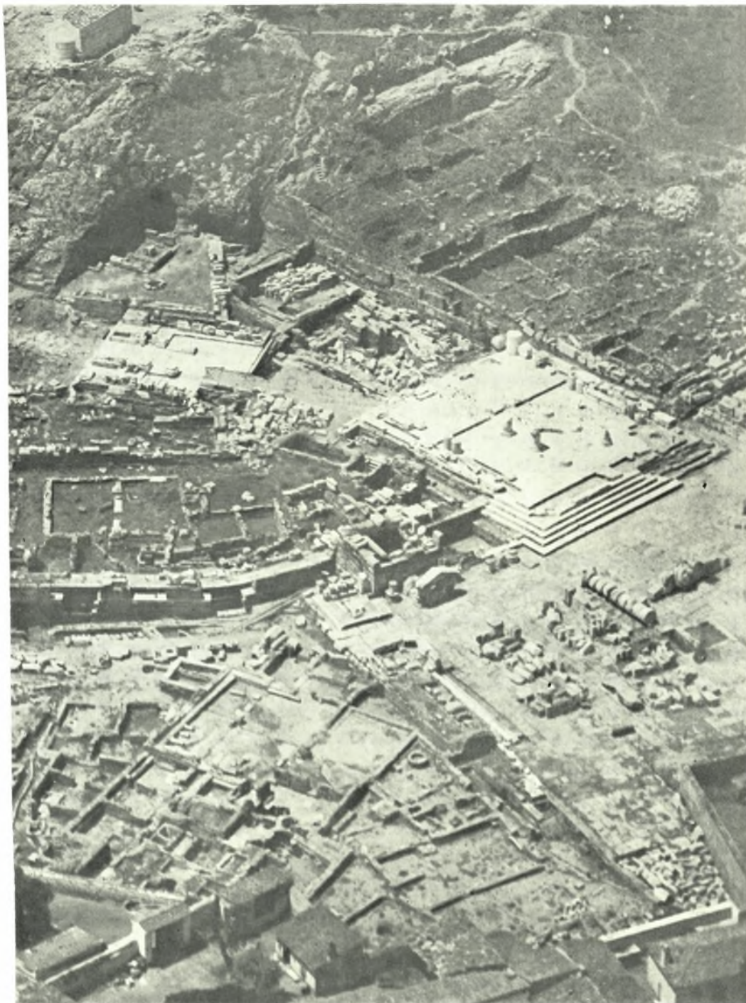
Ἐλευσίς: Ἐποψίς ἀπὸ ἀεροπλάνου τῶν Μεγάλων καὶ Μικρῶν Προπυλαίων