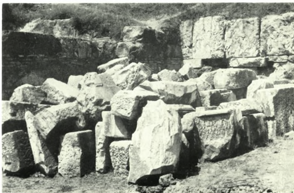
Ἐλευσίς: α-β. Ἀρχιτεκτονικά μέλη Προπυλαίων