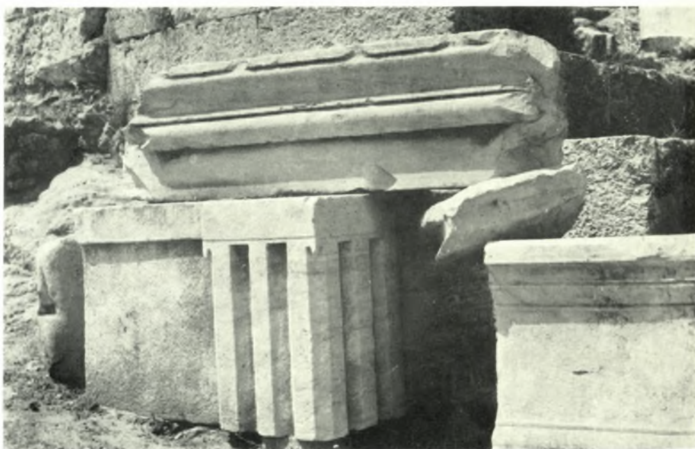
Ἐλευσίς: α. Ἐπιγραφή Μικρῶν Προπυλαίων, β. Ἀρχιτεκτονικά μέλη Θησαυροῦ