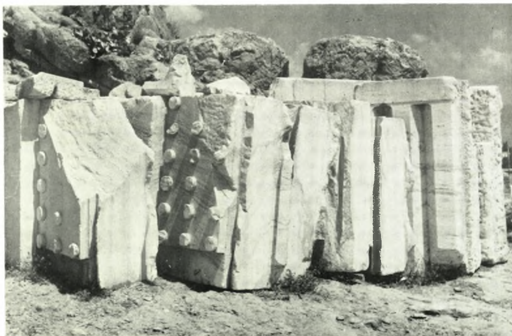
Ἐλευσίς: α-β. Ἀρχιτεκτονικά μέλη Τελεστηρίου