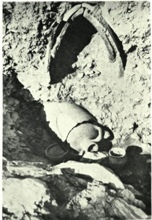
Ἀθήναι. Ἀνασκαφαὶ νοτιῶς Ὀλυμπίου: α. Ἀνατολ. πλευρὰ τοῦ Βαλεριανείου τείχους. Ἄνω δεξιὰ τὰ θεμέλια τοῦ ρωμ. ναοῦ, β-γ. Τάφοι καὶ ἀγγεῖα ἐκ τοῦ πρὸ τοῦ Βαλεριανείου τείχους ἀνασκαφέντος ἐκτεταμένου νεκροταφείου τῶν ἀρχῶν τοῦ β' ἡμίσεος τοῦ 3ου μ.Χ. αἰ.