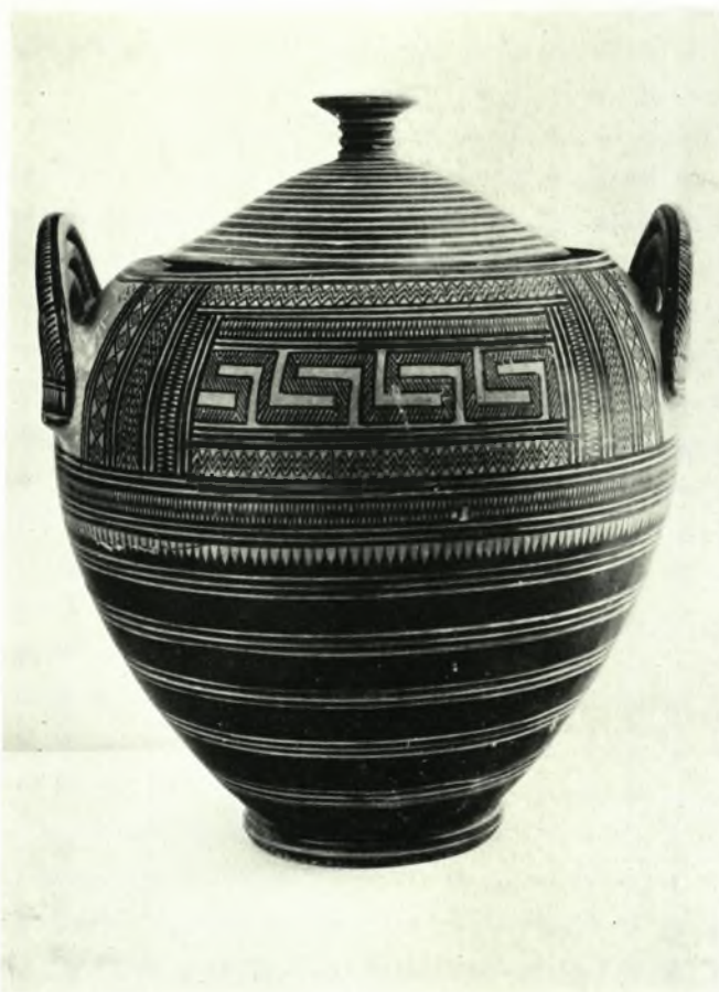
Ἄθῆναι. Ἀνασκαφή οἰκοπέδου Ἀγγελοπούλου: α. Δάπεδον ἐξ ἐγχρώμων μαρμάρων, μεταφερθὲν ἤδη εἰς τὸ Τζαμί τῆς Ῥωμαϊκῆς Ἀγορᾶς, β. Μεγάλη τεφροδόχος βαθεῖα πωξίς τῆς γεωμετρικῆς ἐποχῆς