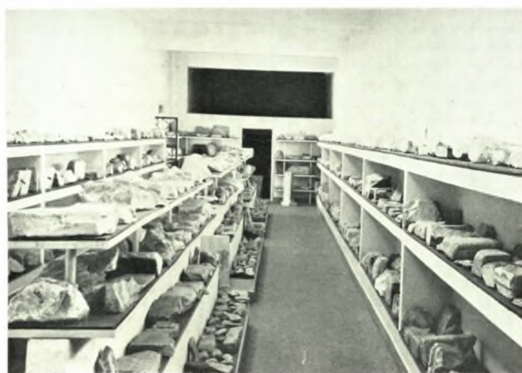
Ἐθνικὸν Ἀρχαιολογικὸν Μουσεῖον. Ἐπιγραφικὴ Συλλογὴ: α. Ἐκ τῶν μέσων τῆς αἰθούσας 9, β. Ἐκ τοῦ δεξιῶν τῆς αἰθούσας 9, γ. Ἐκ τοῦ δεξιῶν τῆς αἰθούσας 6