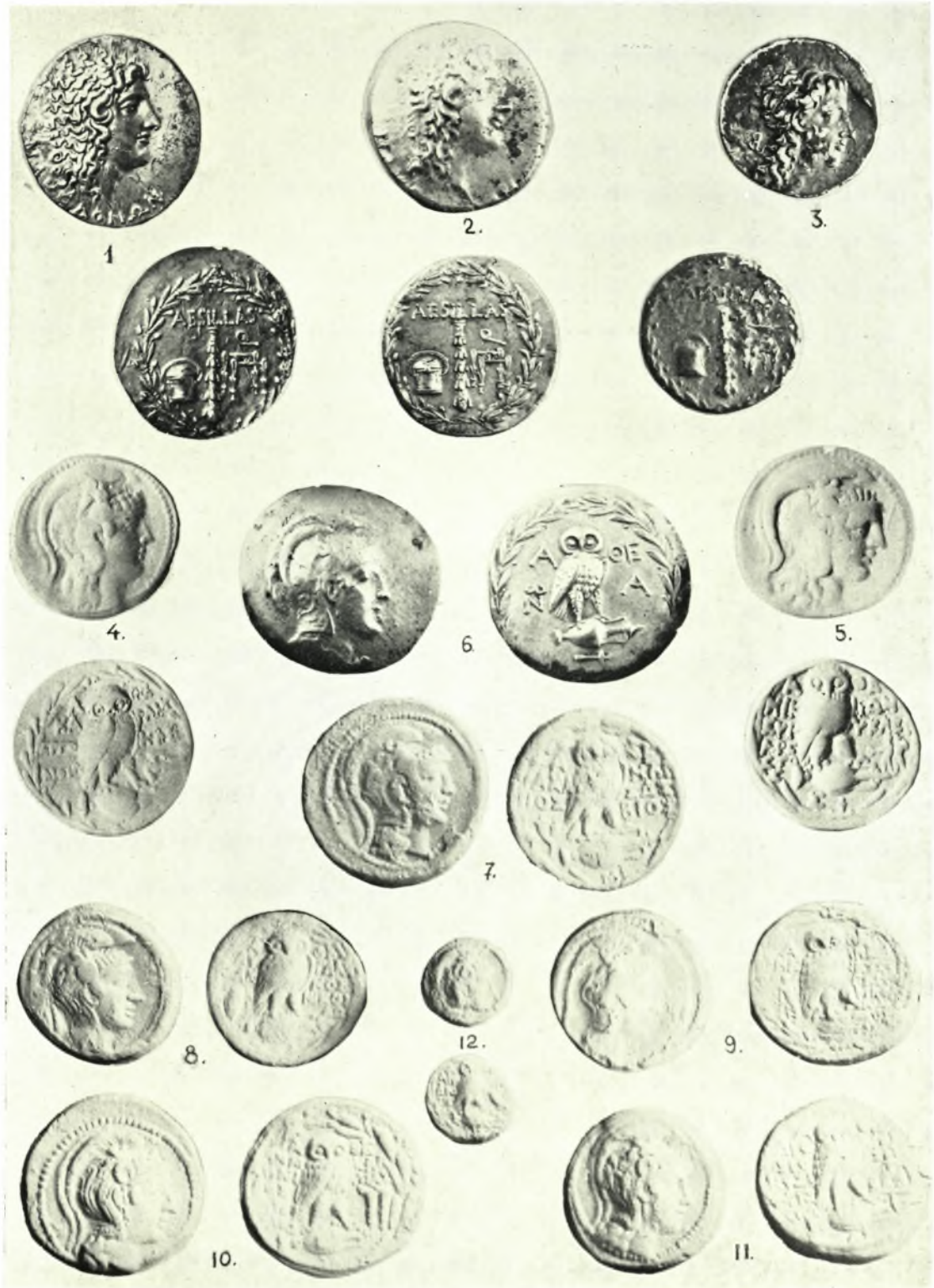
Ἐθνικὸν Ἀρχαιολογικὸν Μουσεῖον. Νομισματικὴ Συλλογὴ