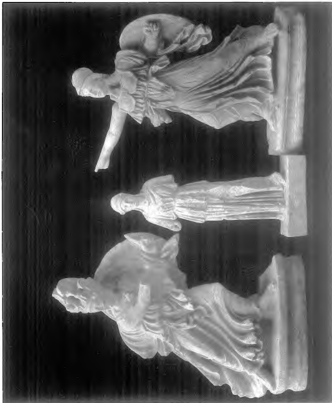
Μουσείο 'Αθηνών, Παναθήναιον.